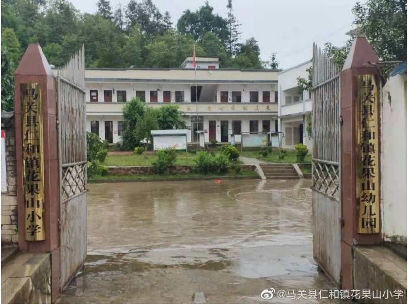
@马关县仁和镇花果山小学