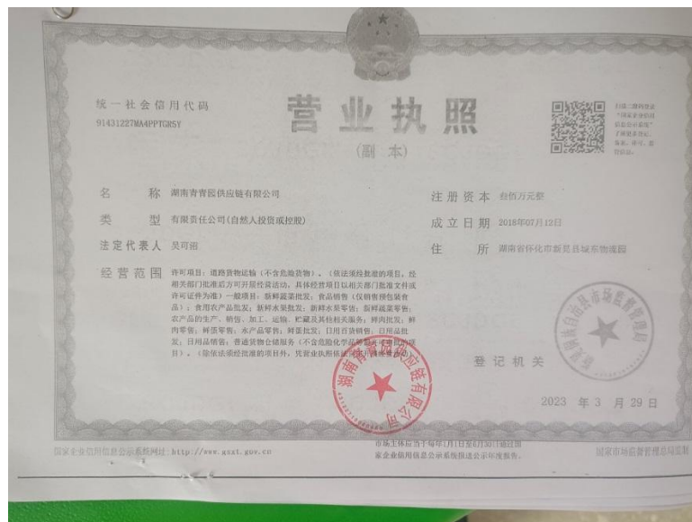
湖南青青园供应链有限公司营业执照