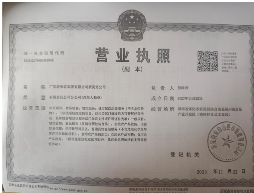
广东好来客集团有限公司营业执照

整改结果：我校食材采购是通过湖南青青园供应链有限公司和广东好来客集团有限公司两个地点采购。上次检查时已提供湖南青青园供应链有限公司营业执照，缺少广东好来客集团有限公司营业执照。过后学校及时与配送公司联系，获取相关许可证和资质。