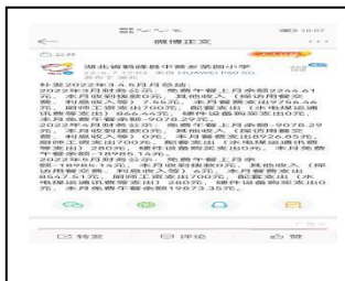
3-5 月份总结微博已补发