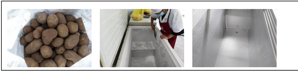
现采购的是新鲜本地土豆