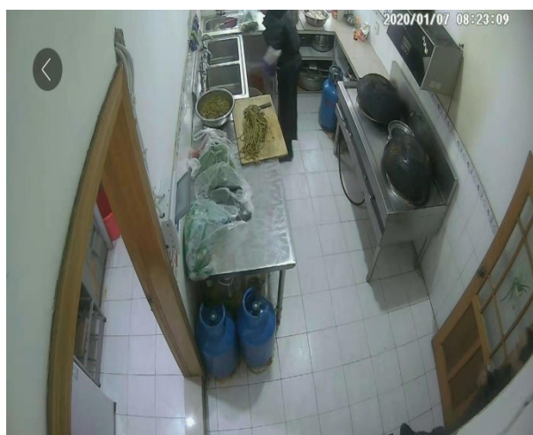
厨房卫生整改前：如上图