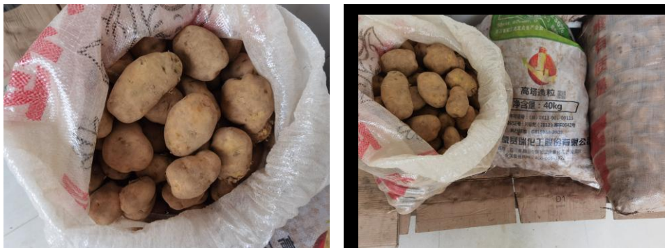
食堂现在使用的土豆图片

整改措施：发芽土豆已由供应商更换为今年产出的土豆，学校今后将严把食材采购验收关，确保采购的原材料合格、安全，杜绝此类现象的发生。