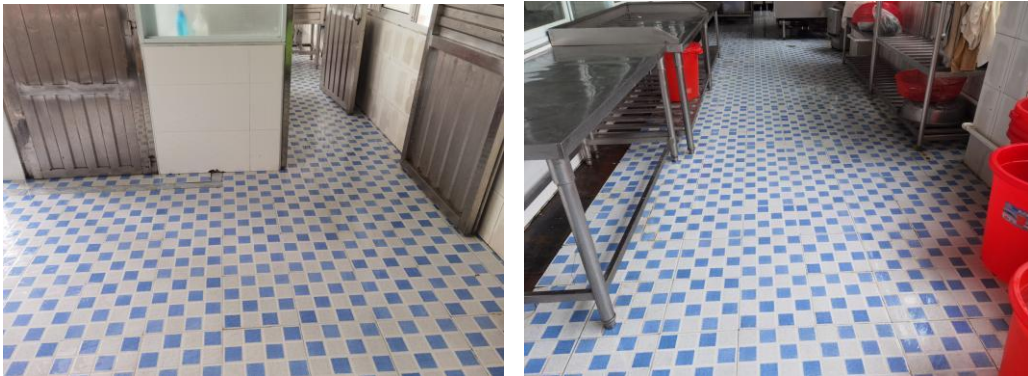
食堂操作间地面图片

整改措施：学校要求食堂工人每天就餐后用洗涤剂冲洗地面，平时有油污及时冲洗，并保持地面干燥。