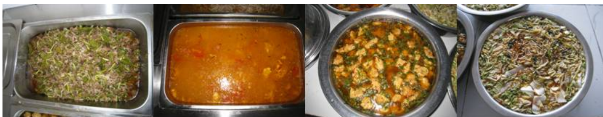
图 7 当日菜品

调查当天的菜谱为粉丝白菜、白萝卜炒牛肉、酥肉和紫菜蛋汤。与微博公示的表述有差距, 但是所用食材基本一致。