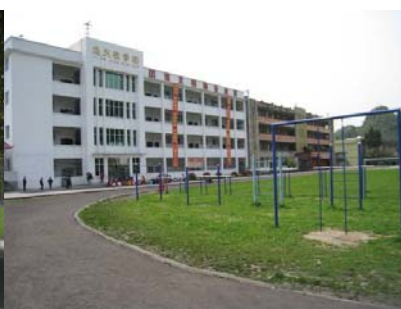
图 2 学校内景