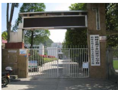
图 1 学校外景