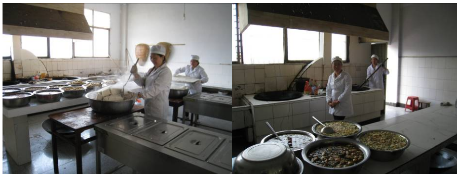
图 4 厨师正在备餐组图

调查人员中午 11 点到达该校, 厨师正在备餐。该校的食堂有两个工作间。各 4 名厨师按两个工作小组进行工作。发现几位厨师都着工作服正在备餐, 且都比较干净整洁。据介绍, 该校对厨师卫生很重视, 就工作服讲, 若发现工作期间未配穿工作服, 将会进行罚款。