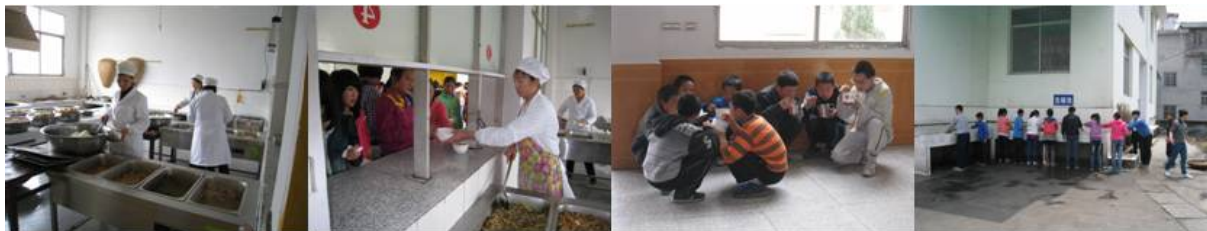
图 6 学生排队、盛饭和洗碗组图

用餐的过程: 下课后, 学生携自备餐具到教学楼前集中排队到餐厅, 然后在厨窗排队打饭。盛饭后, 在食堂内就餐, 就餐完毕在食堂外的专用洗碗池洗碗。然后餐具自行保管。该过程有两个问题, 一是学生餐前洗手环节没有监督, 二是餐具的消毒工作有待改善。