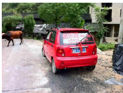
图 1 所租用车辆

调查人员 9 月 9 日早上来到长沙,下火车后马不停蹄赶往长沙汽车南站,搭乘长沙到新晃的长途车。此长途车每天只有早上 10 点钟的一班车,9 点半开始检票,上车后对号入座,如果去的晚没票的话会很麻烦。该车票价 180 元,全程高速约 6 个小时。之后入住新晃县佳程假日酒店,标准间 128 元,设施完备,环境安全。(从汽车站到佳程假日酒店打车 5 元)本次行程将调查林冲乡和中寨镇 2 个乡 8 所学校,每天 2 所。住县城,与一司机吴师傅协商后以每天 200 元的价格包车前往。吴师傅电话: 13874401524,需要包车的同志可与她联系。