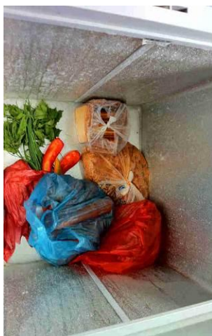
图 12 冰柜里存放的食材

该校每周赶集时采购一次食材,当日刚买回了一周的食材,有辣椒、酸菜、四季豆、芹菜、豆芽。冰柜里存有酸菜、长豆角、红萝卜、红豆腐,干净整洁。