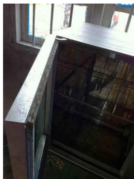
图 5 消毒柜长期未使用