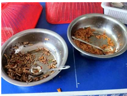
图 11 当天剩下的饭菜