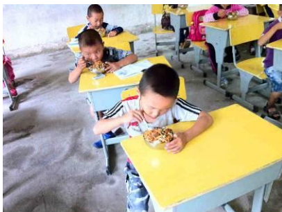
图 8 在自己的课桌前用餐

老师能与学生同时就餐, 学生饭不够吃可以再盛, 但是统一配备的碗比较小, 盛完饭菜后容易掉落形成浪费。学校内有小商店, 没有乳制品贩卖但有面包, 调查人员特意询问了几名学生, 学生均表示没有吃过统一购买的面包。