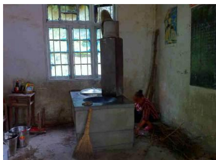
图 4 灶台干净

调查人员去的时间较早,厨房卫生良好,砧板、灶台很干净。但是消毒柜上有很多灰尘,明显长期未使用。钟老师说消毒柜只用过一次就坏掉了,而厨师却说消毒柜是好的,但嫌麻烦就没有使用。