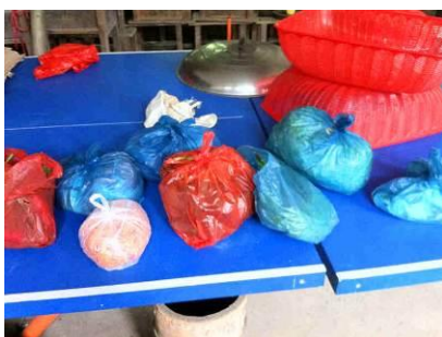
图 13 当日新买的食材