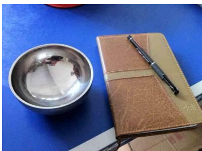
图 9 统一配备的碗太小