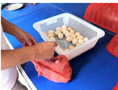
图 10 每人一个煮鸡蛋

当天菜谱为肉炒红豆腐、炒酸菜、煮鸡蛋 (每人一个, 放学后发放), 学生在让厨师盛饭时可选择吃肉炒红豆腐多一些还是炒酸菜多一些, 调查者随同学生一起用餐, 菜品、米饭质量均可, 整体份量足够且有剩余。