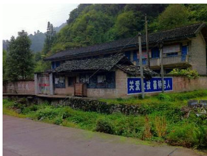
图 2 学校外景

马王村小位于湖南省怀化市新晃县林冲乡,该校设有学前班、一年级、二年级,共有学生 37 人,实行走读制。