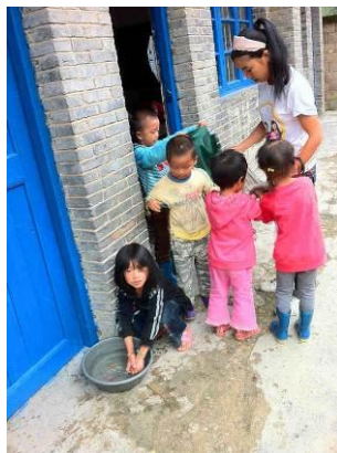
图 6 自觉洗手

开餐后, 学前班学生由老师带领进行了饭前洗手, 餐具全部用防尘罩罩着, 学生在教室的课桌上吃饭。学生盛饭自觉排队, 看得出不是临时安排, 饭后菜品进行了留样。