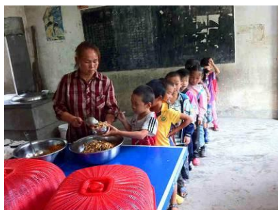
图 7 自觉排队