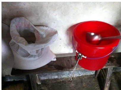
图 12 厨房存放的米

有的采购物品和价格都是厨师一人说了算。而该厨师采购的物品一般来自村里和其自己种的菜,购买的食用油也不正规,而学校用的大米,据杨老师说竟然是厨师自己从家里拿来的,向她报明斤数后一次性付账,这种糊涂账是必须严格禁止的。