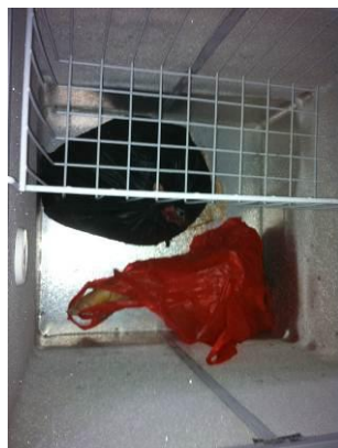
图 6 冰柜冷冻室

猪腿, 冷藏室发现生肉与豆芽、辣椒混放现象, 还有直接扔在冰柜中的豆干和一碗厨师剩饭。