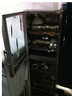
图 9 消毒柜并没有插电源

调查人员赶到该校时学生已经吃完饭, 没有现场看到就餐情况, 从厨房卫生的保持情况以及对学生的走访, 调查人员认为该校的就餐卫生保持的还是很不错的。但是餐具同样没有按要求进行消毒处理, 菜品也没有留样。