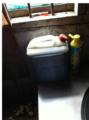
图 13 做饭用的油