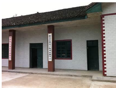
图 7 村民委员会在校的隔壁

另外, 调查人员在冰柜的对面发现一个柜子, 里面存放着一些白瓷碗, 据厨师介绍, 这些碗是村里的。因为刘家村村民委员会设在校的隔壁, 当上级来人检查时中午就在这里招待客人。这样极易发生用免费午餐资金所购菜品被挪用的情况, 需要特别注意规范来往账目。