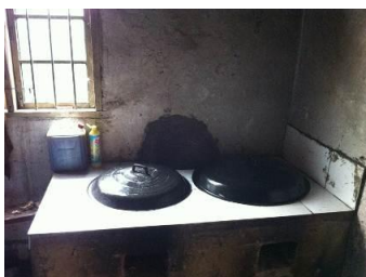
图 4 灶台

调查人员发现该学校厨房卫生保持不错,灶台干净,案板用新的塑料布衬底,调查人员也在采购单上看到了此项支出。