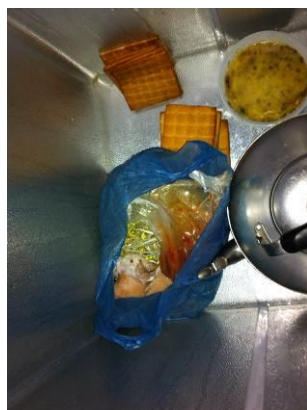
图 7 冰柜冷藏室

另外, 调查人员在冰柜的对面发现一个柜子, 里面存放着一些白瓷碗, 据厨师介绍, 这些碗是村里的。因为刘家村村民委员会设在校的隔壁, 当上级来人检查时中午就在这里招待客人。这样极易发生用免费午餐资金所购菜品被挪用的情况, 需要特别注意规范来往账目。