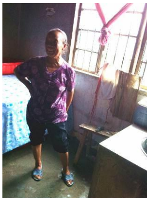
图 3 刘家村学校厨师

调查人员来到该校时厨师已经锁门回家,经杨老师电话联系后其赶来学校,目测其个人卫生情况一般。