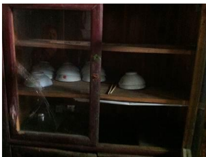
图 8 村委会招待用碗