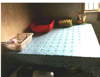
图 5 案台