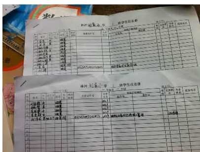
图 2 刘家村小花名册

刘家村小位于湖南省怀化市新晃县林冲乡,该校设有学前班、一年级、二年级,共有学生 22 人,实行走读制。