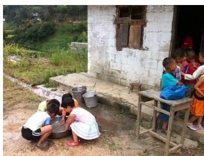
图 7 大家洗手排队吃饭

半江小学的水源是接至附近半江村的自来水，水龙头在厨房外面。开饭后学生能够自觉洗手排队，该学校房间均有前后两个门，学生从前门进入盛饭，从后门回教室吃饭，秩序井然。