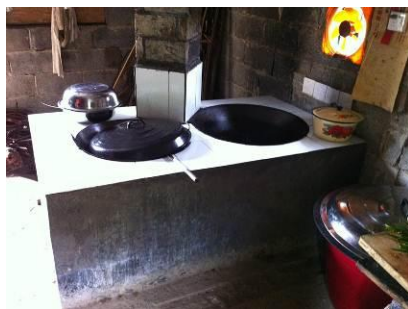
图 5 灶台干净