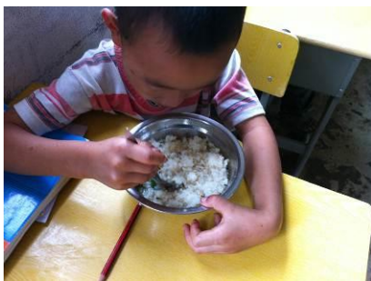
图 11 菜吃的比较快的孩子