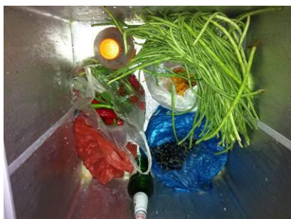
图 12 菜品