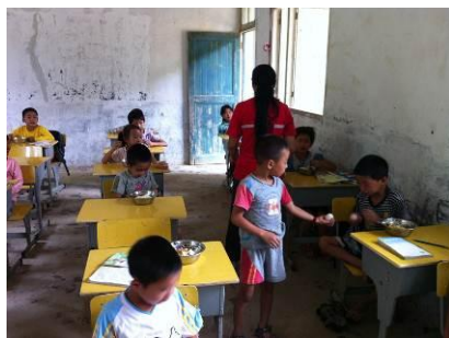
图 8 老师在发今天的煮鸡蛋