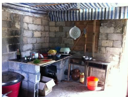
图 4 案台整洁

调查人员发现该学校厨房卫生非常好,虽然已经开始做饭,但是灶台、案板仍十分干净。半江小学的消毒碗柜是正常使用的,看得出来老师对食品卫生的重视。