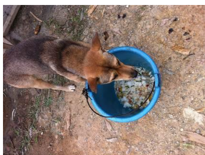
图 9 剩饭菜便宜了大黄

当天调查人员和老师、同学们一同就餐,能够组织学生洗手排队。但是学前班的一些孩子吃不完饭菜,有浪费的现象,希望老师在盛饭时多注意。