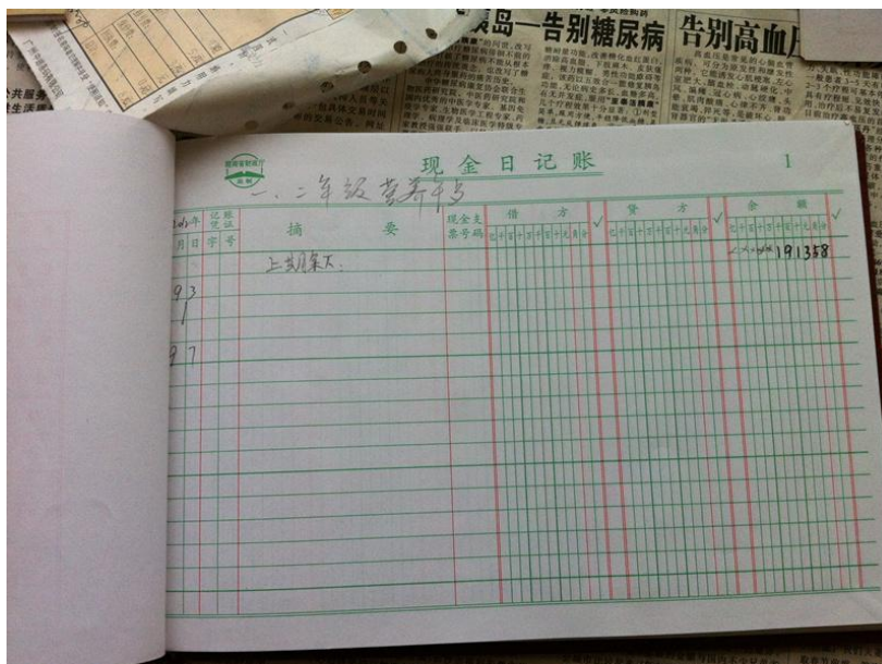
图 13 营养午餐