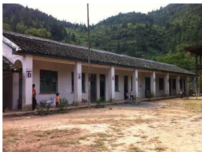
图 2 半江小学外景

半江小学位于湖南省怀化市新晃县中寨镇,该校设有学前班、一年级、二年级,共有学生 48 人,实行走读制。