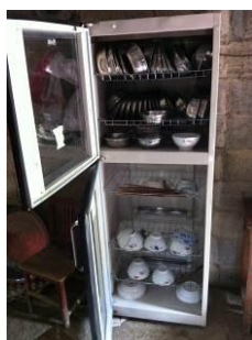
图 6 消毒柜使用规范