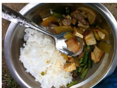
图 10 炼过油的肥肉

当天的菜谱为烩冬瓜、长豆角炒肉、煮鸡蛋、紫菜蛋花汤。调查人员发现,当天菜里的肉基本上都是炼过油的肥肉,口感不好,且菜量一般,一些学生也反映说菜量有时会少。