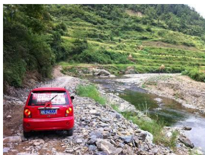
图 1 趟过小溪便来到了半江小学

中寨镇半江小学距离县城约 64 公里，路途较为顺畅，全部为水泥路面，车辆可以到达学校脚下，徒步穿过小溪便可来到学校。