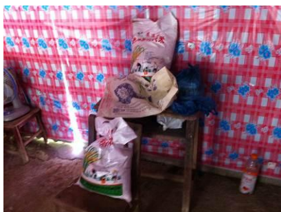
图 12 大米

据老师介绍,菜品的采购大家都会去买,米和鸡蛋从学校对面的代购点买,肉从一名卖肉的学生家中购买,其他的菜都在村中采购,价格适中。