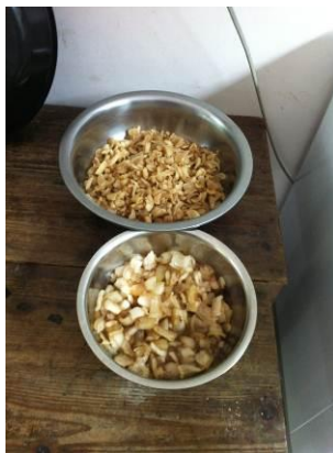
图 7 炼过油的肉

调查人员通过与同学们的交流发现,大家对饭菜的质量基本满意,但是有时会米多菜少,而且开学的第一天没有吃到肉,其他的时间天天都有肉吃。同时,调查人员在储藏室发现了两盆炼过油的肉,给学生食用这种肉是否合适,请相关人员核实。