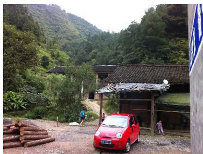
图 1 远处为赛容小学

调查人员结束了半江小学的稽核后,立刻赶赴赛容小学,该学校距离中寨镇 6 公里,全程水泥路面,路程较为顺畅。