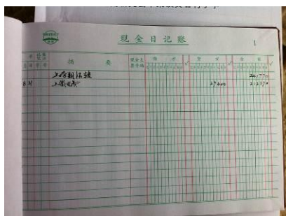
图 9 总账