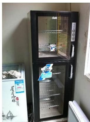
图 6 消毒柜未使用