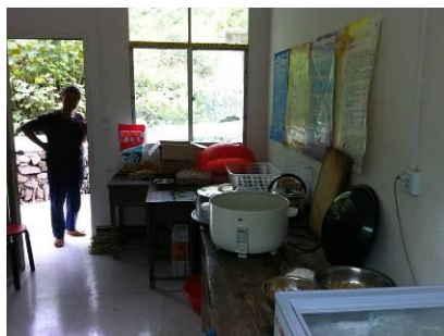
图 5 案台卫生保持良好