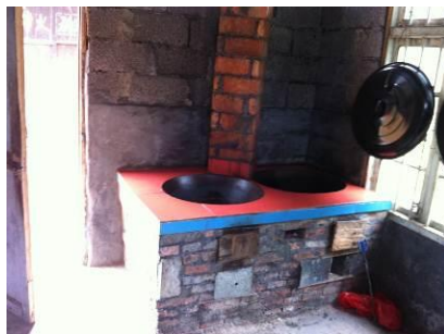
图 4 灶台干净整洁

该校厨房位于学校 20 米远的赛容村委会旁边,干净整洁。冰柜、消毒柜等存放在该村图书室,位于厨房隔壁,卫生保持不错。赛容小学的消毒柜同样未启用,据杨老师解释每隔两三天就会将学生碗筷高温消毒,调查人员对此持保留态度。另据杨老师介绍,该厨房有时也会负责村委会的接待任务。