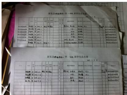
图 2 赛容小学花名册

赛容小学位于湖南省怀化市新晃县中寨镇，该校设有学前班、一年级、二年级，共有学生 19 人，实行走读制。