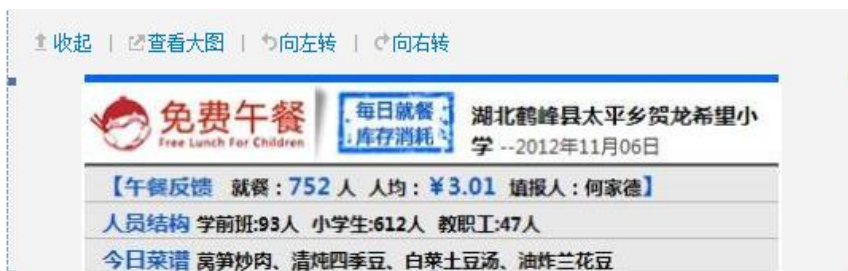
图5 就餐人数的微博截图

调查人员清点当日就餐人数: 学生612名、老师40名、厨师5名、保育员2名合计752名。与微博相符。