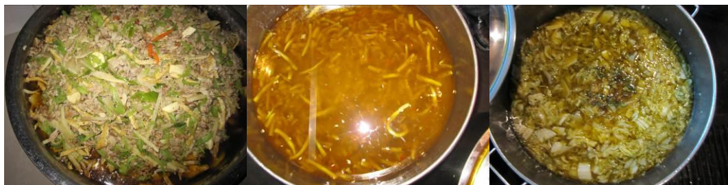
图 21 当日菜品