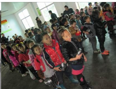
图 11 排队打饭