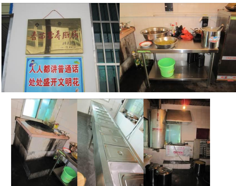
图 9 厨房内景