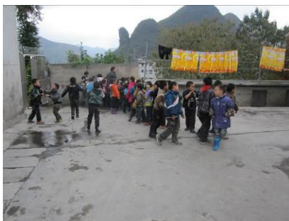
图 10 排队洗手的学生