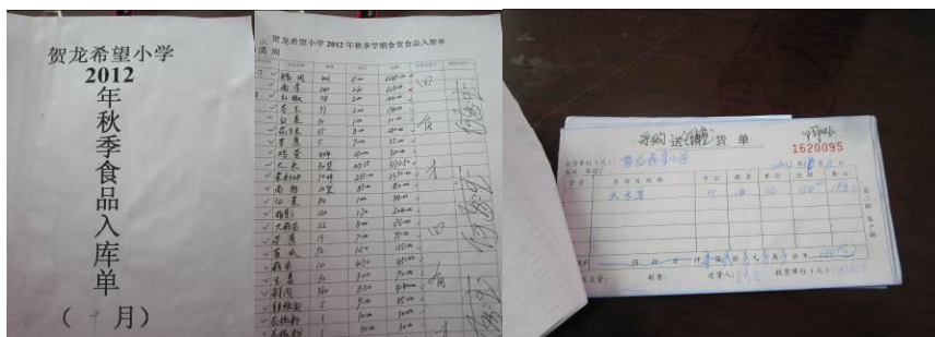
图 23 账目