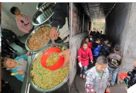
图 13 打饭的、洗手的错开时段