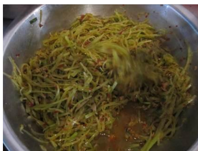
图 19 老师肉少的青笋