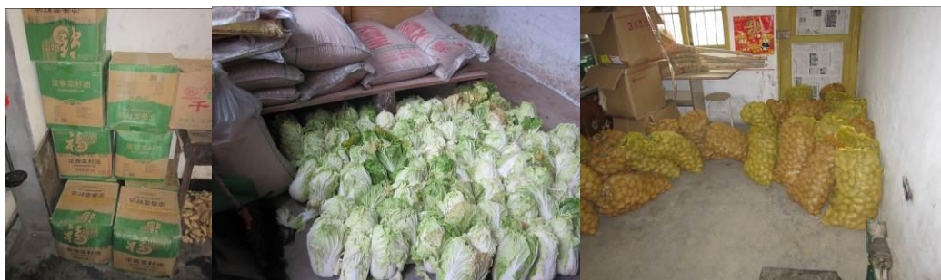
图 22 库存

采购由值周老师和 2 名采购负责, 干货一周买一次; 米面油招标定点送, 半月一次; 肉、蛋招标定点一周一次, 鲜菜每天或二天买一次, 土豆半月买一次。