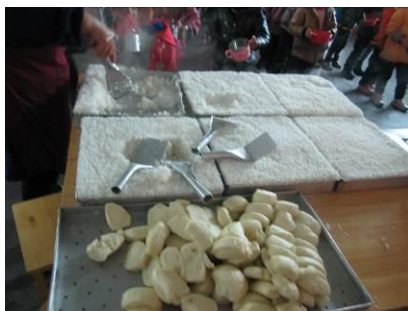
图 12 主食