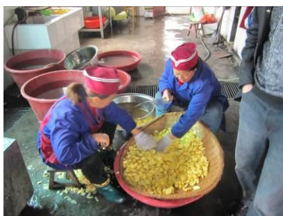
图 7 穿工服在工作的厨师正