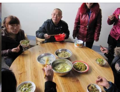
图 20 老师在用餐