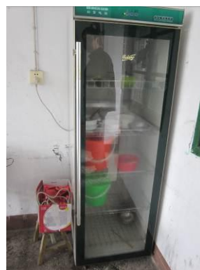
图 5 冻结的留样菜品 图 6 没给学生用的消毒柜