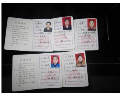
图 5 健康证