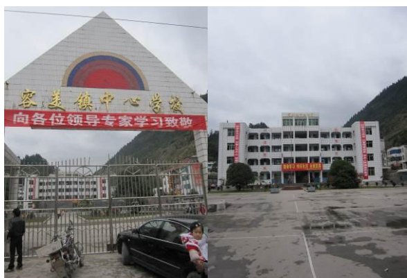
图 1-2 容美镇中心学校