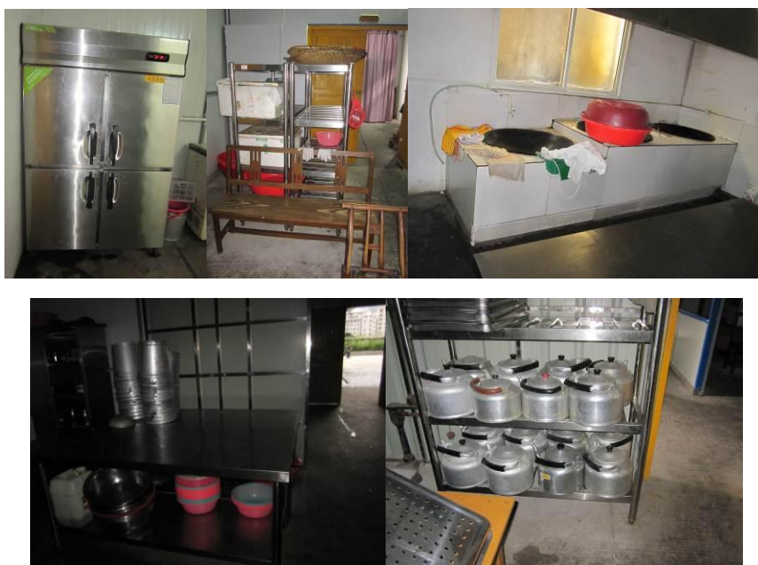
图 6-10 厨房内景