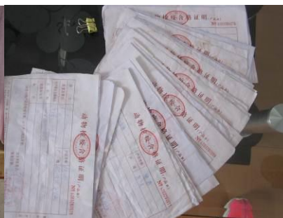
图 16 检疫票据