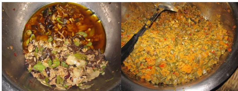
图 13-14 当天没吃完的菜

调查员在操场随机找了几学生了解当天菜谱是:青椒木耳炒肉、南瓜土豆片、辣椒,与当天微博公示一样。