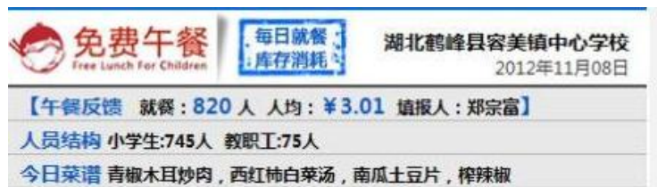
图 4 就餐人数的微博截图

调查人员清点人数时,由于是下午到的,没看到中午就餐情况,但清点当天人数是学生 439 名。教师人数是问的该校校长,为 70 名,厨师是 5 名合计 514 名。需在此说明的是,当日调查人员并未看到一、二年级学生,校长说周四下午这两个年级没课,吃完午餐就放学了。