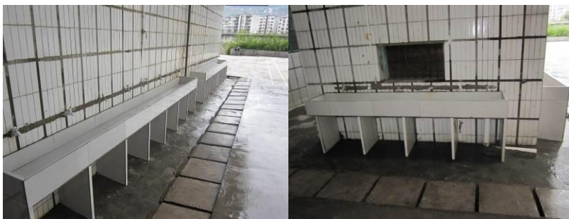
图 11-12 设施完好的洗手池