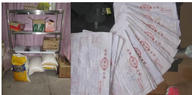
图 15 库存不多