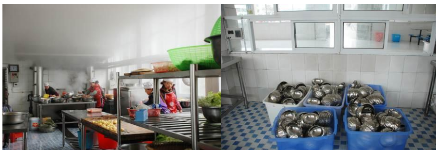
图 15 工作台