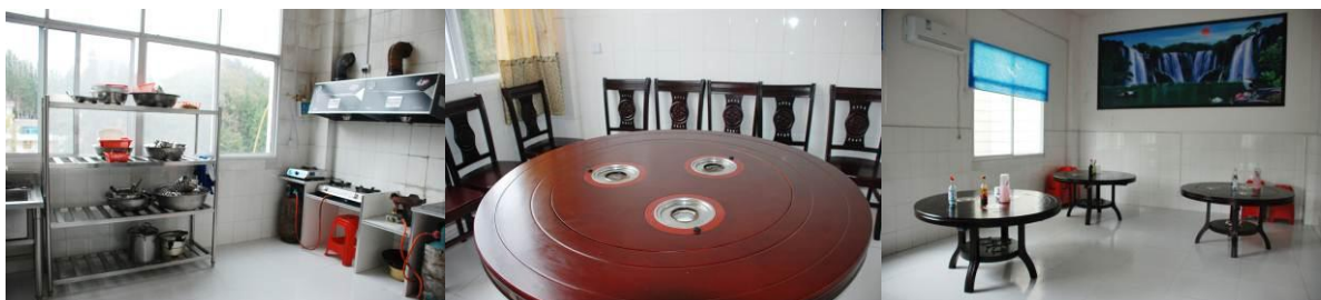
图 19 老师的厨房

老师有自己的厨房和餐厅。老师的餐厅相对其他学校来说算得高档。老师一般会与学生同吃，有时会单独另外加菜。