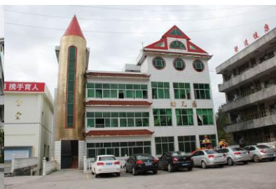
图 6 幼儿园(学前班)