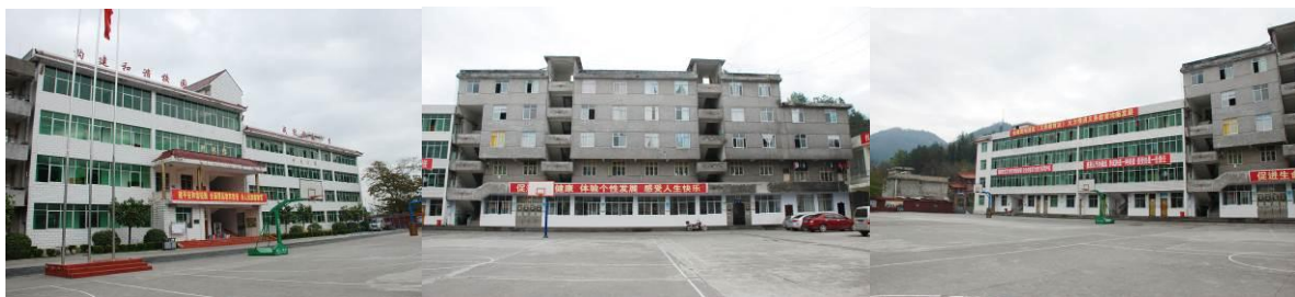
图 7 学校科技楼及办公楼 图 8 一楼为学生餐厅、楼上为教职工宿舍 图 9 学生宿舍