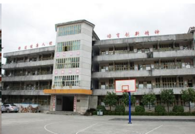
图 5 学校教学楼