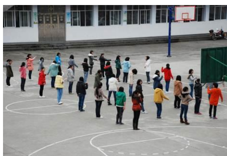
图 36 初中部分学生在做课间操

3、通过对八峰民族学校的调查, 可以看到: 虽然鹤峰是湖北恩施的贫困县, 但八峰民族学校所在地离县城只有几公里, 又在高新技术开发区, 且又是八峰药化这样的大企业的所在地, 所以学校地处相对富裕的地域; 从学校硬件设施来看 (从上面的图片中就能看到), 较其他贫困学校相对要好得多。从学校操场停放的十几辆车能看出该校教职工的经济条件也还不错; 该校的生源主要来自县城、容美镇和八峰村, 也有一部分是八峰药化厂的子弟, 周边地区成绩较好的学生也会慕名前来就读。如图 26 在课间活动的初中学生及图 27 的部分小学生的衣着打扮及书包文具等能看出该校绝大部分学生家境应该都还不错。