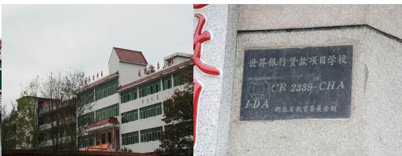
图 2-3 学校外景