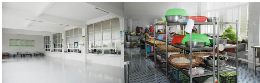
图 10 学校食堂内部