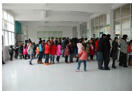
图 13 学生和老师们都排队打饭