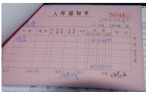
图 22 2012.10.31 的肉食入库单