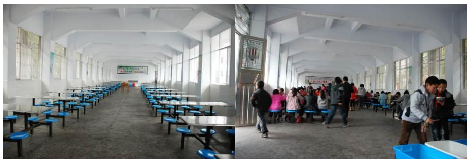
图 17 学生餐厅