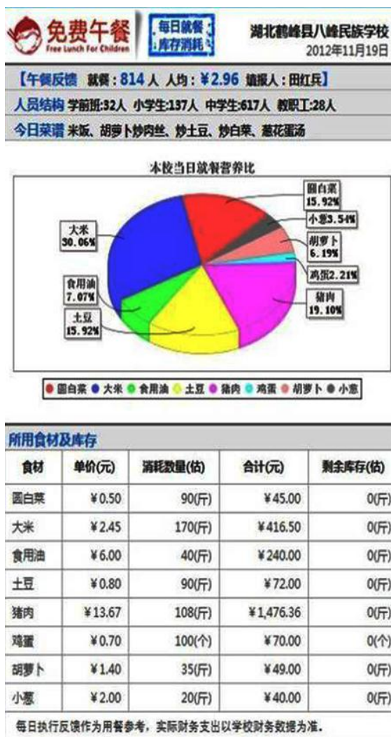
图 12 学校 11 月 19 日微薄截图