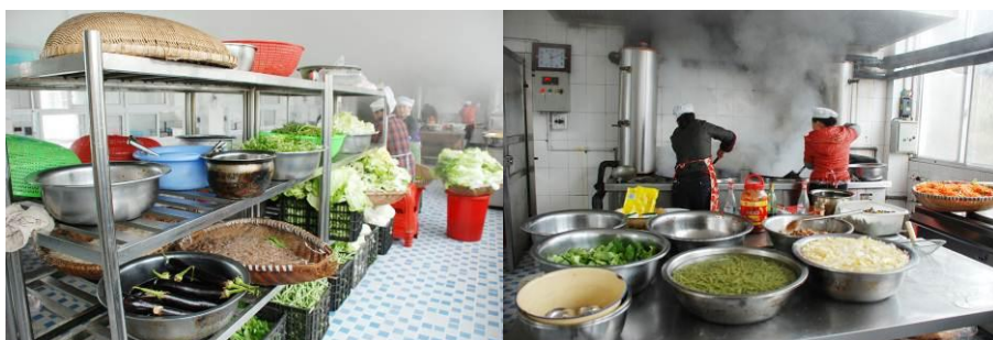
图 14 厨师在工作

厨师 5 人, 都有戴工作帽, 系围兜、戴袖套。据调查者当日目测, 厨师自身穿着比较干净整洁。工作台也比较干净。