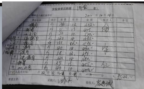
图 23 肉食采购的原始凭证