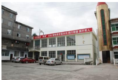
图 4 学校食堂外景