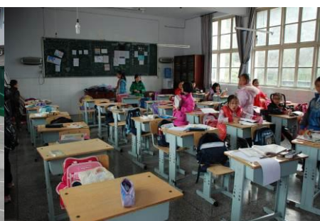
图 47 部分小学生