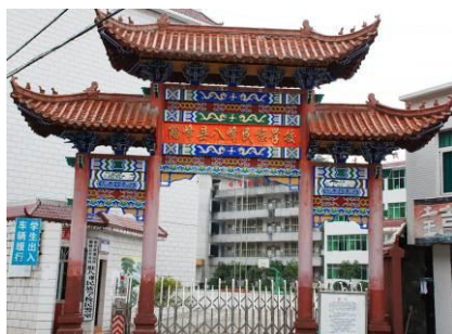
图 1 校门

鹤峰县位于恩施州东南部,与湖南省毗邻,面积 2892 平方公里,人口 22.02 万,辖六乡两镇和一个开发区。地处东经 109°45'—110°38', 北纬 29°38'—30°14'。东毗湖北省五峰县和湖南省石门县,南邻湖南省桑植县,西依湖北省来凤县、宣恩县,西北与恩施县相连,北同建始县、巴东县接壤。境内东西长约 85 公里,南北宽约 67 公里,其中耕地仅占 7.6%,水域占 1.5%,山地占 88.9%,公路、屋场、田坎等地占 2%。自然环境使鹤峰成为湖北的贫困县之一。八峰民族学校位于湖北省鹤峰县容美镇八峰村(距县城八公里),八峰是个高新技术开发区,八峰药化是目前国内最大的氨基酸国有化、产业化高科指示范基地。图 1-10 是学校的一些外景图,可以看出学校确实建得不错。听当地村民说学校是八峰药化的企业家牵头兴建的,从学校教学楼门口的牌匾(图 3)可看出该教学楼是世界银行贷款兴建的。