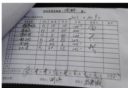
图 14 调料采购的原始凭证