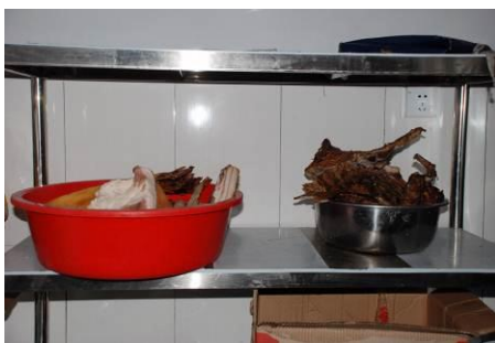
图 7 学校采购的的腊肉和肥肉