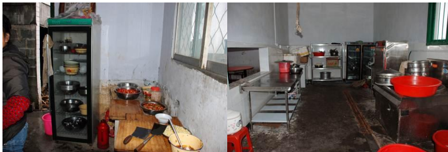
图 3 工作台