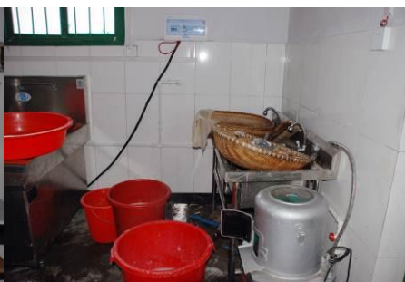
图 8 操作间有点杂乱