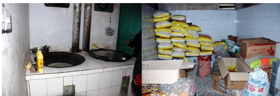
图 5 灶台