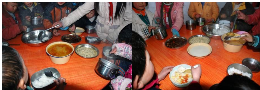
图 13 学生当天的午餐菜品