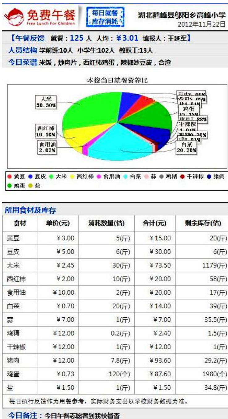
图 2 就餐人数及食材微博截图