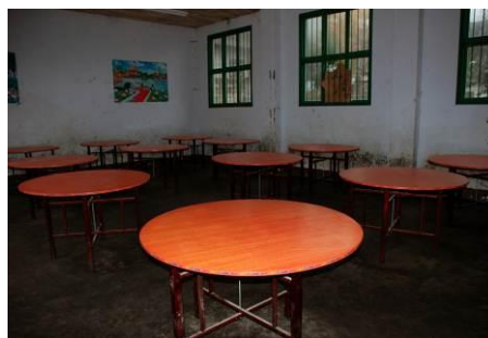
图 9 学生餐厅