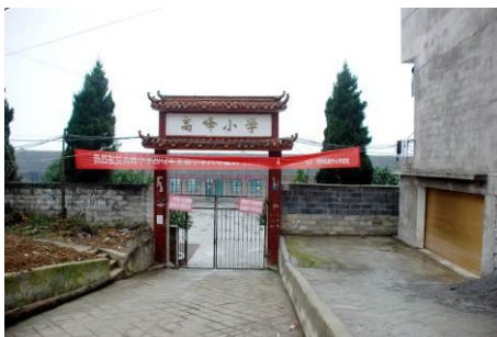
图 1 学校外景

高峰小学地处鹤峰的西北边，高峰，顾名思义该校位于高山之上。全校有 101 名小学部学生，10 名学前班学生。学生主要来自鄖阳乡高峰村，也有来自鄖阳乡云雾村、金鸡村和其他附近村的学生。小学生全部寄宿在学校。