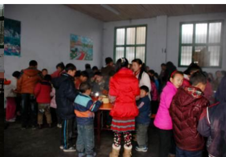
图 10 学生在用餐