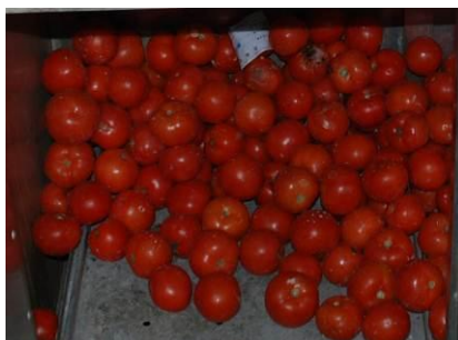
图 11 储物柜中腐烂的西红柿

老师和学生共用一个食堂，且老师与学生同吃。据老师反映，学校还一直用土灶在做饭菜，因为浙江宇峰厨具有限公司捐赠的厨具要用三相电，而学校只有普通的民用电源，所以虽然机器都已安装好，但因没电而一直闲置着。