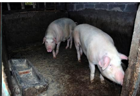
图 12 学校养的猪