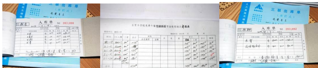
图 18 学校的帐目