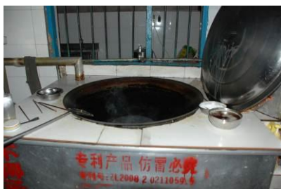
图 11 灶台