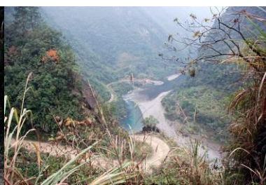
图 3 盘山而上

11 月 23 日一大早，早几天在车上认识的五里乡新华保险的刘师傅（早就约好的，他自愿送我去潼泉小学）如期而至。头一两个小时的路还算好走，都是盘山公路，只是坐摩托车很冷，之后的路就无法形容了。因山上有矿，拉矿石的车把一条土路撵得不成样，早两天下过雨，坑深的地方养鱼是绝不成问题的。最后连摩托都无法骑了，只好步行。走了几里后终于搭上一辆拉矿的车走过了这段最难走的路，在分路口等到刘师傅后一路狂飙，远远看见学校里学生已经在排队打饭了，一看时间：已经十二点多了。