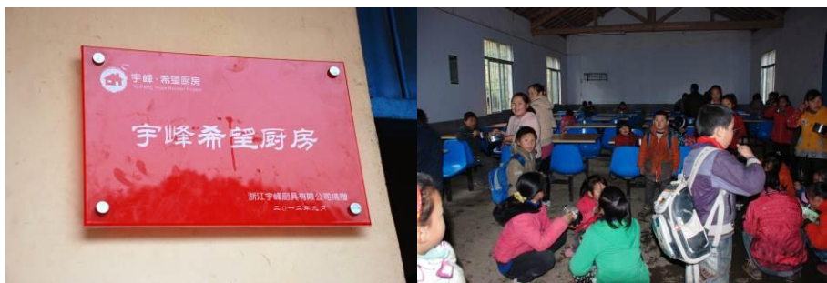
图 14 厨具是由浙江宇峰厨具有限公司捐赠 图 15 学生在食堂用餐