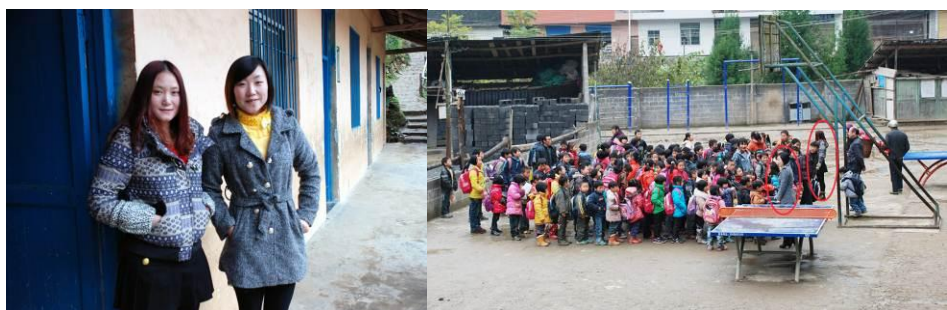
图 16 最美乡村教师

老师和学生共用一个食堂，且老师与学生同吃。在此特别感谢浙江宇峰厨具有限公司为学校捐赠厨具。