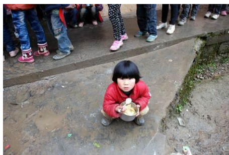
图 8 用餐的学生