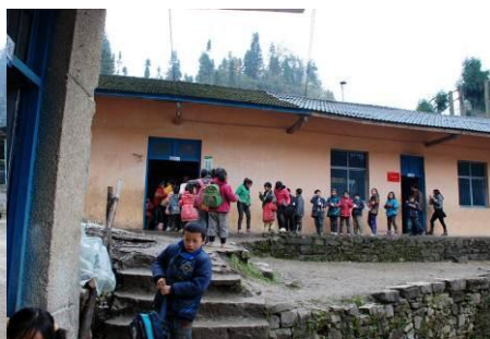
图 5 学生食堂

据老师介绍,该校因交通极为不便,福利一般有些难惠及到他们或会姗姗迟来。学生用的课桌椅都是别的学校退下来不用的,老师拉回校维修、加固后给学生再使用。