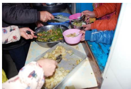
图 17 学生当天的午餐菜品