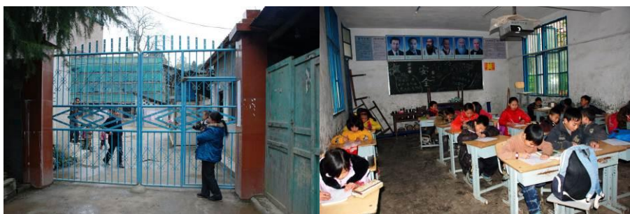
图 6 学校外观

据老师介绍,该校因交通极为不便,福利一般有些难惠及到他们或会姗姗迟来。学生用的课桌椅都是别的学校退下来不用的,老师拉回校维修、加固后给学生再使用。