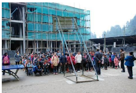
图 4 在建中的新教学楼