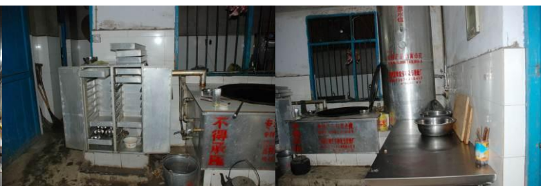
图 12 工作台