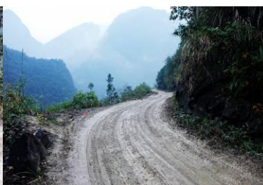
图 2 泥泞不堪