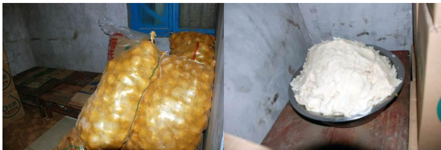
图 13 储物间