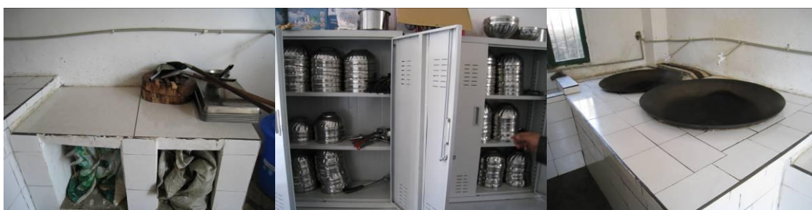
图 4 厨房图片组图