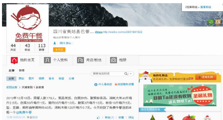
图 2 就餐人数的微博截图

调查人员算了一下当日就餐人数: 学生 163 人+厨工 2 人+老师 14 人=179 人, 与微博公示相符。