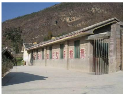
图 1 学校外景