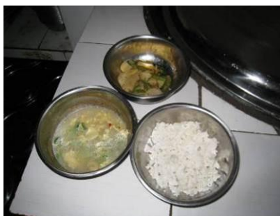
图 5 18 日菜品留样