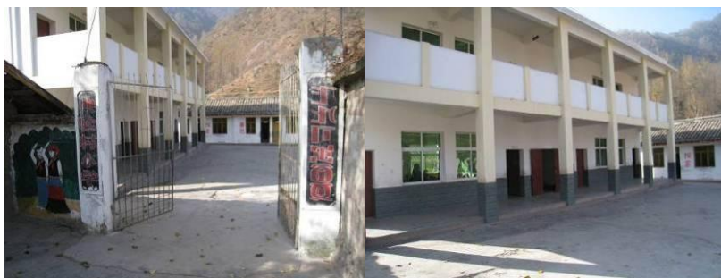
图 1 学校外景