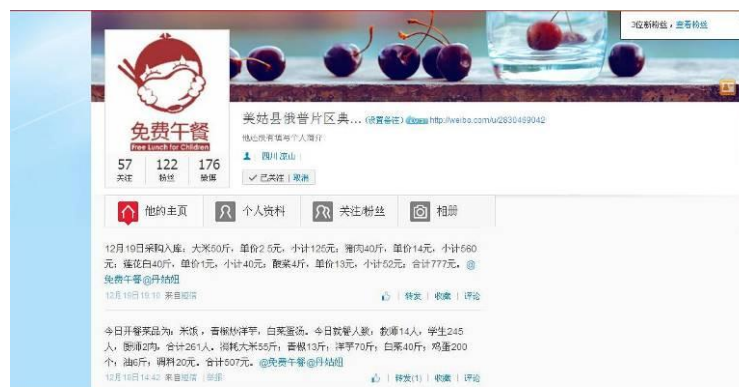
图 3 就餐人数的微博截图

调查人员算了一下当日就餐人数: 学生 245 人+厨工 2 人+老师 14 人 (2 位老师请假) =261 人, 与微博公示相符。