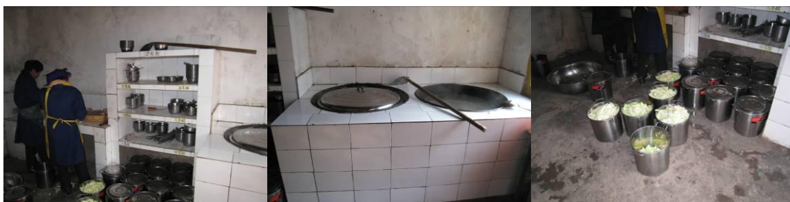
图 4 厨房图片组图