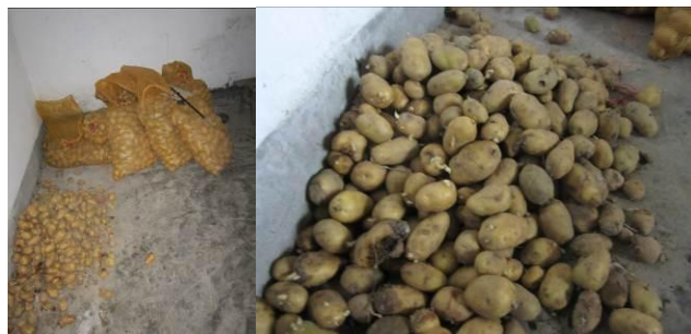
图 7 库存的发芽土豆