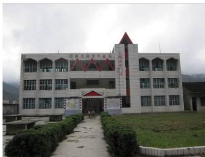
图 1 学校外景