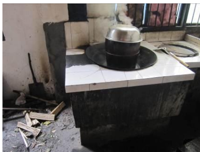
图 3 厨房地面、墙面