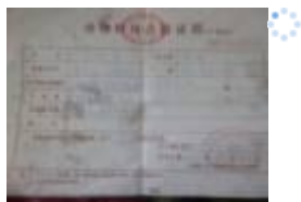
图 8 微博 11 月 12 日发布的猪肉检疫证明截图

(3) 当天未瞧见肉的检疫票据, 让校长下周采购时一定索要并微博公示。后在微博上瞧见公示的检疫证明。