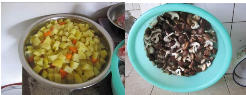
图 5 准备做饭的食材