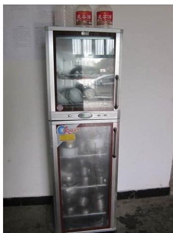
图 4 消毒柜在使用中

由于调查人到达学校后，学生们还在上课，厨师刚开始准备做米饭，还未炒菜，所以没和学生们一起吃午餐。可以看到该校消毒柜在使用中。