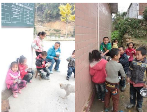
图 6 孩子们在操场旁用餐 图 7 吃完饭的孩子在洗碗