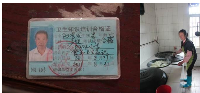
图 3 厨工丈夫的卫生知识培训合格证 图 4 厨工穿有围裙和工作服

调查人员没有看到厨工的健康证, 学校只出示了一位厨工丈夫的卫生知识培训合格证, 之前是由他来做饭。调查当天目测厨工衣着比较干净, 基本符合要求。