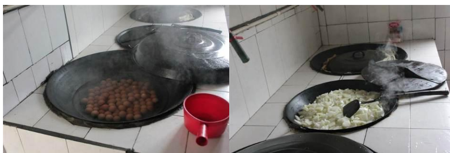
图 11 30 日的煮鸡蛋和炒冬瓜