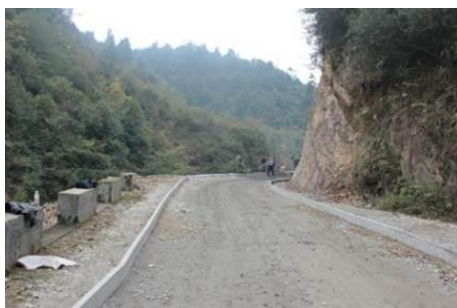
图 1 正在铺的水泥路

调查人员 11 月 19 日从哈尔滨出发, 11 月 21 日到达南宁, 11 月 25 日到达桂林, 前往汽车客运总站, 得知前往龙胜的大巴在琴潭汽车站乘坐, 遂乘公交 (2 元) 前往, 从桂林琴潭汽车站乘坐长途大巴 (28 元, 约 2 小时) 前往龙胜县, 晚上住在龙胜。11 月 29 日上午从龙胜汽车站乘坐公交小巴 (9.5 元, 约 2 小时) 前往芙蓉村 (终点, 未修路时小巴可到达东升)。芙蓉到里市、东升修路不通车。调查人员沿路走一段后搭一辆私家车到达里市, 走路约半小时到达东升小学。30 日下午在里市搭乘摩托车到芙蓉坐小巴回到龙胜, 结束对里市小学、东升小学的调查。