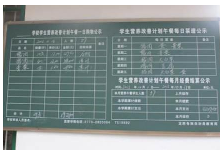
图 12 厨房外营养午餐的公示

学校大多就近采购，没有实行轮流采购。为方便记录学校将采购原料按免费午餐和营养午餐分开记录，厨房外有一块用作营养午餐公示的黑板，但已多日没有更新，黑板上也没有免费午餐那部分的采购信息。