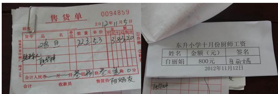
图 14 商店开的售货单及厨工工资收据