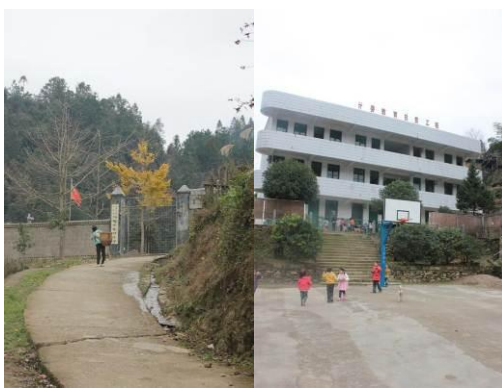
图 2 学校校门和校园

东升小学位于桂林市龙胜县，处于广西和湖南交界地区的山区，和里市小学相距不远，属于广西最偏远的地区。学生来自附近七个自然屯，父母大多外出打工。学校共有学生 106 人，其中家住得比较远的 21 人住校。学校有免费午餐和营养午餐，免费午餐负责学校学前班和老师的伙食及一名厨工的工资。