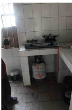
图 8 厨房摆放的燃气灶

调查人员注意到厨房里有燃气灶和小电饭煲，微博里也有液化气的采购记录。学校解释说有老师和学生住在学校，液化气有时会用来做早餐和热饭，中午老师和学生是一起吃饭的。