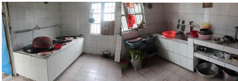
图 5 灶台和水池