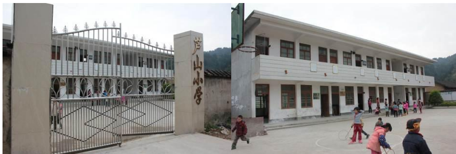
图 1 学校外景

走几公里路用了四十分钟。学校现有老师 4 人, 学生 43 人, 其中学前班 12 人, 小学一至四年级 31 人, 全部为走读生。学校有教学楼和厨房, 校园内的厕所正在施工上厕所需要到大门外面。学校刚于 12 月 3 日正式开餐。