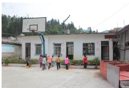
图 3 厨房, 右边为在建的厕所