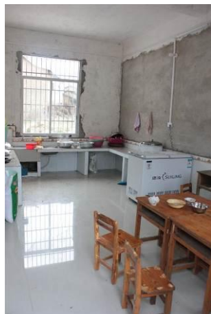
图 7 厨房地面比较干净