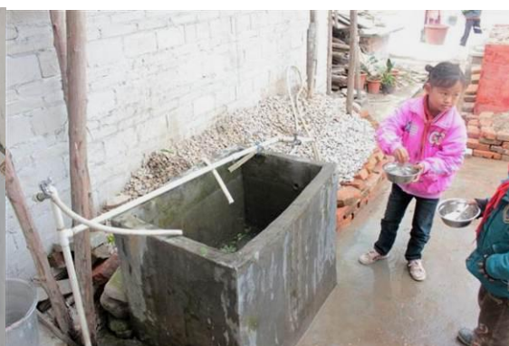
图 8 一部分学生在食堂吃饭 图 9 学生的碗在消毒 图 10 学生在厕所旁的水池处洗碗