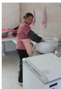
图 5 厨工穿有围裙