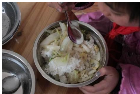
图 11 学生当天的午餐

当天菜品为大白菜、猪肉,学生每人有一个鸡蛋。调查人员注意到学生碗里的肉比较少,老师解释说芦山小学交通不便物价比较贵。调查人员中午随学生吃饭,感觉米饭较硬,菜口味一般。另外调查人员翻看学校微博发现多日菜谱均为大白菜和猪肉,比较单一。