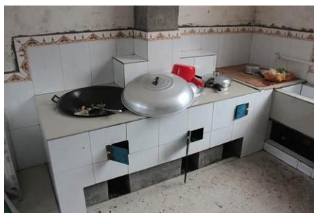
图 6 灶台