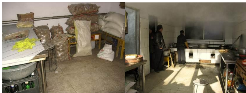
图 3 库存房和厨房

该校实行住宿制, 学校向部分学生提供早午晚三餐, 而且有部分老师中午会在校吃饭, 所以该校有现成的库存房, 厨房及相应的炊具 (两个灶台, 三个不锈钢工作台等)。