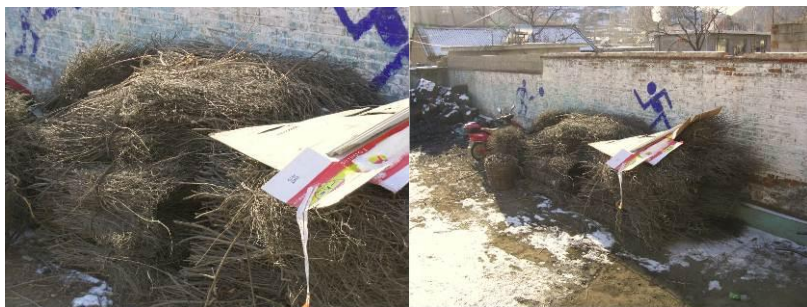
图 7 柴