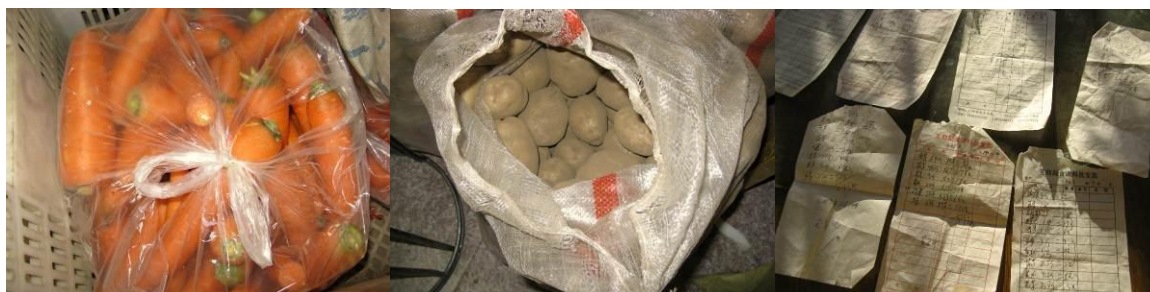
图 6 库存及采购单

据老师介绍，该地区 5 天一次集会，食堂采购一周一次，耐储存的大米等定点采购，供应商送货。调查人员查看了库存，菜品新鲜，质量较好。负责膳食管理的老师还把采购单摆了一桌给调查人员查阅。