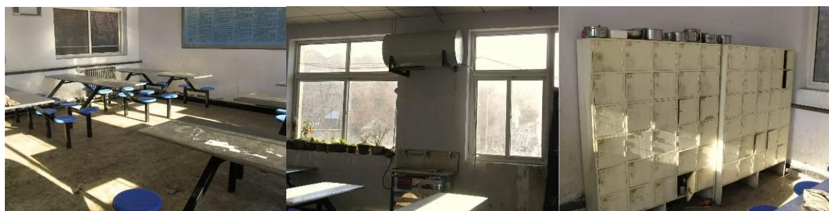
图 4 学生餐厅

该校有两个餐厅, 小餐厅是老师餐厅, 摆一张带转盘的大圆桌, 大餐厅是学生餐厅, 学生餐厅装还有热饮设备。据老师介绍, 如果免费午餐进入, 全校开餐小餐厅是无法满足需求的, 将自筹资金建一个全校用餐的大餐厅。