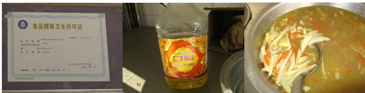
图 5 午餐

调查人员环视厨房，墙上挂着卫生许可证，食品用油也没有沉淀物，中午剩下的土豆胡萝卜肉丝汤。据老师介绍，经常采购的菜品有土豆，白菜，胡萝卜，菜花等价钱比较便宜的蔬菜，午餐执行收费制，餐值每生 3 元，全包价，含柴火等。调查人员认真看了一下，很费劲才从汤中捞出肉丝。