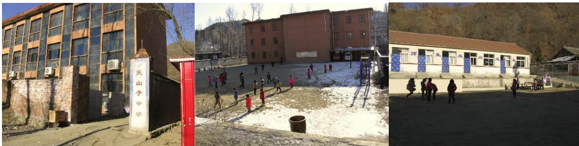
图 2 学校组图

该校不在营养午餐的资助范围内，地处山区，种植以玉米为主的多粮杂粮，青壮年仍以外出务工为主要谋生手段。