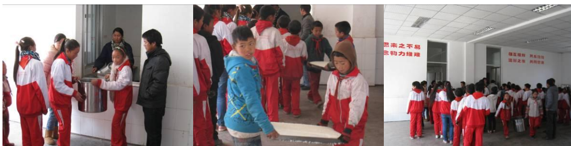
图5 值日学生领餐组图

调查人员观察到的情况,结合该校校长介绍。中午下课后,全校学生到操场集中做广播体操,做完之后,餐厅值日的学生到食堂抬餐桶、取餐具,其他学生到教室等候,值日老师在教室给学生分配用餐,用餐完毕后,值日学生将餐桶和餐具送至厨房后清洗。从下课铃响,搬餐桶、餐具,到就餐及清洗餐具,再到教室卫生打扫,每个学生各司其职、井井有条。