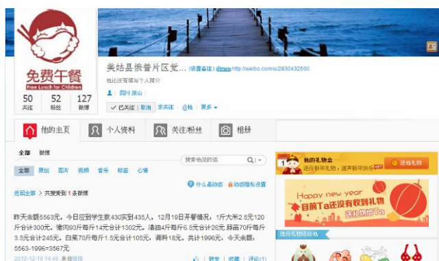
图 3 就餐人数的微博截图

调查人员算了一下当日就餐人数: 学生 430 人+厨工 4 人+老师 21 人+保安 1 人=456 人。据该校地日阿甲校长介绍, 该校学前班现有人数比当时申请人数多出 9 人。因调查人员当时临时决定到该校, 未提前核对该校人数变动情况。与微博公示相符。