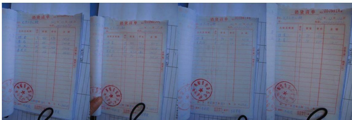
图 8 采购凭证组图