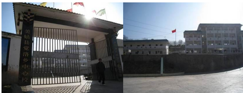
图 1 学校外景