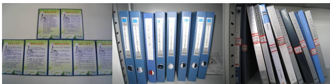
图 9 该校免午的相关制度和文件

觉洛乡中心校对于免费午餐的执行指定了详细的操作手册，并完善了《计划采购单》、《资金开支记录表》、《报账结算单》、《入库单》和《出库单》等五项食材采购表格，还有《陪餐记录表》、《菜谱记录表》和《留样记录表》等三个执行记录表格。调查人员认真查看了以上表格，均有各环节责任人的亲笔签字，工作做的很细致。