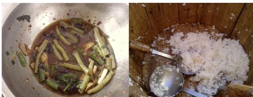
图 7 餐后所剩

调查人员到校较晚,师生是否同餐,及饭菜公平度等并不能亲见,在厨房看到饭菜剩余不多。