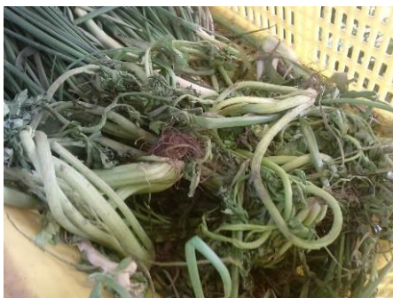
图 12 久放不能食用的苋菜

(3) 建议合理把握用餐需要, 按需采购, 避免食材存放过久不能食用造成浪费, 变质食材及时清理。