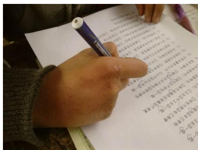
图 10 孩子们在做问卷

(2) 调查当日为 2013 年 1 月 7 日,公示牌的日期为 2013 年 12 月 29 日建议加强公示制度的执行;