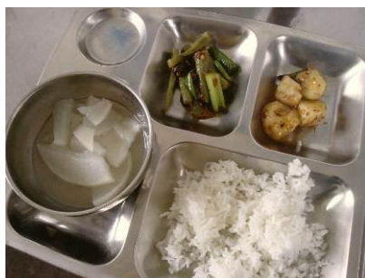
图 8 留样