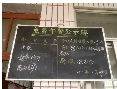
图 11 厨房门口的公示牌

(2) 调查当日为 2013 年 1 月 7 日,公示牌的日期为 2013 年 12 月 29 日建议加强公示制度的执行;