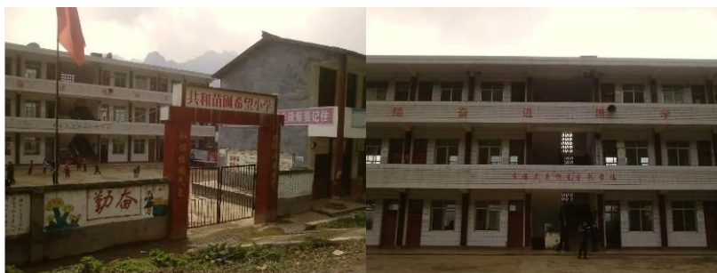
图 2 校园组图

共和苗圃希望小学位于四川南部山区,具体位置为四川省宜宾市兴文县毓秀苗族乡和新村。从宜宾到兴文路不好走,冬季容易大雪封路,几天不能通车,经石碑到校较为合适。学校执行春冬季作息和夏秋季作息两种,春冬季作息早上 9:00 早自习,中午 12:50 吃饭,下午 13:40 上课,下午 15:30 放学;秋夏季作息早上 8:30 早自习,中午 12:20 吃饭,下午 13:20 上课,下午 15:00 放学。据了解,该校 1 月 22 日-24 日考试,考试结束后放寒假。