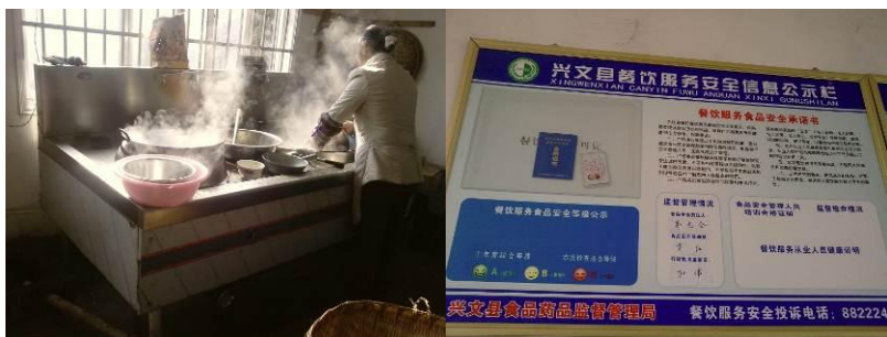
图 4 厨师及健康证

该校厨师 1 人, 长发扎起, 干净整齐, 调查人员到校时, 孩子们已吃过午餐, 厨工正在洗刷餐具, 厨工没有穿工作服, 但系有围裙, 墙上挂着健康证。