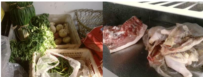
图 9 库存

据校长介绍,该校在镇上实行定点采购,采购周期为春冬 4-5 天,秋夏 2-3 天,量少摩托车托运,运费 15 元,量多用皮卡托运,运费 50 元。