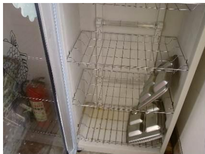
图 6 消毒