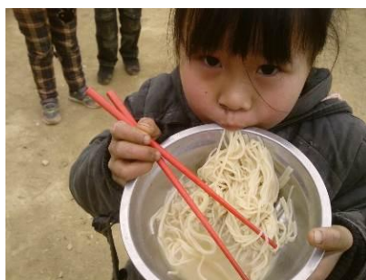
图 7 孩子的免费午餐

该校调查前一天 2013 年 1 月 14 日, 免费午餐吃的是清水挂面, 但微博中显示米、肉、莲藕、酸菜。自从调查人员提出质疑后, 调查当日 2013 年 1 月 15 日, 微博上只公示了人数和金额, 具体吃什么并没有作公示。