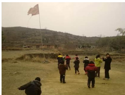
图 2 学校操场图

下容小学位于湖北省黄石市阳新县排市乡下容村,该校没有学前班,只有小学部 1-3 年级,3 个年级同处一个课室。据老师介绍,有在校生 16 人(调查人员现场清点为 12 人),由 2 名代课老师负责教务等工作。该校校舍为一排砖瓦平房,学校没有围墙,校舍门口的空地就是操场,条件艰苦。