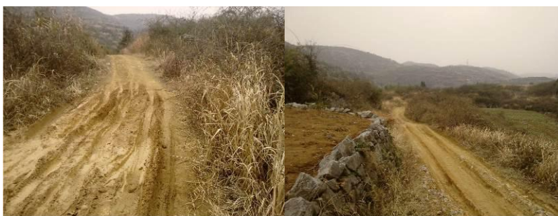
图 1 进校的泥路

前往下容小学可以在阳新南站搭乘往排市的班车, 车程 2 个小时 (单程 9 元); 到排市后只能搭摩托车到路口, 大约半小时 (单程 30 元); 路口进去是一段荒山野岭的泥路, 摩托车不能行走, 只能步行, 如果运气能碰到进村的一种小三轮车则可搭个免费便车。学校所在地当地人称之为“后山”。