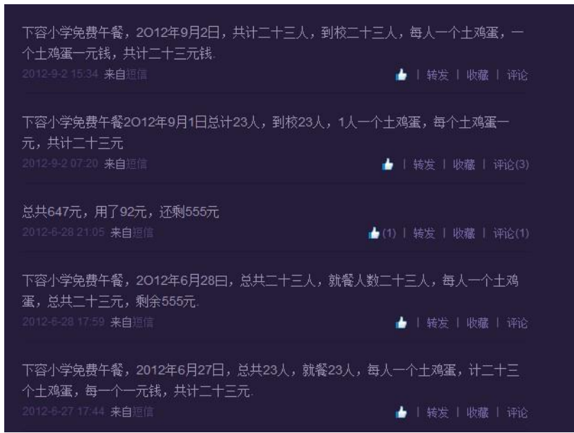
图 5 跨学年用餐人数并没有根据实情做出调整

到调查日(2013年1月15日)一直显示或登记的数据全是2012年5月11日申请的数据:学生21人,老师2人,合计23人。2012年5月至2013年1月,跨越了一个学年,因升学和新生入学,产生人数差异该校并没有做出相应调整。