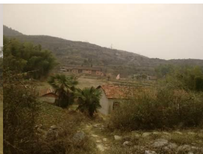
图 3 隐于草丛中的校舍