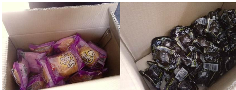
图4 省级营养改善计划