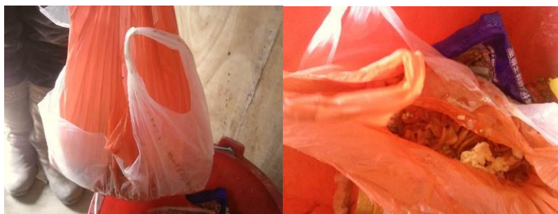
图 7 女生放在垃圾桶要带回家喂猪的剩饭剩菜

调查当日, 调查人员家访结束回校, 直接走进位于一楼的四年级, 准备进行匿名调查表的工作, 见到一个女生将剩饭剩菜倒进一个塑料袋, 而且份量不少, 调查人员向女生询问情况, 几经劝导, 女生说出实情: 奶奶让其将剩饭剩菜带回家喂猪。