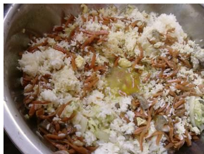
图 6 一整盆待丢弃的饭菜

调查当日, 调查人员随教工在厨房里的餐厅用餐, 用餐完毕正走出厨房, 迎面走来一男生, 手里端着一整盘的饭菜混合准备丢弃。调查人员及时抓拍, 见状, 随行的校长大声训斥学生。