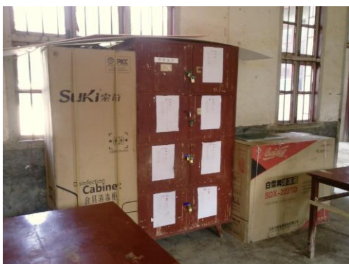
图 8 存放于学生餐厅尚未拆包装的消毒柜和冰箱