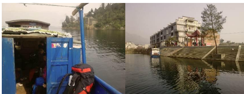
图 1 渡轮及东源新码头

友情提醒: 王英是一个旅游区, 吃住比阳新贵, 而东源又是一个吃住都不方便的小地方, 所以, 一早从阳新出发, 调查当日返回阳新较合适。阳新有直达东源的班车。