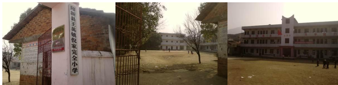
图 3 校园组图