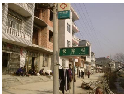
图 2 倪家村

关于该校所得的资助项目，调查人员了解到，除了免费午餐同时还实行着另一项由湖北省政府出台的省级营养改善计划，具体情况：由政府每生每天出资 1 元，阳新作试点，全县统一采购、发放的方式，为学校提供面包或鸡蛋。