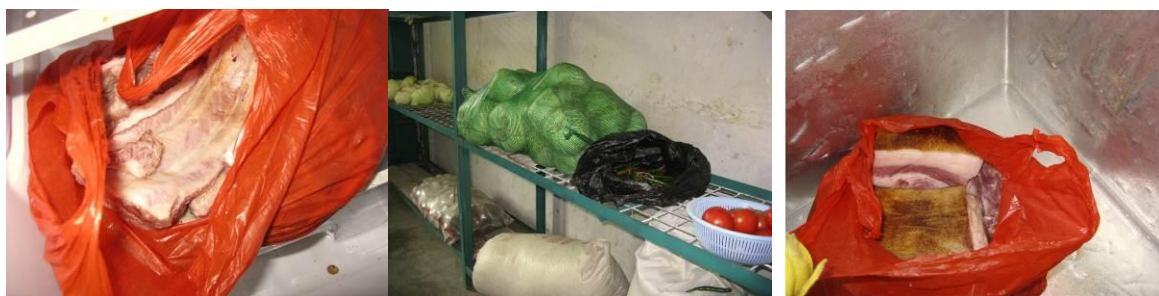
图 10 教工餐厅菜架所存食材及冰柜的存肉（大肉和肉排）