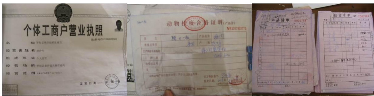
图 6 供应商资质及送货单