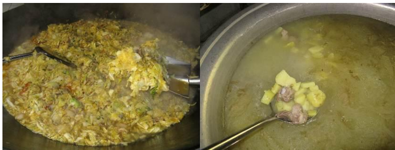
图 7 调查日用餐实际菜谱：肉炒莲花白、排骨土豆汤

1月6日出库公示：今日用餐总人数55人。今日菜品：肉炒豆腐，炒莲花白，豆芽汤。消耗大米16斤，菜油1斤，猪肉5斤，豆腐6块，莲花白10斤，豆芽5斤，调料一份，西红柿1斤。免费午餐 @邵东刘军