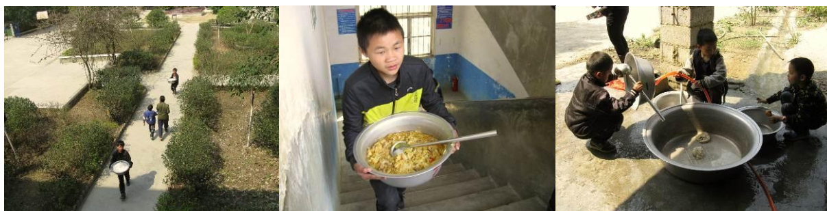
图 12 饭菜由学生代表从厨房领到课室、四年级为学前班洗餐具