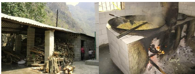
图 5 厨房