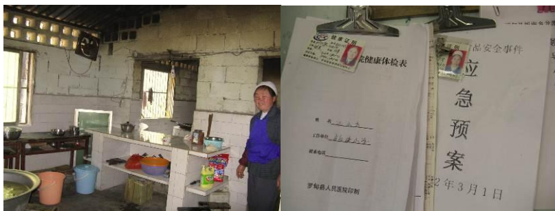
图 4 厨师及健康证

该校厨房设在教学楼后的平房内, 有两眼烧柴的大灶, 菜用大锅煮, 米饭用木桶蒸, 调查人员现场所见, 灶台整洁、工作台干净明亮。