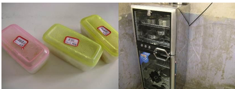
图 11 食品留样、餐具消毒

学校的午餐由专门的老师负责管理，严格执行 48 小时的留样制度。该校孩子所用餐具是不锈钢饭盒，由于餐具消毒占地方，每个课室均配有消毒柜（消毒柜由教育经费出资购买）。