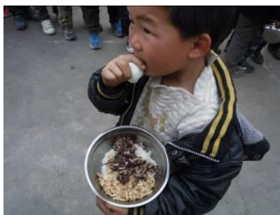
图十七 刚打完饭走出厨房的学生