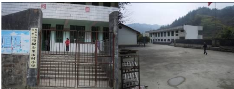
图二 学校外景及校园环境

里市小学位于广西壮族自治区桂林市龙胜县马堤乡里市村,属于广西最偏远的地区之一,毗邻湖南省城步县。当地居民平均生活水平偏低,除木材销售及外出务工外几乎没有其他经济收入来源。全校现有在校学生 99 人(其中寄宿制学生 28 人),教职工 9 人(其中教师 7 人,厨师 2 人),全校纳入免费午餐计划 108 人,其中免费午餐基金全额拨款 51 人。