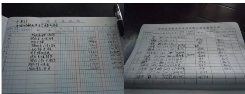
图十三 现金进出帐