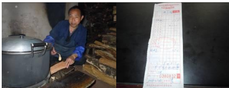
图四 厨师及健康体检收费单