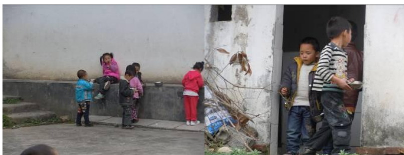
图八 在操场边用餐的孩子们

该校没有固定的就餐场所,学生们打饭后大多数在操场就餐,调查人员当天还发现现场有三只大狗在操场转悠,捡食学生剩饭。调查人员甚至发现,有部分学生端着饭碗在操场边废弃的厕所门口徘徊。