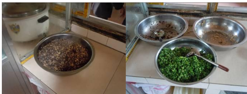
图十 刚出锅的木耳丝炒肉丝 图十一 当天孩子们打饭后剩下的菜品

当天菜品为: 木耳炒肉, 炒油豆腐, 炒菜花, 煮白鸡蛋。调查人员当天目睹厨师做菜过程, 见厨师将所有食材用绞肉机切丝后再下锅翻炒, 且炒菜时油水极少, 调查人员与学生同餐时, 觉得菜品口感一般, 味道偏咸。调查人员发现当天有超过 70% 的学生没有选择“炒菜花”这道菜, 问及原因时, 由于有老师在场, 大部分学生回答“不知道”, 极少数学生说“不好吃”之后, 在老师和同学的眼神示意下, 马上改口说“好吃”。调查人员当日在就餐现场看到部分学生在用餐过程中端着饭碗在操场旁边废弃的厕所门口及学生宿舍楼后面排水沟边转悠, 对这一现象调查人员认为极不正常。因调查人员未能获取相应证据, 所以不做推断。