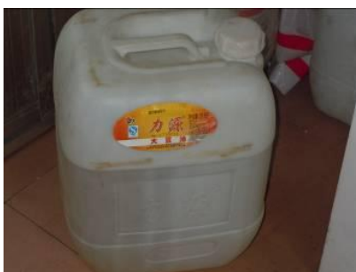
图十二 该校使用的食用油

调查人员当天现场见到了该校使用食用油为“力源”牌大豆油,生产商为广西力源食用油脂有限公司,规格为每桶 21.6 升,校长介绍该食用油采购价为每桶 240 元。调查人员发现,该食用油包装低劣,包装容器仅为普通塑料桶,肉眼所见油质稍浑浊。据调查人员在网上搜索该品牌大豆油相关资料,发现该品牌大豆油网上口碑较差。