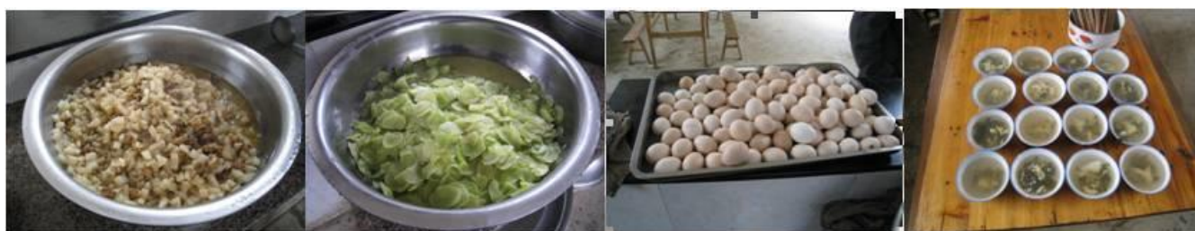
图 8 当日菜品