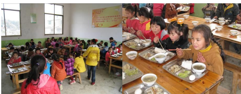
图 7 值日学生用餐组图