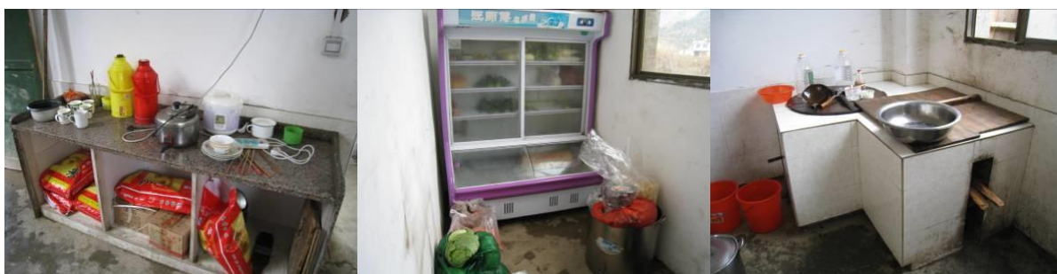
图 5 厨房图片组图