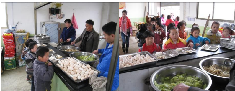
图 6 值日学生领餐组图