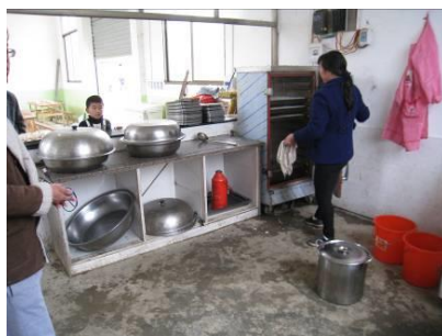
图 4 厨房图片组图

调查人员上午 11 点左右到达该校, 见到该校的厨师正在备餐, 据调查者当日目测, 两位厨师自身穿着比较干净整洁, 但是都未穿工作服。