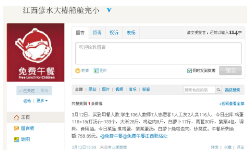
图 3 就餐人数的微博截图

调查人员算了一下当日就餐人数:学生106人+厨工2人+老师7人+调查人员1人=116人。与微博公示相符。