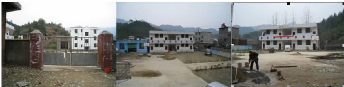
图 1 学校外景

最近的可乘班车的地方。若以后有人探访,可先乘班车至大椿,后联系在县城和船舱间做木头生意的魏先生,30岁左右(手机号为15170931487),上午11点左右在大椿搭他的车可直接到该校。该校现有学前班一个,小学部教学班五个,学生106人,教师8人。