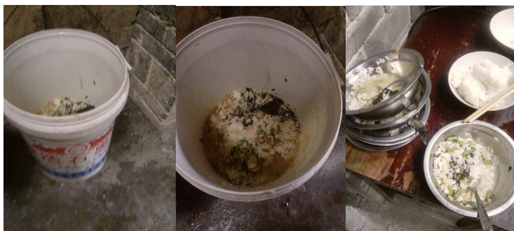
图 11 垃圾桶及碗里的剩饭剩菜