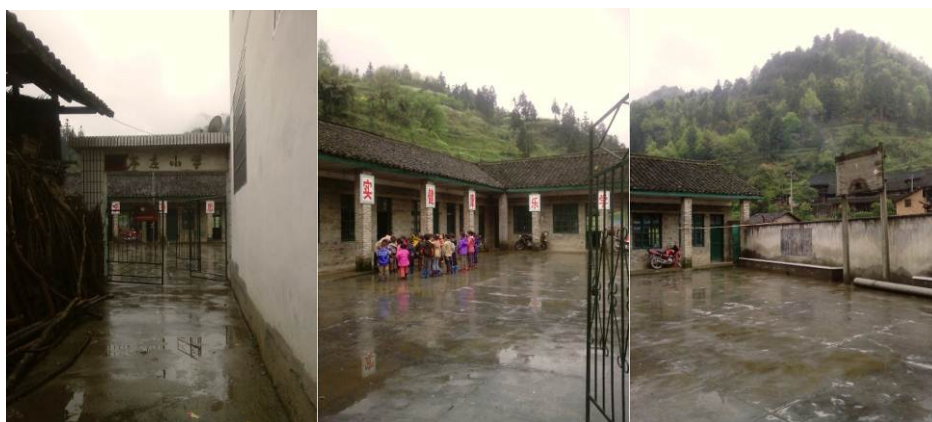
图 2 学校