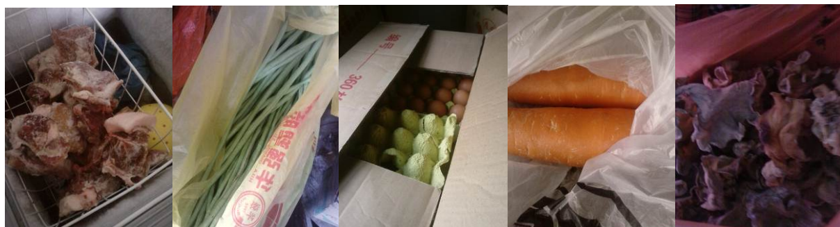
图 14 库存