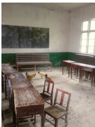
图 7 学生食堂

关于该校餐具的清洗和消毒,据老师反映,由厨工统一清洗并进行消毒。调查人员刚到校就看到,孩子们用餐完毕后将餐具堆放在厨房的工作台上,调查人员离校前又去了趟厨房确认是否有做食品留样,期间,看到碗筷已洗好并整齐排列在消毒柜内进行消毒中。