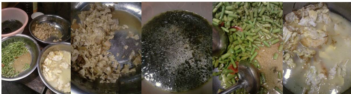
图 12 分餐结束后剩下的