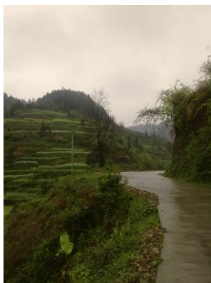
图 1 路况