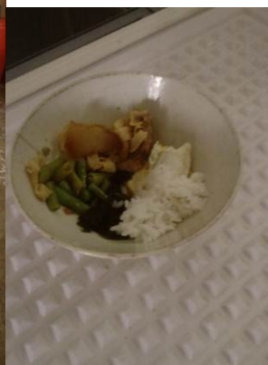
图 9 学食品留样