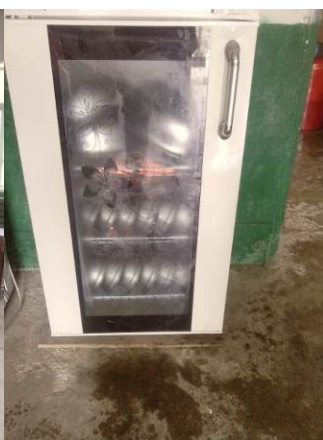
图 8 餐具消毒中