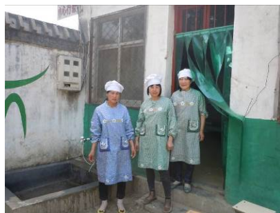
图四 当天在岗的3名厨师大姐