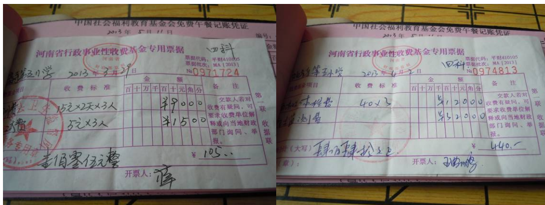
图十一 非午餐一次性支出的凭证