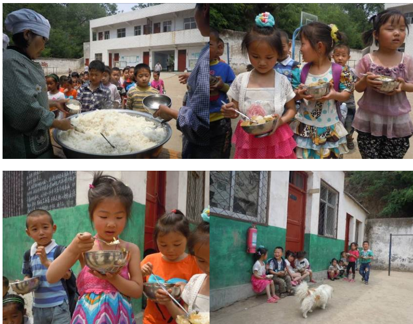
图六 就餐现场组图