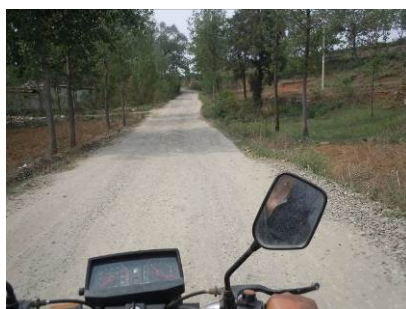
图一 观音寺乡前往桐树庄小学的乡村公路

调查人员 5 月 14 日结束对上一所学校的调查后, 自南召县云阳镇乘坐火车到达鲁山县城 (11 元), 入住鲁山县新汽车站正对面的虹美宾馆 (118 元)。5 月 15 日上午, 调查人员从鲁山县新汽车站出发, 乘坐鲁山至瓦屋乡的中巴客车在观音寺乡下车 (7 元), 之后换乘摩托车前往桐树庄小学 (20 元)。结束对该校的调查后, 搭乘学校老师的面包车到达观音寺乡, 再换乘中巴客车回到鲁山县城 (7 元)。