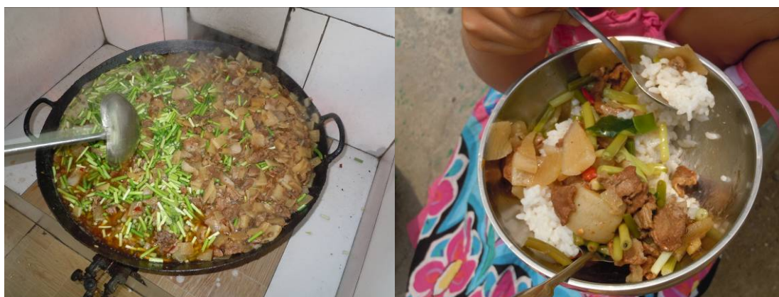
图八 学生当日菜品

该校当日的菜谱为：米饭、蒜薹冬瓜炒肉、绿豆汤。据调查人员观察，学生饭菜份量充足。调查人员当日同全校师生一同进餐，自我感觉菜品口味不错。但调查人员认为学生菜品稍显单一，向学校建议应在控制成本前提下每餐尽量多做一到两个菜式，满足孩子们的营养需求。