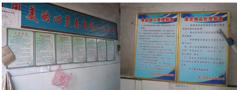
图七 学校厨房已上墙的食品安全管理度

调查人员了解到,该校为做好学生午餐工作建立了相对规范而完善的食品安全管理制度。调查人员在该校厨房看到,与厨房食品安全管理相关的文件、制度均张贴在厨房墙上。调查人员在储藏室看到,该校的食品留样制度完善,日常食品留样取样及保存规范,容器外均贴签并有书面记录。该校还办理了餐饮服务许可证,并为厨师办理了健康证,做到了持证上岗。该校严格执行了师生同餐要求,未见单独做菜或者私人菜品等。