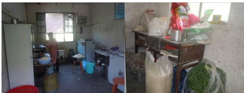
图5 厨房全景及存放库存食材的桌子

该校厨房位于村委会办公楼二楼,面积不足10平方米。调查人员现场见到,厨房卫生状况欠佳,物品摆放凌乱,墙面有较多烟尘或污渍。该校没有独立的储藏室,库存食材均存放在厨房里,但库存食材的存放条件欠佳,摆放随意。