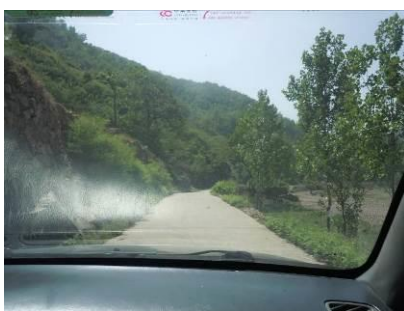
图1 嵩县至板庙小学方向的乡村公路

调查人员于5月17日结束上一个学校的调查后,自鲁山县搭乘火车到达洛阳,入住火车站旁边的花苑快捷酒店。因18日、19日系周末,调查人员经过两天的休整后,于20日早上从洛阳汽车站乘坐中巴客车前往嵩县。到达嵩县后,因时间紧迫,调查人员招了一辆本地出租车前往板庙小学。结束对该校调查后,调查人员乘坐中巴客车回到嵩县,再换乘嵩县至洛阳的客车回到洛阳。调查人员特别提醒,早上洛阳至嵩县的中巴客车因出城方向堵车严重,且客车边走边上客,需要3个小时方能到达嵩县。