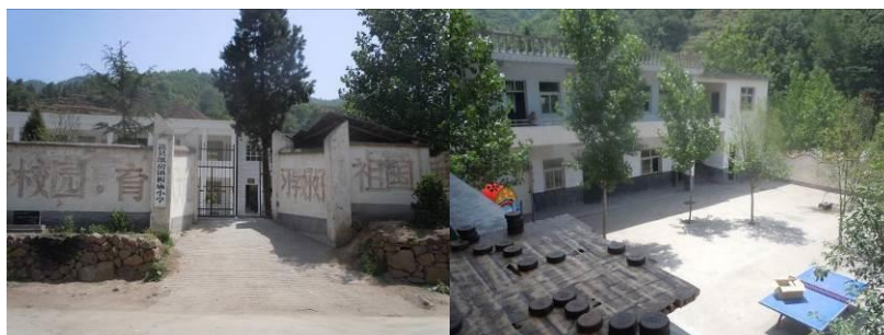
图 2 板庙小学大门及校园环境

板庙小学因正在新建教学楼, 临时迁入紧邻校园的板庙村委会办公楼上课。目前该校新教学楼建设已接近完工, 预计在今年秋期开学时投入使用。