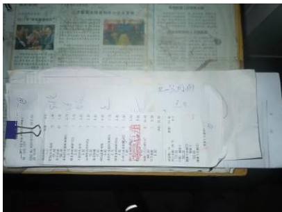
图 9 该校出示的采购原始单据

该校严格执行了轮流采购。据校长及厨师介绍,该校日常食材采购由 5 位老师轮流负责。食材采购均系定点采购,主要采购自嵩县县城,采购周期不固定。调查人员查阅了该校近一个月以来的采购流水账,从账面上看,食材采购价格与当地行情基本一致。调查人员在厨房看到库存的食材均较新鲜,大米、食用油等均是正规厂家生产。