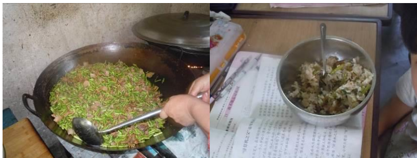
图 8 学生当日菜品