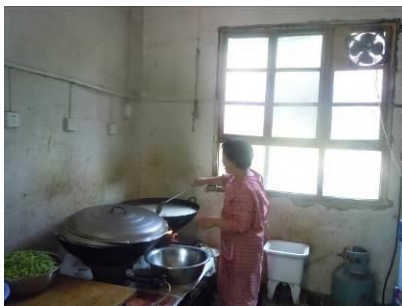
图4 调查人员现场见到的厨师

调查人员当天在该校厨房见到厨师一名,女性,年龄约50岁,持健康证上岗。厨师未着工装,但有系围裙,目测厨师自身着装比较干净,操作也相对规范。