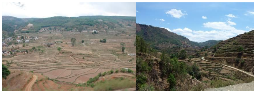
图 2 禄劝地貌

禄劝地处南北向切割的横断山脉中段及滇池断陷带上,地形较为复杂。绵亘耸立的群山与深邃的江河溪涧相间,地表被纵横交错的溪河切割,南部较完整,中部和北部较破碎。最为明显的是自南向北而流的普渡河与自北向南而流的掌鸠河,把县境切割为三大块,形成很多断裂带。东部和东北部的翠华、中屏、九龙、转龙、乌蒙、雪山、则黑、马鹿塘等地区,地壳运动剧烈,地震和滑坡频繁。