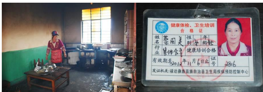
图 6 厨师个人卫生一般