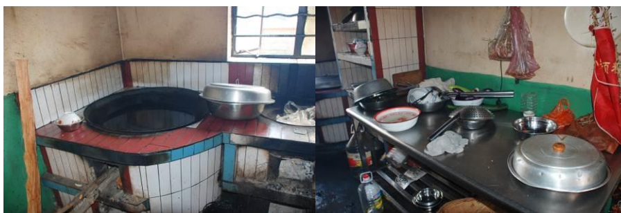
图 7 灶台和工作台