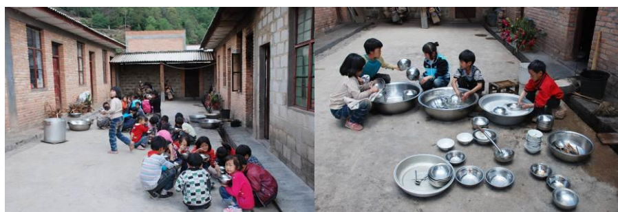
图 10 学校没有餐厅，孩子们就地而餐