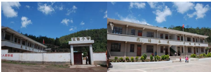
图 3 学校外景