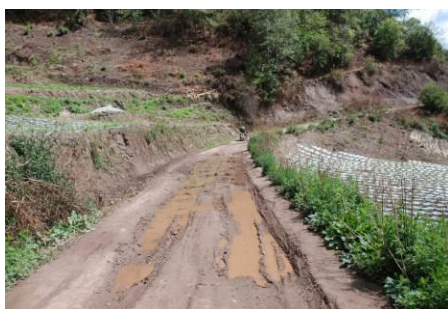
图 1 去宏德小学的途中

调查者 5 月 11 日从长沙出发到昆明, 晚 11 点左右宿昆明。12 日前往禄劝县, 终达翠华镇, 宿镇上。13 日 9: 30 租摩托车前往, 约 11 点左右到达宏德小学。