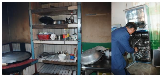
图 8 碗柜较清洁