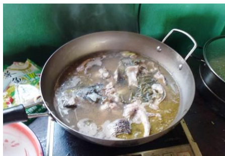
图 23 老师午餐的菜汤鱼