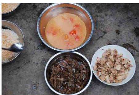
图 34 学生当天的午餐菜品

当天菜谱为炒肉、烧茄子和番茄鸡蛋汤两菜一汤, 口味还好, 但几个同学分食一份菜, 分量稍显不足。主食是米饭。