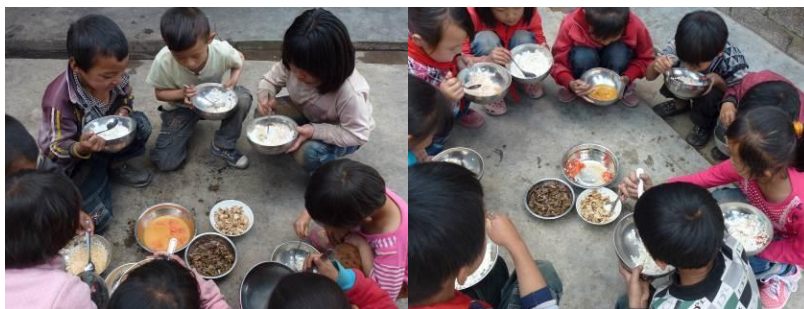
图 5 学校还没有餐厅和桌椅, 学生蹲在地上围成圈吃饭