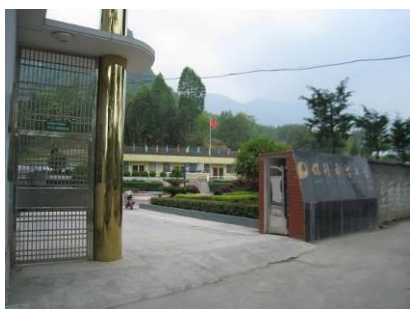
图 1 学校外景

桥小学，其所在的李桥村位于走马镇南约 6 公里。该校为全日制学校，含学前班 2 个，43 人；小学部 6 个班，学生 120 人；教师 18 人（含 3 名代课教师）。