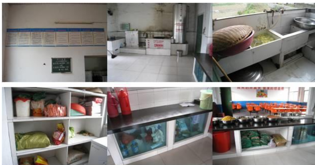
图 5 厨房组图

调查人员到校后，查看了该校的厨房。厨房卫生制度方面，该校制定较完整的卫生责任制度，并且就做到了责任到人；该校食堂将操作间和洗菜间进行了分割，做法值得推荐；该校的干货食材和新鲜蔬菜分柜存放，前者还设置了玻璃橱窗。午餐准备好之后，厨师已在及时清理厨房卫生，地面、灶台都非常干净。但是厨房的墙面离地面较高的部分存有部分黑色陈灰。