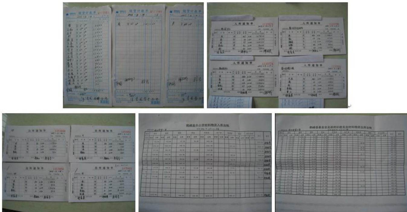
图 9 该校账目组图