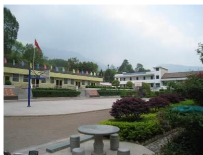
图 2 学校内景