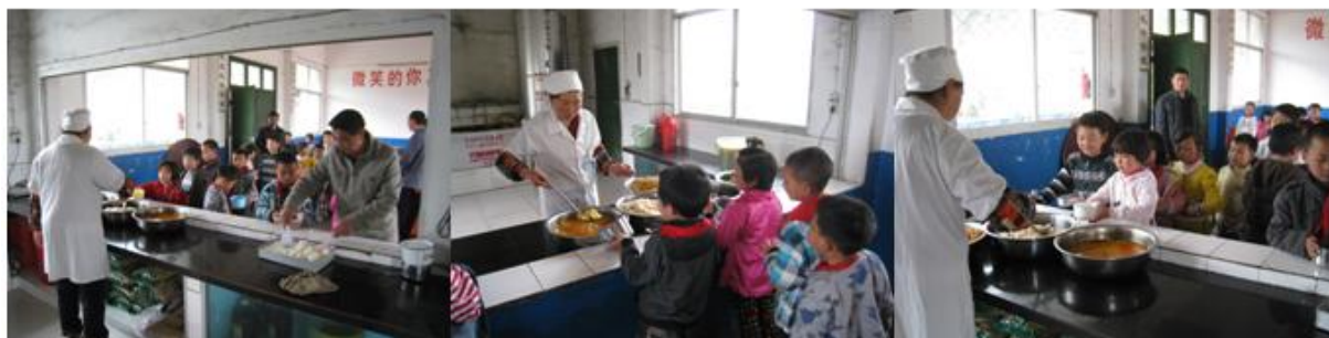
图 6 学生排队和盛饭组图