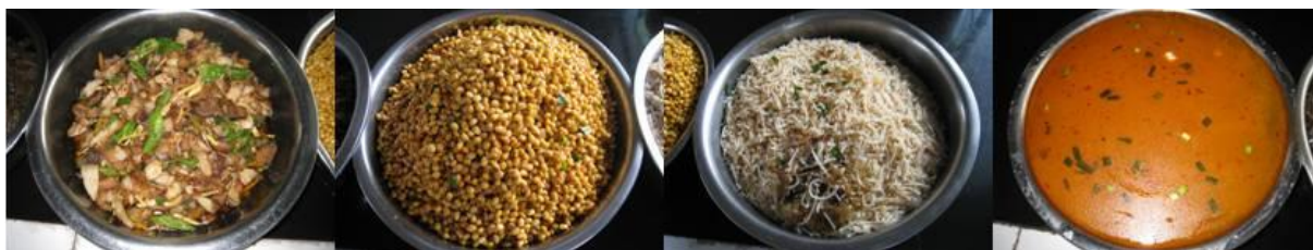
图 7 当日菜品

调查当天的菜谱为青椒炒肉、炒黄豆、炒粉和洋芋汤。与微博公示一致。调查人与学生共餐, 感觉菜都很爽口, 肉炒的很鲜、洋芋煮的很软。调查人从学生用餐的情况能看到, 学生剩菜的情况相当少。