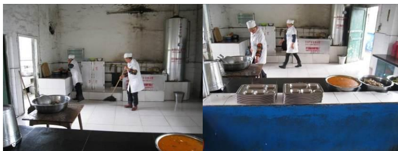
图 4 厨师正在备餐组图

调查人员中午 12 点到达该校，厨师已经在做开餐的最后准备。发现两位厨师都着工作服，都比较干净整洁。