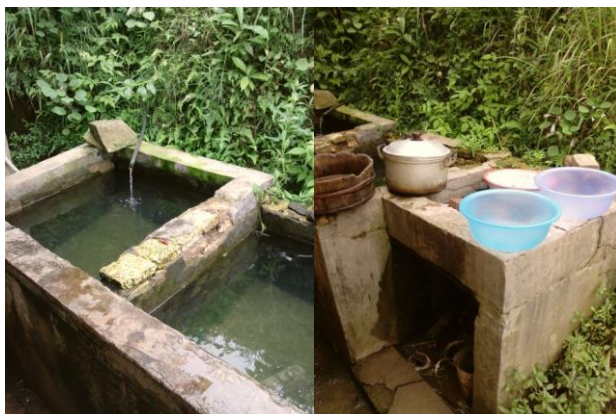
图 23 供水