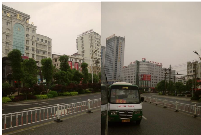
图 1 宜春