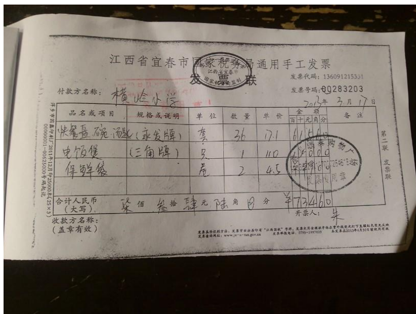
图 18 关于 734.6 元支出的发票