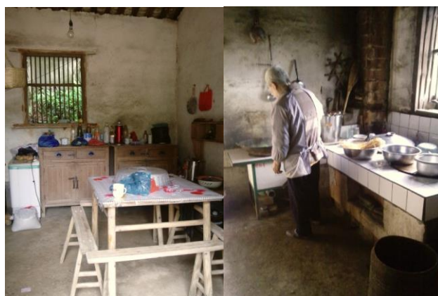
图 22 厨师、厨房