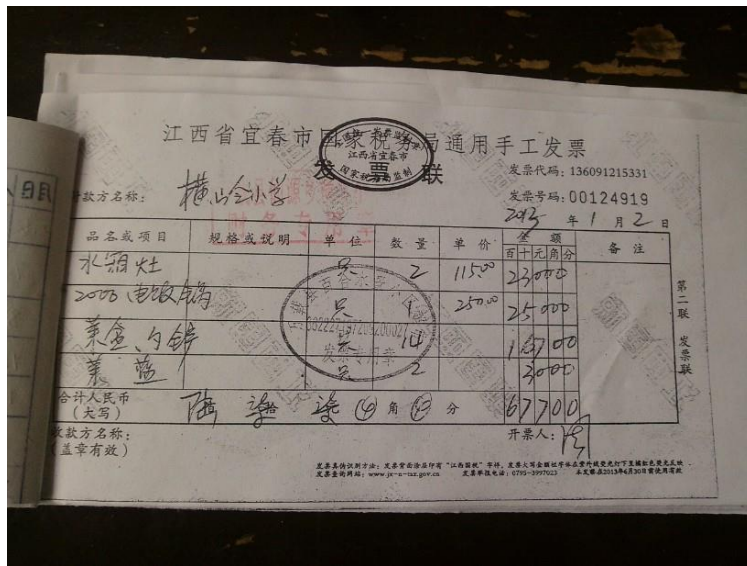
图 15 关于 677 元支出的发票