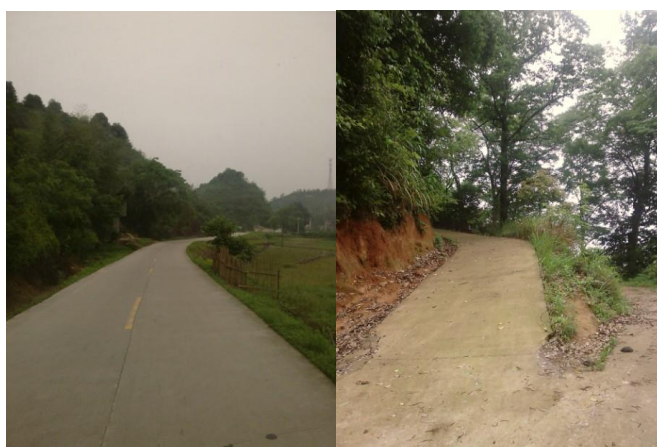
图 2 路况