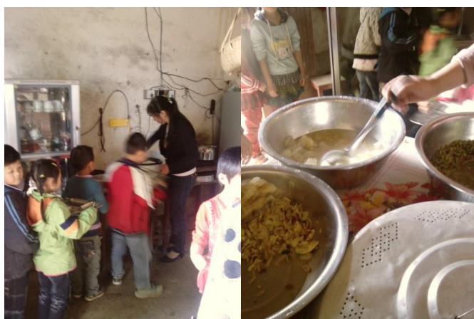
图 27 饭菜由学生代表从厨房领到课室

本次调查的时间为 2013 年 5 月 20 日，该校实行分餐制，孩子们排队在餐厅领餐后在课室用餐。调查人员现场所见，孩子们先领饭，再领菜，领菜的时候，孩子们会告诉老师不要什么菜，而当日，由于肉是与冬瓜一起煮的，孩子们不喜欢冬瓜，不要冬瓜的时候也就连肉也吃不上了。建议学校留意孩子的喜好，肉不要和孩子不喜欢的素菜一起做。