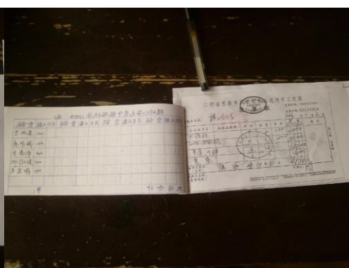
图 29 食品留样