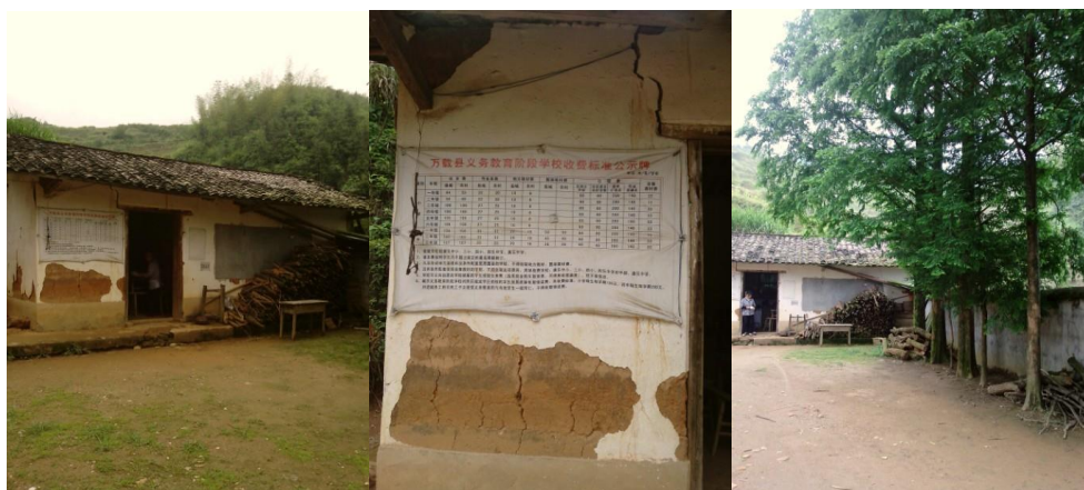
图 4 厨房