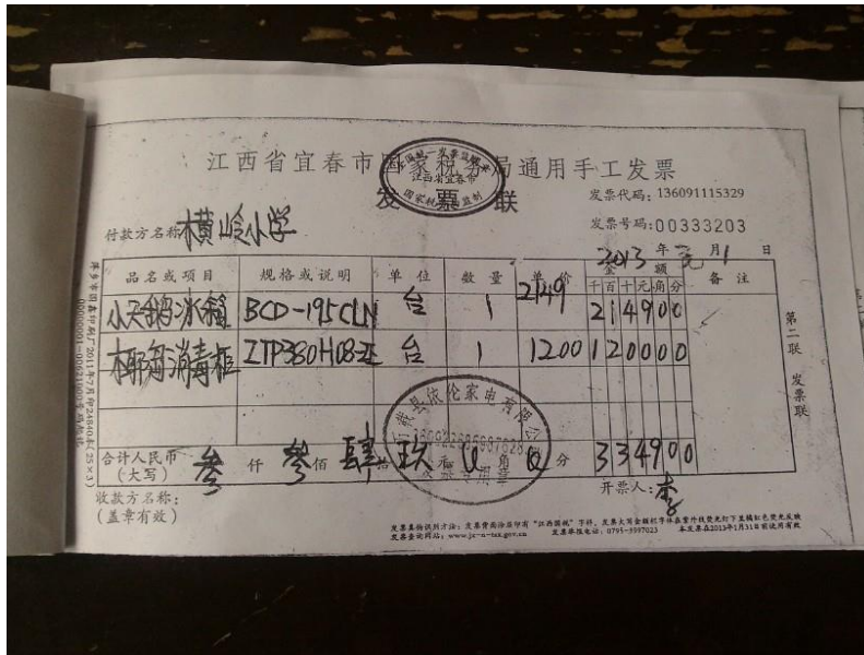
图 17 关于 3349 元支出的发票