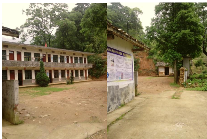
图 3 校园