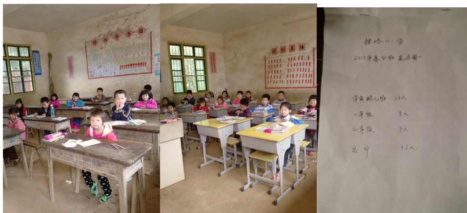
图 19 学前班