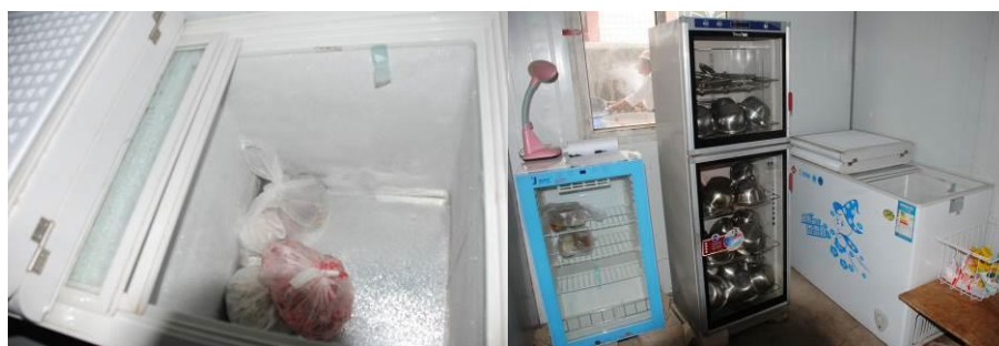
图 9 冰柜清洁