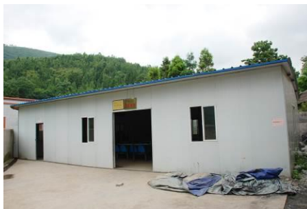
图 4 厨房和餐厅是临时板房