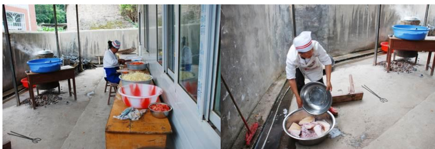
图 6 简陋的厨房

厨房是临时的, 厨房设施也非常简陋, 里面的工作台和灶台也很简陋, 卫生状况一般。