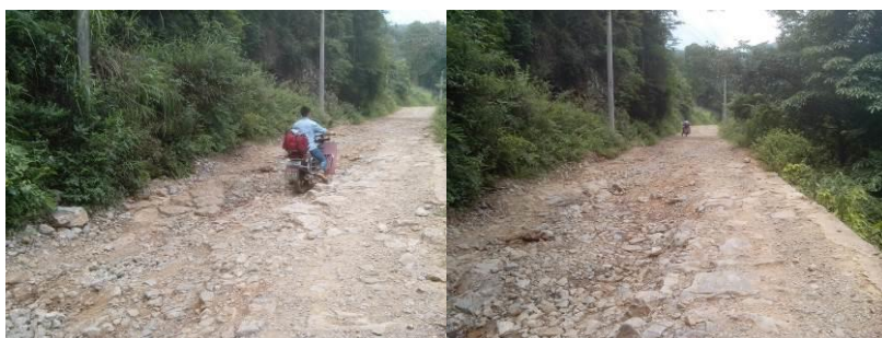
图 1 从沙坝小学返回中坪的路全是这种石头路, 坐在摩托车上颠得要死

调查者 6 月 30 日从贵阳赶往黔西县, 继而从县城前往临近花溪乡的中建乡。晚宿中建。7 月 1 日 8: 30 包摩托车前往花溪村沙坝小学, 约 50 分钟后抵达沙坝小学。