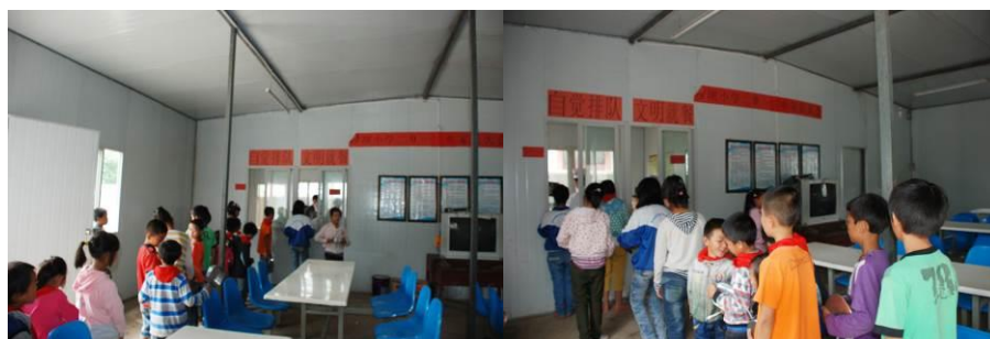
图 11 孩子们在排队打饭