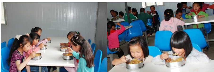
图 12 孩子们在餐厅用餐