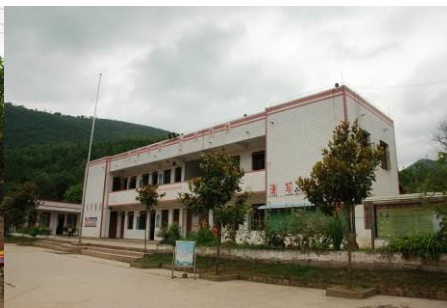
图 3 沙坝小学教学楼