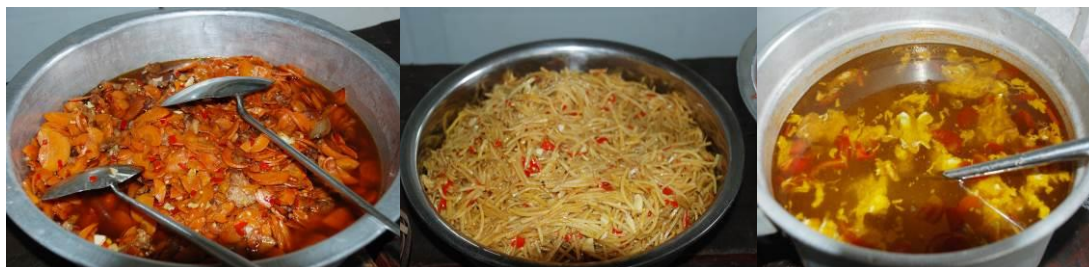
图 16 学生当天的午餐菜品