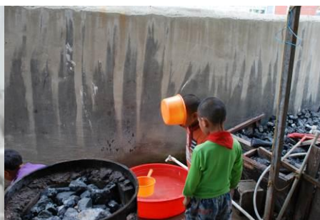
图 15 孩子们都喝生水