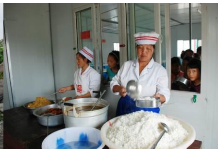
图 5 厨师个人卫生还好