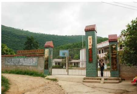
图 2 沙坝小学外景