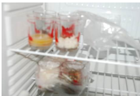
图 14 菜品有留样