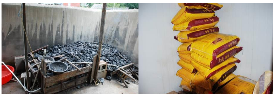
图 7 燃料是块煤