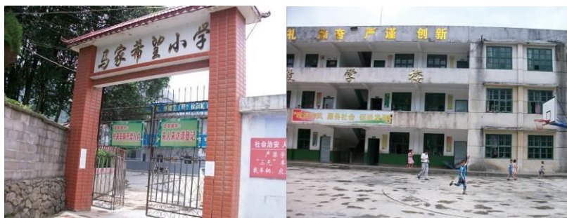
图 4 目的地马家小学