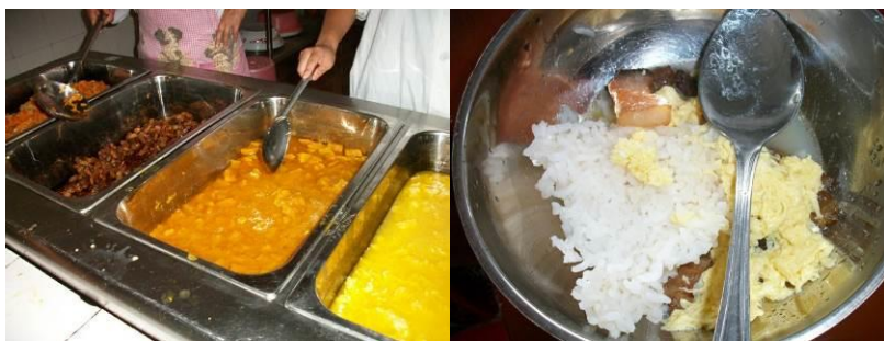
图 8 调查当日菜品