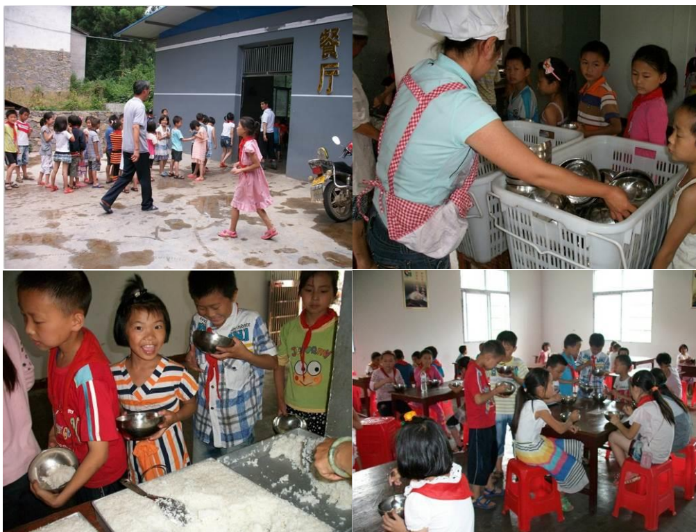
图 13 学生打饭和用餐组图

本次调查的时间为 2013 年 6 月 21 日,调查人员在校期间看到,孩子们离开课室后,需要排队进入餐厅,进入餐厅后在按序领取:碗及米饭和菜,然后端坐餐厅用餐。在没有老师维护秩序的情况下,孩子们自觉完成上述流程,该校素质培养的效果让调查人员眼前一亮。