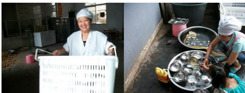
图 12 厨工发放和清洗餐具

本次调查的时间为 2013 年 6 月 21 日,调查人员在校期间了解到,该校学生 210 人,老师 22 人,聘请厨师 4 名,每人月薪 900 元(其中:免费午餐项目承担 800 元,学校的教育经费承担 100 元)。每日用餐前,由厨工把碗从消毒柜取出,用篮子盛好在餐厅发放,孩子们用餐后,把碗放到厨房后的大盆里,由厨工统一清洗。该校的餐具由于整个流程都有厨工把控,所以卫生做得非常好,而且有序。老师向调查人员进一步解释,出于安全和卫生的考虑,厨工统一洗碗从这个学期开始执行。