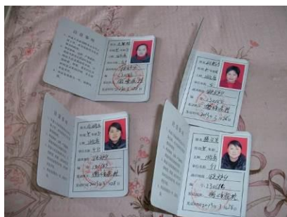
图 6 厨师健康证

本次调查的时间为 2013 年 6 月 21 日, 调查人员在校期间了解到, 该校厨师 4 名, 各人月薪 900 元 (其中: 免费午餐项目承担 800 元, 学校的教育经费承担 100 元)。厨工们身穿统一的工作服, 头戴工作帽, 工作时笑眯眯的, 很快乐的给孩子们服务, 老师还在办公室给调查人员出示了四名厨工的健康证。