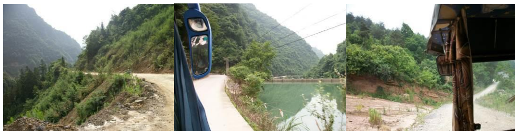
图 1 鹤峰到走马的路况

马家小学(全称: 马家希望小学)位于湖北省恩施州鹤峰县铁炉乡, 该校设小学 1-6 年级各一个班, 合计学生 210 人, 没有学前班, 也没有初中和高中, 实行全住宿制, 孩子们周日在家午餐后下午到校(周日下午安排有 2 节课), 周五在校午餐后离校回家(周五下午没有安排课时)。据老师介绍, 该校曾经设有学前班, 但后期, 由于街上办了幼儿园, 学校就撤出了。