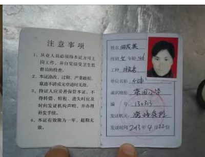
图 6 炊事员大姐的健康证