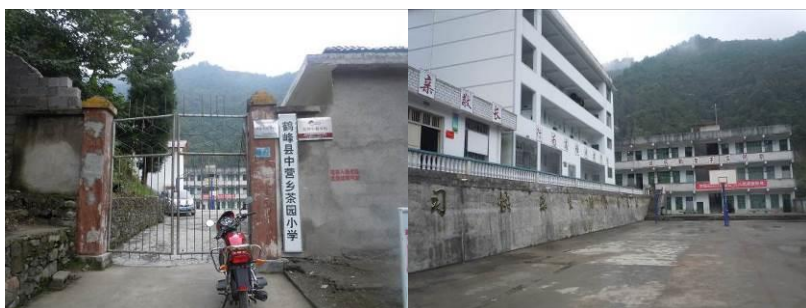
图 2 学校大门

中营乡茶园小学位于湖北恩施州东南方向的鹤峰县中营乡白鹿村，距离鹤峰县城约 35 分钟车程。学校所在地为典型的山区，当地居民生活水平尚可，主要经济来源以茶叶种植及外出务工为主。茶园小学现为“国家营养改善计划”覆盖学校，全校现有学生 147 人（其中寄宿制学生 100 人），教职工 18 人，自 2011 年 11 月起正式开餐。该校现有的供餐模式为：寄宿制学生早、中、晚三餐，其中早中餐免费，每周供餐 5 天；晚餐面向学生收费，收费平均标准为 3.5 元/生/餐，每周供应 4 天；走读生早、中餐免费。