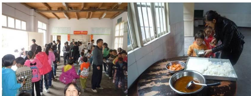
图 11 老师现场组织排队及协助分餐