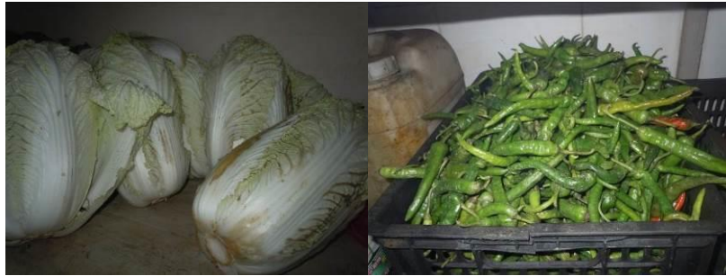
图 14 已出现变质迹象的大白菜及小青椒