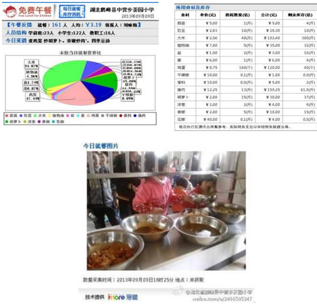
图 4 9月9日学校微博就餐反馈公示

调查人员算了一下当日就餐人数：学生 145 人+教师 14 人+炊事员 2 人=161 人，与该校微博公示内容一致。