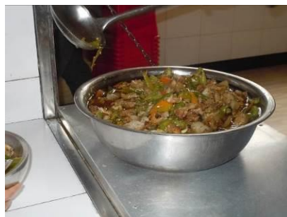
图 12 当日菜品

今日菜品: 米饭、青椒回锅肉、炒胡萝卜、豇豆(长豆)汤、白鸡蛋, 菜品口味一般, 分量充足, 餐后未见明显浪费, 但调查人员发现该校肉类菜品肥肉较多, 少部分学生因不喜欢肥肉而选择不吃肉。