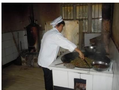
图 5 现场见到的炊事员大姐

现场见到两名炊事员, 其中一名规范着装 (白色工作服+帽子), 并出示了健康证, 现场未见明显不规范操作; 另一名炊事员因外出购木柴, 临近午餐时间才回来, 调查人员因故未能看到该名炊事员健康证。