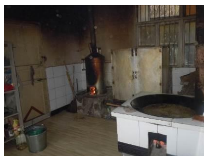
图 7 学校现有厨房

该校厨房位于学校综合楼旁边一幢独立平房里, 厨房干净整洁, 卫生状况良好, 物品摆放整齐规范。该校校长同时介绍, 2012 年初, 浙江“宇峰希望厨房”为该校捐赠了现代化厨房设备, 因动力电尚未安装到位, 目前暂未投入使用。