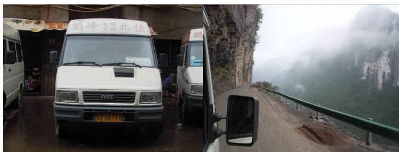
图1 前往该校的客运班车及路况

2013年9月9日,调查人员步行至鹤峰景发客运站,乘坐前往中营北佳方向的客车抵达茶园小学所在地中营乡白鹿村(10元),车程约40分钟左右,下车地点当地人称“茶园”,距离茶园小学约50米远。结束对该校的调查后,调查人员原路乘坐客车回到鹤峰县城。