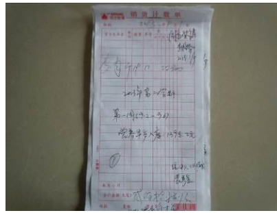
图 13 采购原始凭证