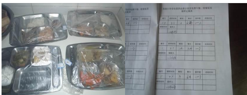
图10 食品留样及记录表