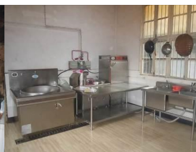
图 8 尚未投入使用的宇峰厨房设备