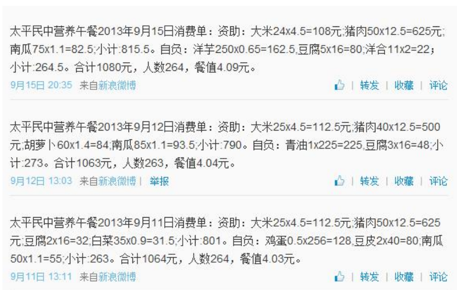
图 5 学校微博午餐反馈公示截图

该校当日因系周五, 未开午餐, 调查人员到校时炊事员已下班, 校长向调查人员提供了全校应到教职工人数 52 人 (教师 48 人, 炊事员 4 人), 全校拟纳入免费午餐计划 318 人。该校当日未开餐, 微博无反馈, 日常公示的营养午餐就餐人数在 260 左右 (不含教职工), 学生就餐人数公示基本正常, 微博截图如下: