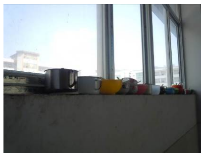
图 8 位于餐厅窗台上的学生餐具

餐具被放置在餐厅两侧的窗台上,没有统一存放餐具的地方,在教师餐厅见到两个较小的消毒柜,总务主任介绍均系教师餐具消毒使用,总务主任同时介绍,春苗希望厨房计划为该校提供两台大型学生餐具消毒柜,但尚未配送到位,待设备配送到位方可进行学生餐具消毒。调查人员在该校位于教职工餐厅的冰箱了看到了日常三餐的食品留样,取样保存规范,记录表记录方式完整规范,但调查人员发现食品留样标签被直接放置在食物上面,调查人员已现场提醒总务主任注意。