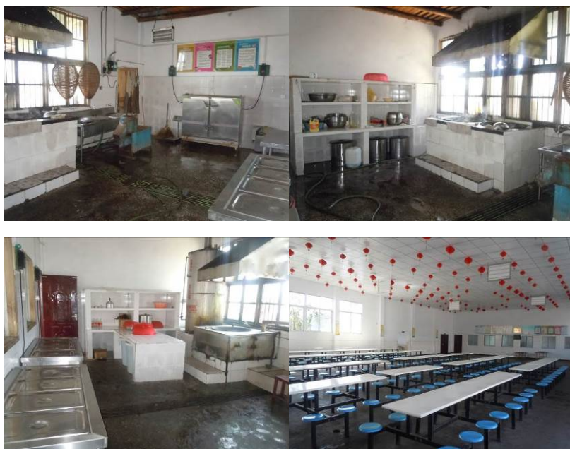
图7 学校厨房及餐厅组图