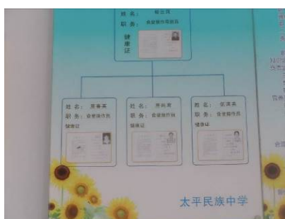
图6 餐厅墙上的炊事员健康证(复印件)

调查人员当日未开午餐, 未能见到炊事员, 但据该校总务主任介绍, 该校炊事员上岗时均规范着装, 并且均办理了健康证, 调查人员在餐厅墙上见到了4名炊事员的健康证复印件; 该校学生食堂分为餐厅和厨房, 餐厅干净整洁卫生, 厨房由“春苗希望厨房”项目提供了全套设备, 但厨房环境卫生状况不理想, 地上比较湿滑油腻, 各种设备物品清洁程度欠佳。