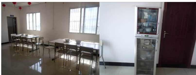
图 10 教职工餐厅及教职工专用餐具消毒柜