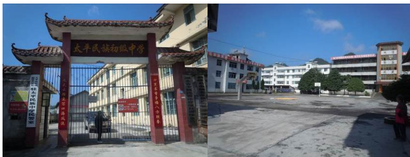
图 2 学校大门

太平民族中学位于湖北恩施州东南部的鹤峰县太平镇民主路, 距离鹤峰县城约 35 分钟车程。该校为一所全寄宿制完全中学, 现有三个年级六个教学班, 在校学生 266 人, 教职工 52 人, 自 2012 年春期起启动“国家营养改善计划”, 实施模式为“3+1”的午餐正餐供应。调查人员到达该校当日因系星期五, 学校总务主任介绍该校周五不供应午餐, 上午放学后学生均返回各自家里, 星期天下午返校, 星期五的午餐被挪至星期天供应晚餐。该校目前早中餐三餐均向学生收费, 具体收费情况为: 早餐 3 元/人, 午餐 1 元/人, 晚餐 4 元/人。该校目前已通过免费午餐基金审批, 但尚未邮寄纸质申请材料及资助协议。