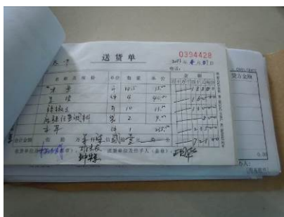
图 11 日常采购凭证

据学校总务主任介绍, 该校大宗食材采购均系定点采购, 并与供应商签订了供货协议, 日常采购由两位老师负责, 采购原始单据保存完整规范; 根据该校食堂的采购台账登记的采购单价及调查人员自鹤峰县城了解到的物价行情, 调查人员认为采购价格与当地行情价格基本一致, 部分食材甚至低于当地行情。因调查人员到校时食堂炊事员已下班, 食材储藏室门已锁上, 故未能见到库存情况。