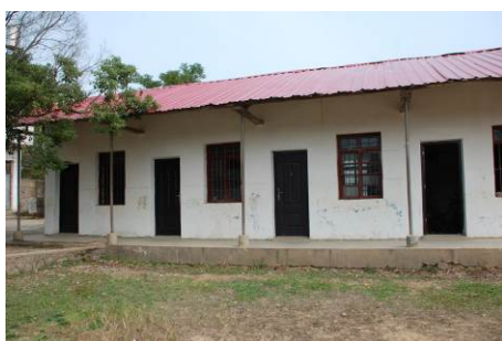
图 4 学校厨房