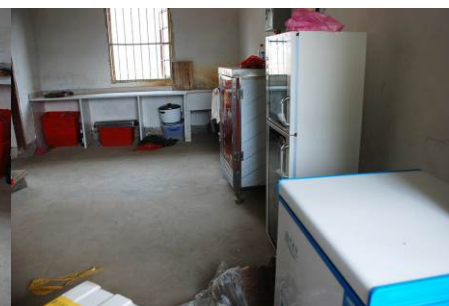
图 16 消毒柜平时都正常使用