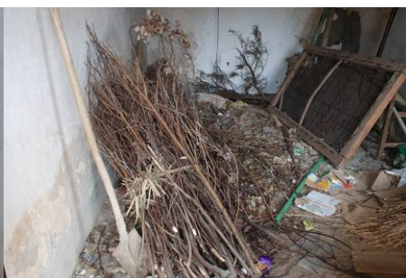
图 14 柴房