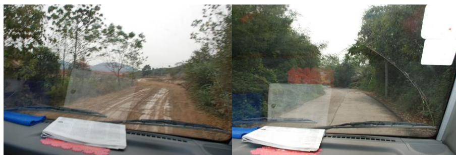
图 1 去往学校的路况

马回岭镇人杰地灵，文化底蕴深厚，镇内有大量文胜古迹和人文景观。千古名句“采菊东篱下，悠然见南山”中的南山指该镇境内的面阳山，陶公之墓便坐落在面阳山；马头村荆林街为汉柴桑县唐楚城县故址；富民村荞麦岭有东汉墓葬区遗址；周瑜水师练兵场芦花荡；马回岭老火车站是国民革命军第二十五师参加“八一”南昌起义出发地；杨柳村六祖庙是中国佛教禅宗第六代祖师——惠能大师为弘法道场而建。