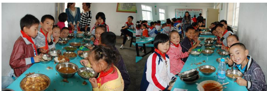
图 17 当日小运动员们在中心校聚餐