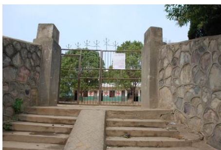
图 2 学校外景

调查者去的当天是 10 月 15 日，正值马回岭镇小学开秋季运动会，只有 11 名该校的小运动员在 4 位老师的带领下去参加运动会，其他学生都放假，学校没有开餐，调查者赶到学校后，查看了学校的食堂和教室。然后又急忙赶到中心校，找到了该校的老师和小运动员们。该校大部份情况都是从校长费丹老师那里获悉。