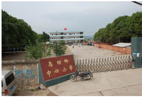
图 8 马回岭镇中心校