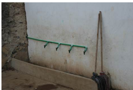
图 13 洗手池

调查者询问费丹校长了解到，学校一般是中午 12 点左右下课吃午餐，学生自觉排队洗手，然后排队取饭菜。学生们在自己的教室用餐，用餐完毕后，学生将餐具放到指定地点由厨师清洗，然后放入消毒柜处理。