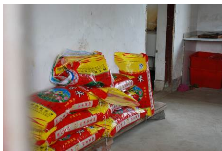
图 15 储物间干净整洁

据费丹校长介绍，老师没有自己的食堂，与学生共餐。老师在学生打餐完毕后，才开始用餐。学校会组织学生排队洗手、打饭。学校未向学生提供乳制品，打饭菜较公平。