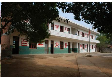
图 5 学校教学楼