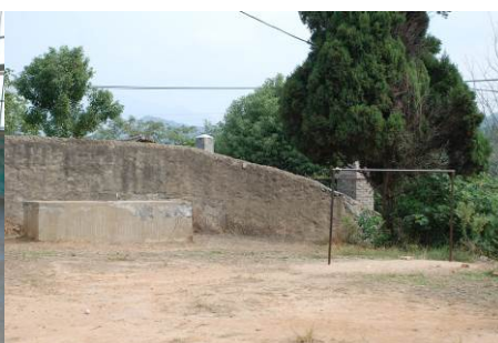
图 7 学校简陋的体育设施