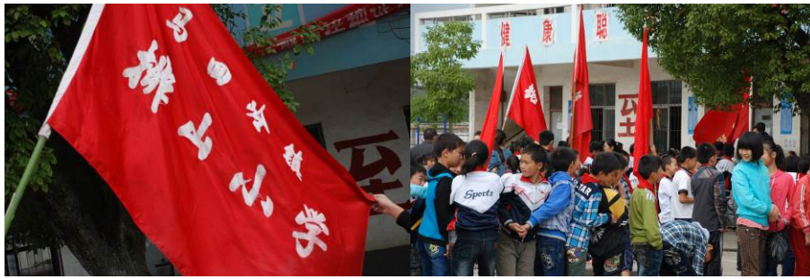
图 11 据老师介绍，排山小学在运动会上取得了不俗的成绩