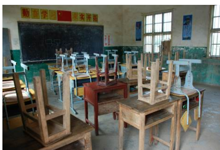
图 6 拼凑的破旧课桌椅