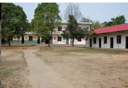
图 3 学校内景