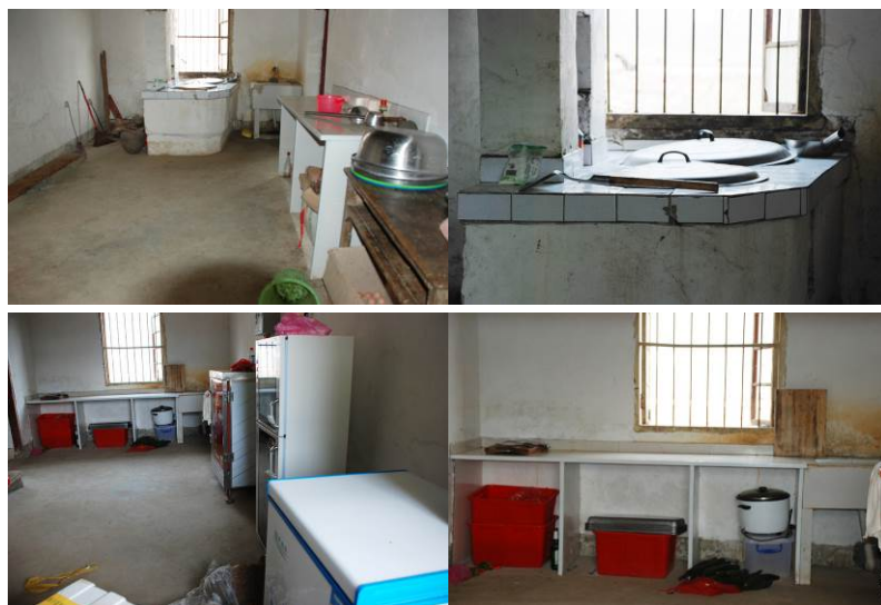
图 12 厨房组图

虽然当天没有开餐，但调查者对该校的食堂操作间、储藏间等地进行了认真检查，发现厨房卫生、工作台、砧板和灶台墙面、地面都还很干净。说明该校平时的卫生习惯比较好。