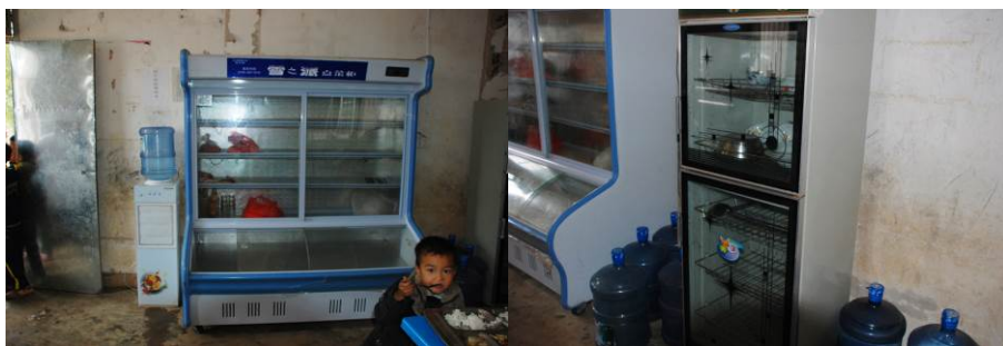
图 10 冰箱、消毒柜正常使用