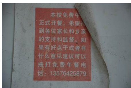
图 15 学校的午餐公开接受家长监督

老师没有自己的食堂，与学生共餐。教师们在学生打餐完毕后，才开始用餐。该校在组织学生排队餐前洗手、打餐、制止浪费等方面都做得较好。未向学生提供乳质品，但学生反映打饭菜不太公平。