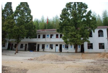
图 3 学校内景