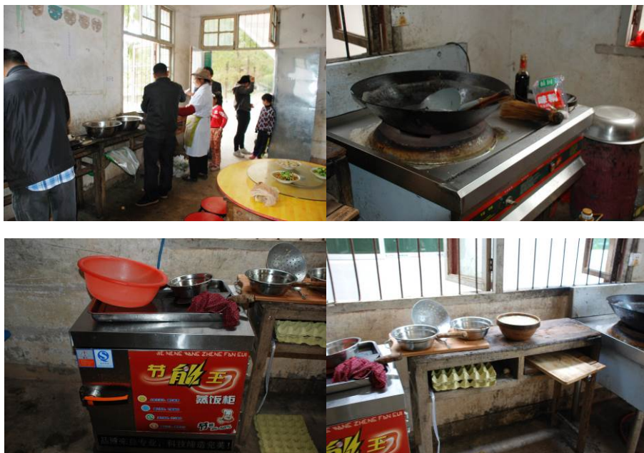
图 9 厨房组图

调查者到校后, 查看了该校厨房, 发现厨房是以前的教室改成的, 因老旧故墙面和地面不很干净, 但灶台、砧板、工作台还比较卫生。