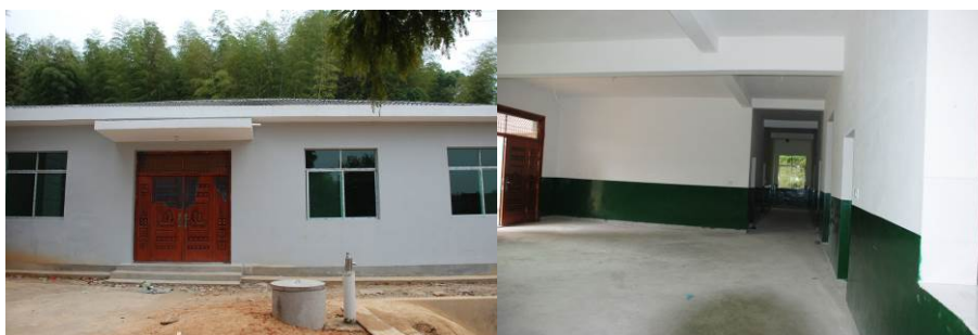
图 4 学校新建食堂

当地政府对免费午餐进驻该校相当重视，斥巨资 29.1 万元为学校修建了新食堂。在此特提出表扬和十二万分的感谢！上海爱心人士韩明一家为学校捐资 3400 元人民币打了一口水井，在此表示由衷的感谢！上海印刷出版学校定向向学校捐资 3500 元/学期，在此表示衷心的感谢！感谢政府部门及社会各界爱心人士对教育事业的大力支持及对孩