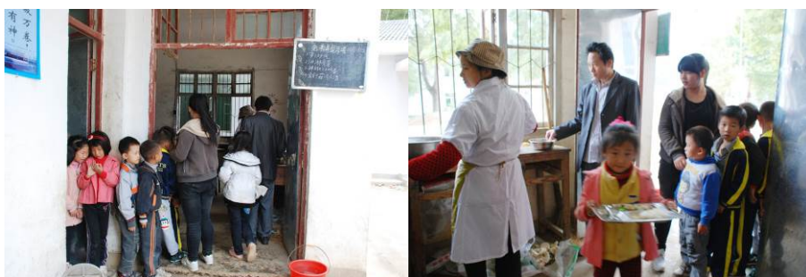
图 11 学生排队打餐

调查者 11:30 赶到学校的时候学校正在打餐了, 观察到, 学生们都自觉在厨房外排队领餐。餐具由学校保管。用餐完毕后放到指定地点, 由厨师统一清洗后放入消毒柜做消毒处理。