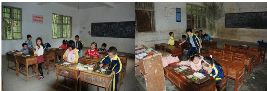
图 12 小学生教室用餐