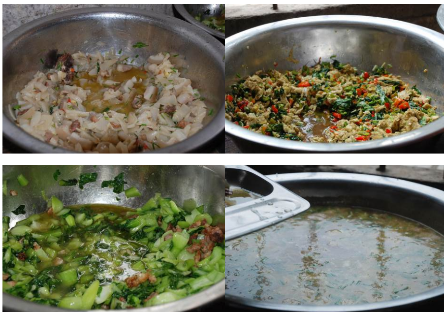
图 18 当日菜品