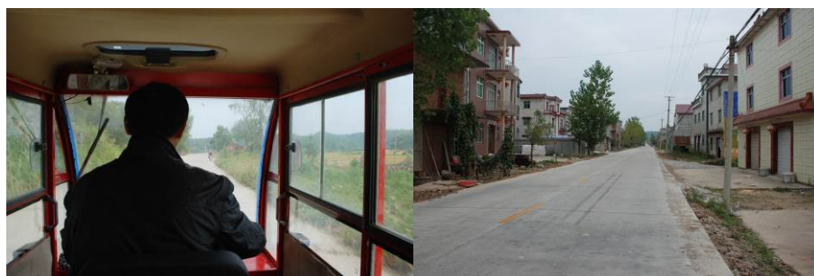
图 1 去往学校路况

吴家、洪罗、洪岩、甘村、项家庄、段家、下埠墩、湖村等 8 个行政村，镇政府驻岩前。