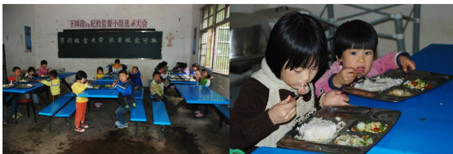
图 13 学前班儿童在厨房里的小餐厅用餐