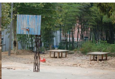
图 7 学校简陋的体育设施