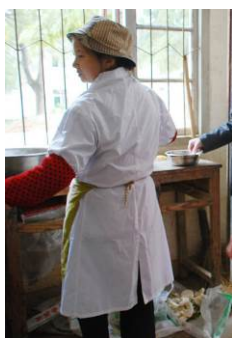
图 8 厨师正在打饭

调查人员中午 11: 30 到达该校, 学校正好开饭, 对该校的食堂操作间进行了突击检查, 1 位厨师和老师正在给学生们发饭。厨师有穿工作服, 戴帽子, 且比较干净整洁。有健康证。