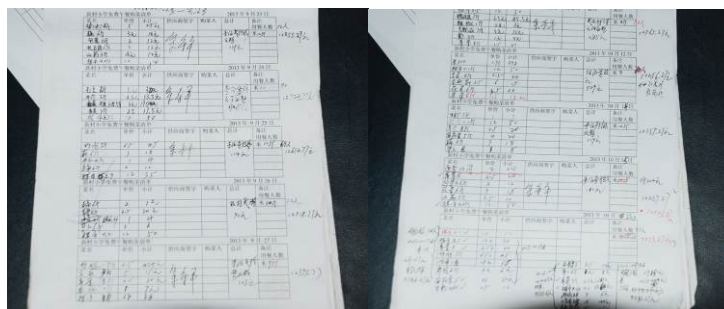
图 19 采购凭证组图