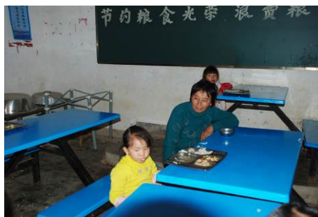
图 14 附近学生家长中午来校监督学校午餐