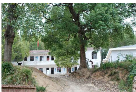
图 2 学校外景

新村小学属洪岩镇下埠段村。现有 5 个年级分成教学班 4 个，学前班儿童 21 人，小学生 43 人，教师 7 人，厨师 1 人。学生离校最远的要走 1 个小时左右才能到校。免费午餐于 2012 年 9 月 3 日开始在该校做鸡蛋测试，正式开餐是 2012 年 11 月 7 日。该校是座开放式学校，没有围墙，下课或中午时学生们很多跑到野外去玩，学校对学生的生命安全无法保障。