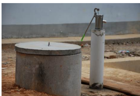
图 6 由上海爱心人士韩明一家人捐资修建的水井