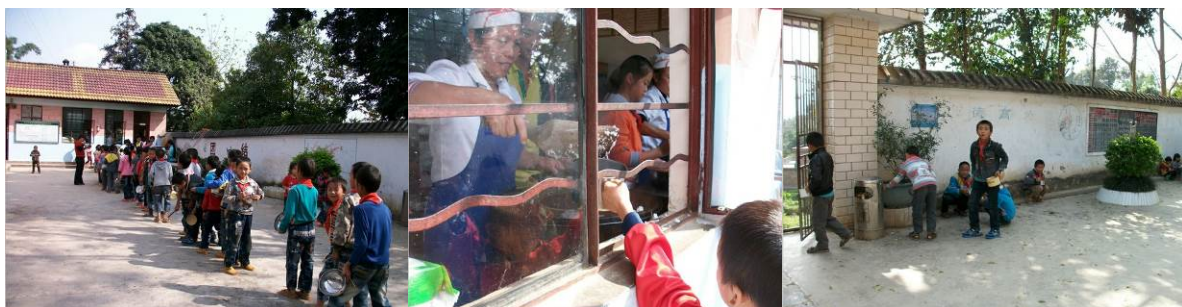
图 16 排队领取饭菜

该校设有小卖部但不卖乳制品, 学校也不派发牛奶。关于师生同餐, 在该校得到了有效的执行。