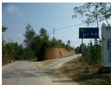
图 3 下车的路口