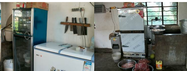
图 12 厨房设备