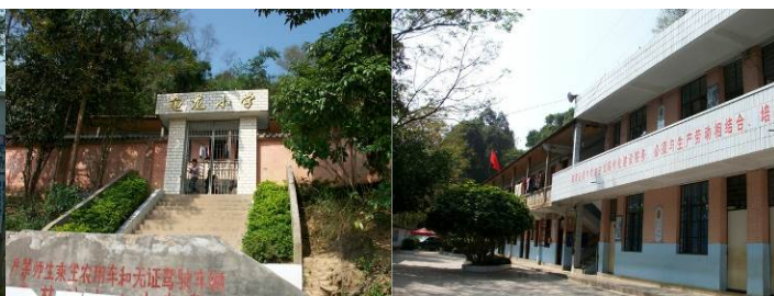
图 4 学校