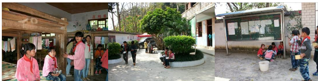
图 14 用餐情况

关于餐具消毒，据该校校长介绍，由于学生的餐具是双层的不锈钢碗，叠放后不能置放于消毒柜内，所以，该校所采用的学生餐具消毒方式是：每周提供两次开水烫碗。