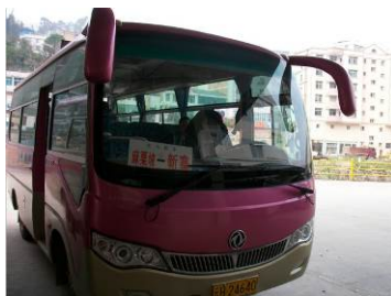
图 1 交通

该校缺水的状况到调查人员到校时仍不能有效解决, 据校长介绍, 该校水源有两个, 一是山泉水, 二是水库水。现用的是山泉引水, 希望能促成水库引水。具体情况: 每年开春的 3-6 月, 该校就会因为山泉水的流量少而不足以供应师生用水, 缺水期由政府用消防车一周送水一次。现在的山泉引水, 是以前水利部门做的民生工程引水到各村寨, 学校一直共享这个福利, 但由于学校地势低, 影响地势高的老百姓正常用水, 所以, 供水常被拦截造成缺水, 学校殷切希望能完成一个独立的引水工程, 据校长介绍, 山上有水源 (林水库), 引水工程启用 20 个工人采用 6 分管铺设 20 公里, 工期一周左右, 预算 20 万 (其中: 材料 10 万, 人员工资 10 万)。