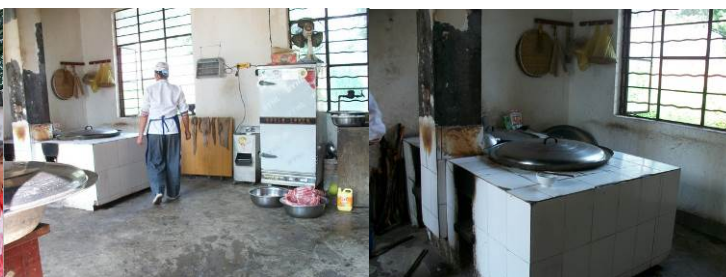
图 10 灶台