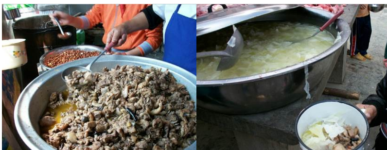
图 18 当日午餐菜品