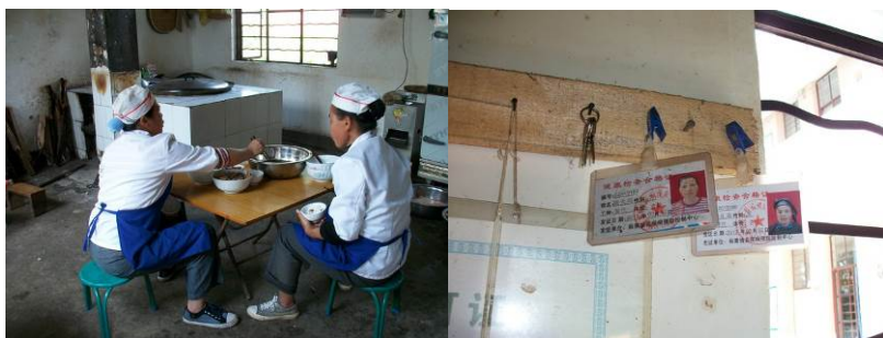
图 7 两名厨师图