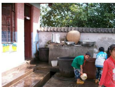
图 9 厨房

关于厨房设备,有消毒柜一台,冰柜一台,蒸饭机一台,切菜机一台。调查人员发现,该校并没有启用蒸饭机,而是一直用木蒸子蒸饭,据校长解释,蒸饭机需三相电支持,要等搬进新厨房才能使用。调查人员查阅账簿发现,该校 2012 年 11 月采购的蒸饭机,一直闲置了一年。