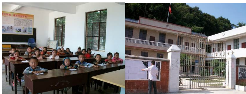
图 6 在村委上课的学前班