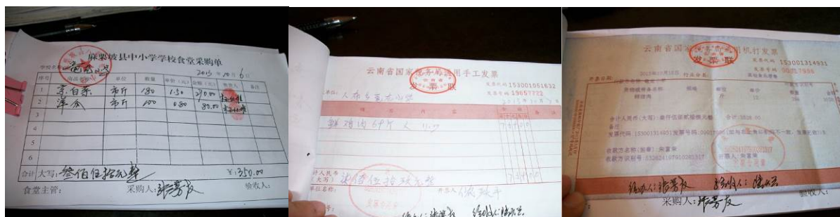
图 21 原始凭证