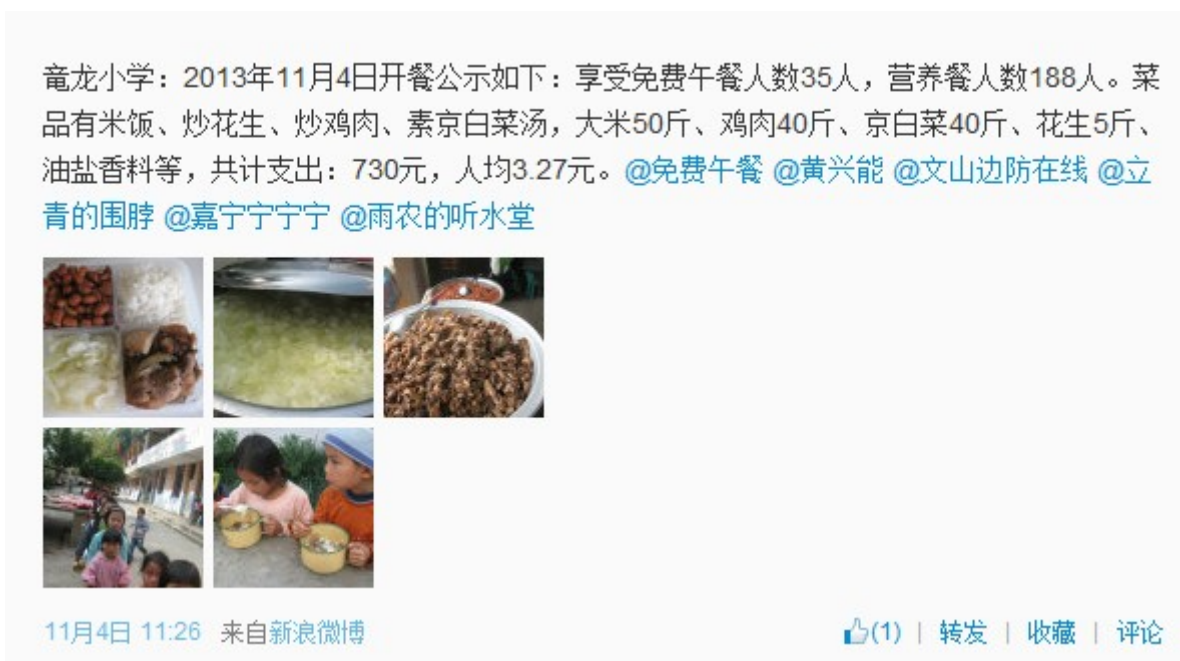
图 5 就餐人数的微博截图

(3) 享受营养餐 188 人是全勤人数, 而当日有 9 人请假, 微博公示未做用餐人数的扣减。