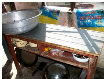
图 11 工作台