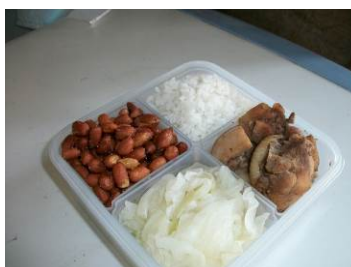
图 15 菜品留样