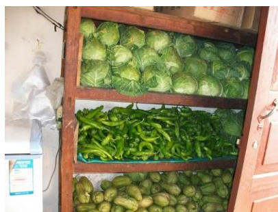
图 19 库存

关于采购监督,校长向调查人员介绍,学校通过以下程序对采购环节进行监督:负责账务的老师兼任采购员,厨师负责验收,校长负责证明及审核。