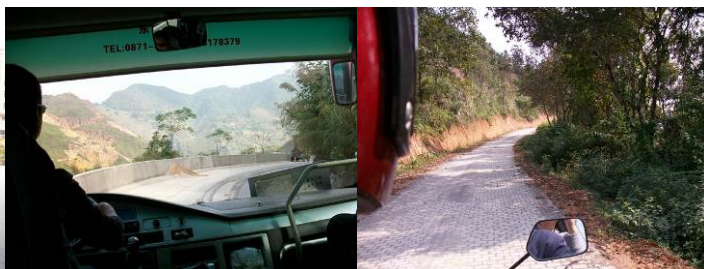
图 2 路况