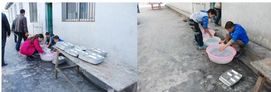
图 16 学校值日生在清洗餐盘