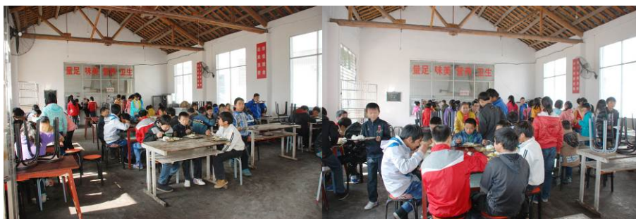
图 12 学生餐厅用餐组图