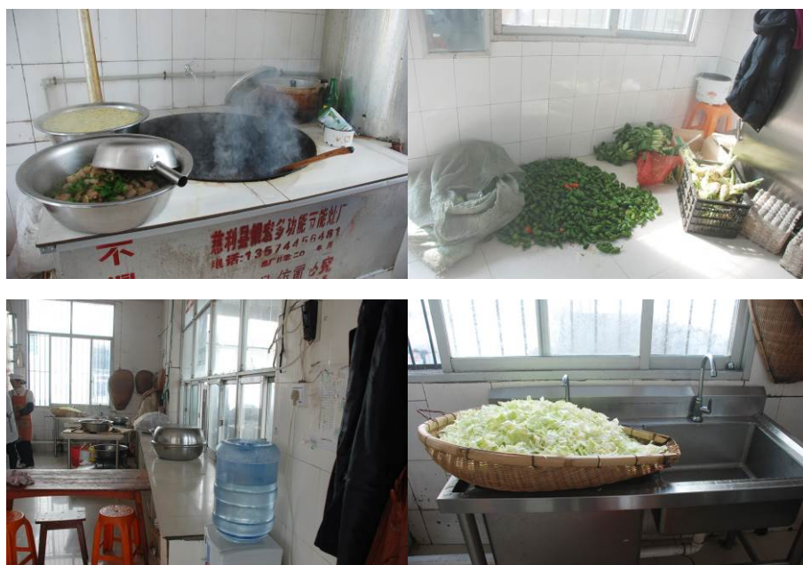
图 10 厨房组图