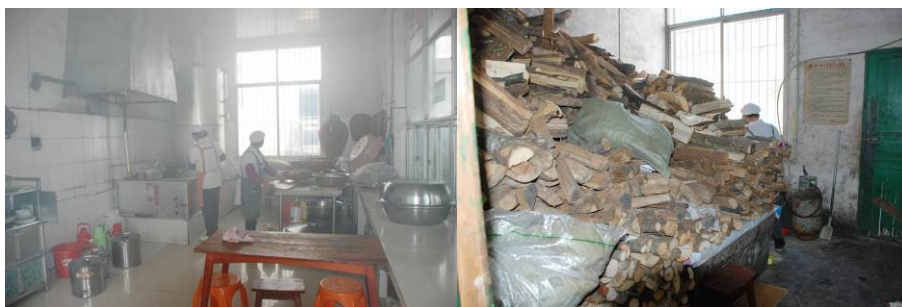
图 9 厨师正在备餐组图

调查人员中午 11: 35 到达该校, 对该校的食堂操作间进行了突击检查, 发现 3 位厨师都有着工作服、戴帽子正在备餐, 且比较干净整洁。有健康证。