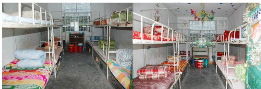
图 18 学生宿舍