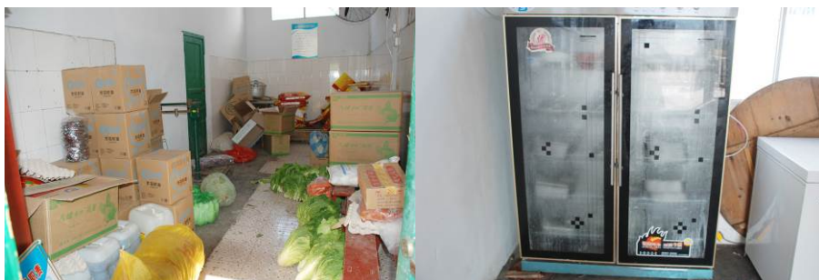
图 13 储物间