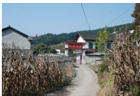
图 2 学校外景

北镇学校地处湘鄂交界的走马镇北镇村, 前身为北镇中学, 2010 年通过校点布局调整, 将原北镇中学、北镇小学、大典小学合并为现在的九年一贯制寄宿制学校—北镇学校。现有在校学生 224 人 (含学前班 35 人), 教学班八个, 在职教师 24 人, 厨师 3 人。北镇村、杨坪村、九岭村等自然村的学生在此就读。寄宿生 136 人, 走读生 88 人。教师 24 人, 厨师 3 人。2011 年 12 月免费午餐正式在该校开餐。