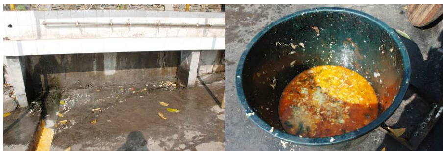
图 17 浪费现象较以前有明显减少