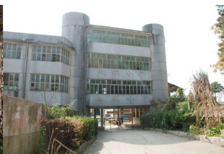
图 3 学校分校区外景