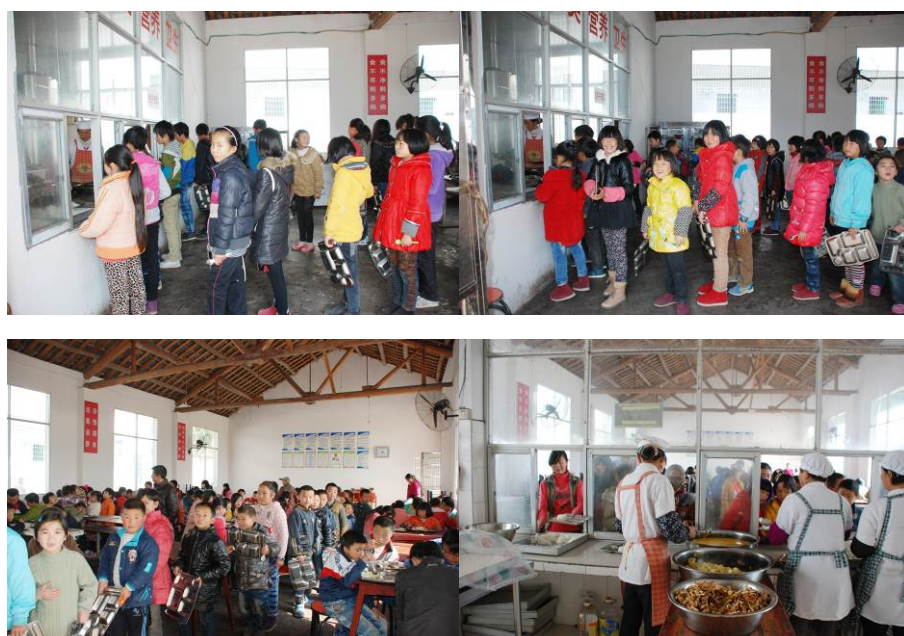
图 11 学生排队打餐组图

调查者观察到,该校下午 1 点才下课,初中生先就餐,然后才是小学生就餐。学前班和一年级的饭菜由学校送到分校去。学生中只少数有餐前洗手,但都自觉在食堂排队领餐。餐盘由学校保管,汤匙自己保管。用餐完毕后餐盘先由自己简单冲洗、再由值日同学用放有洗洁精的水洗净、清洗后放入消毒柜做消毒处理。