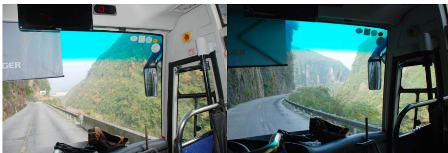
图 1 去往学校的途中

三峡, 属湖北省恩施自治州东南边陲重镇, 素有“鄂西南窗”之称, 是湖北省定 25 个重点口子镇、27 个老区乡镇、50 个小城镇建设重点镇之一。镇域国土面积 467 平方公里, 辖走马坪、古城、官仓、北镇、曲溪、时务、千斤、升子、红土、楠木、栗山、汪家包、刘家垭、九洞、水坪、大典、金龙、花桥、梅坪、金山、大沟、红罗、杨坪、杜家、阳河、芭蕉、白果、金岗、柘坪、李桥、周家峪、刚家湾、九岭 33 个行政村, 1 个社区居委会, 总人口 5.56 万人。境内青山叠嶂, 夹有平川丘陵。