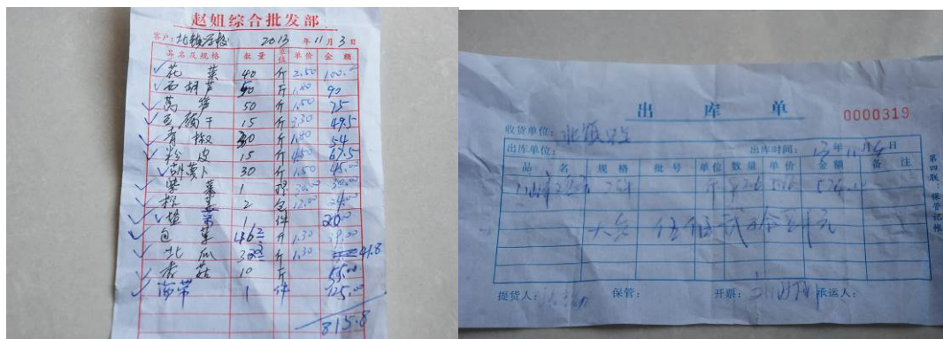
图 20 采购凭证组图

由王群芳老师验收入库; 定期由出纳结帐。油是中储粮送的金鼎菜子油, 还没吃完。学校采购价格除鸡蛋外(当地鸡蛋市场价格在 0.62 - 0.67/只左右)在当地不算高, 较合理。