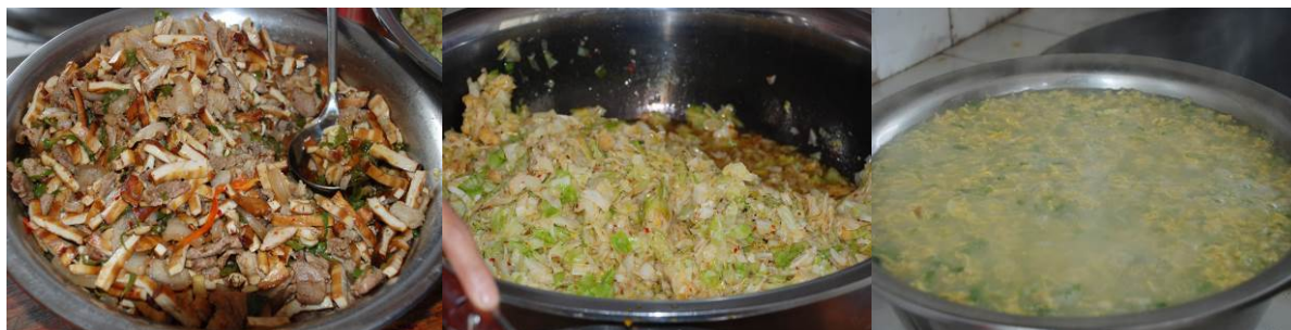
图 19 当日菜品

调查当天的菜谱为豆腐干炒肉、炒包菜和鸡蛋汤。与微博公示一致。调查者与学生共餐,感觉菜的口味还好。调查者从学生用餐的情况能看到,学生剩饭菜的情况比较少了。