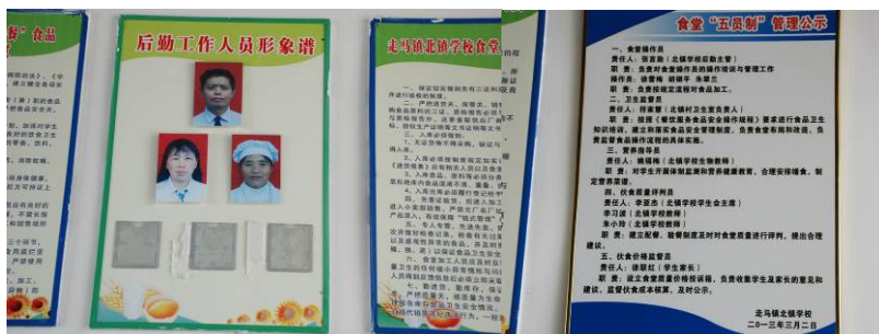
图 15 学校食堂管理公示

老师没有自己的食堂，与学生共餐。教师们在学生用餐完毕后，才开始用餐。该校没有组织学生餐前洗手，但组织排队打餐、制止浪费等方面都做得较好。未向学生提供乳质品，但不少学生反映打饭菜不公平。