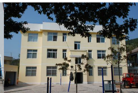
图 7 教师宿舍