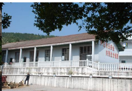
图 5 学校食堂