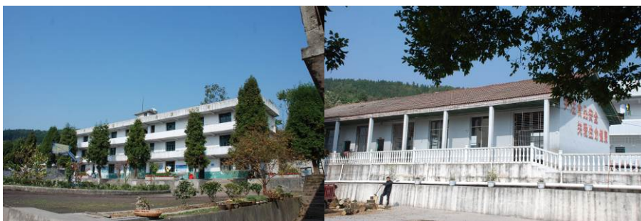
图 4 学校教学楼