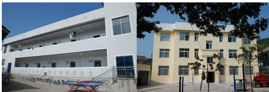
图 6 学生宿舍