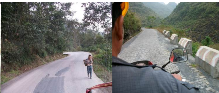
图 2 路况