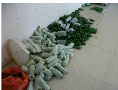
图 16 库存

关于采购监督, 采购专人负责, 作为经手人, 过秤的老师 (不固定) 作为证明人, 校长审核。单据做成凭证一个月上交中心校一次, 要求与区域内其他学校一样。