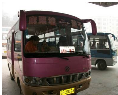
图 1 交通

荒田小学位于云南省文山州麻栗坡县八布乡，设有小学部 1-6 年级各 1 个班，没有学前班。从八布乡出发，摩托车以正常的车速行驶仍需 40 分钟才能到校，一路的翻山越岭，但路况较好，越野车或面包车能通行。回程的时候，是校长开着摩托车把我送到了八布乡，一路不忘告诉我，山脚的村庄是学校最远的寨子，家长为了每学期 375 元的补贴维持生活，只能委屈孩子每天徒步上学，天晴还好，下雨就苦了孩子（寄宿制的补贴是直接拨给学校的，只有非住宿的补贴才是拨给家长的）。