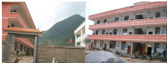
图 3 学校