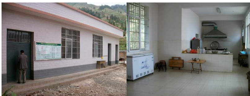
图 7 厨房