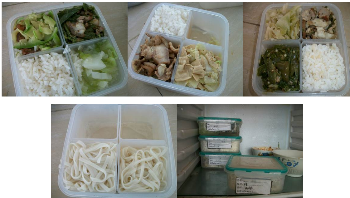
图 6 本周的食品留样 (一日三餐)

(3) 由于学校没有餐厅, 也不允许在课室吃饭, 所以, 现在没有固定的用餐地点。