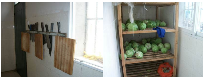
图 8 菜刀和菜板图