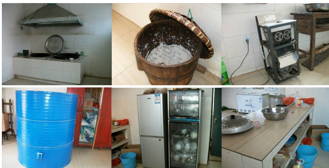
图 10 厨房设施及设备