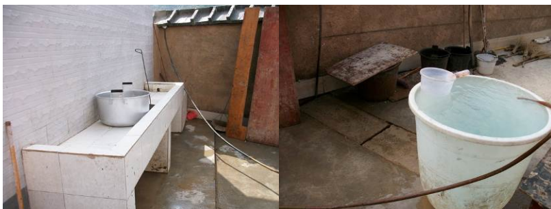
图 15 水槽