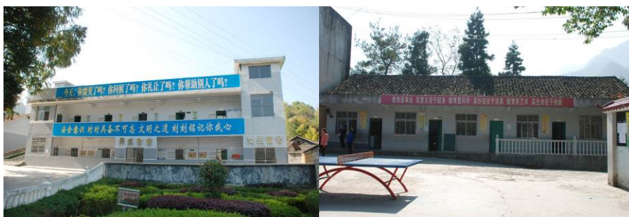
图 5 学生宿舍