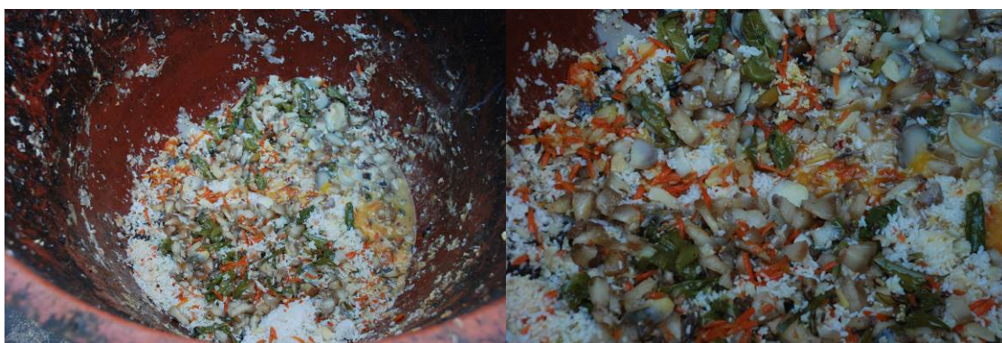
图 19 学生剩下的大都是肥肉