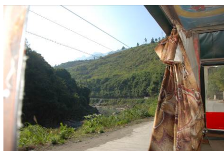
图 1 去往学校的途中

铁炉乡在烽火连天的岁月里, 曾是湘鄂边革命根据地的中心, 留下了贺龙元帅无数足迹, 被誉为贺龙元帅的“第二故乡”。当年, 该乡有数十人跟随贺老总出生入死闹革命, 有的还献出了宝贵的生命。