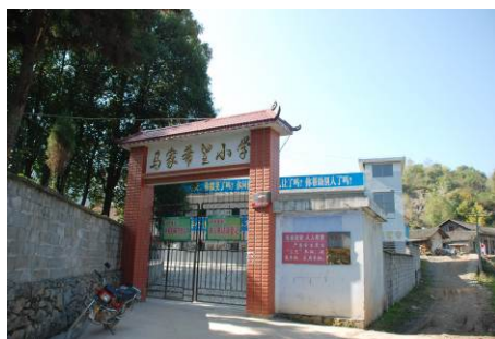
图 2 学校外景