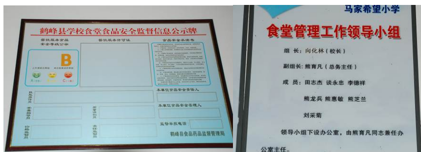
图 20 学校食堂管理信息公示