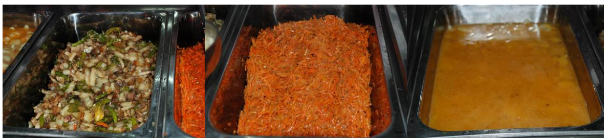
图 21 当日菜品

调查当天的菜谱为辣椒炒肉、炒胡萝卜和土豆汤。与微博公示基本一致。调查者与学生共餐，感觉菜的口味一般。当天的辣椒炒肉基本上全是肥肉，学生们大都不爱吃，扔掉了。