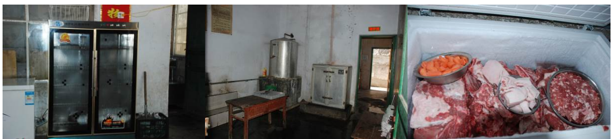
图 11 消毒柜正常使用