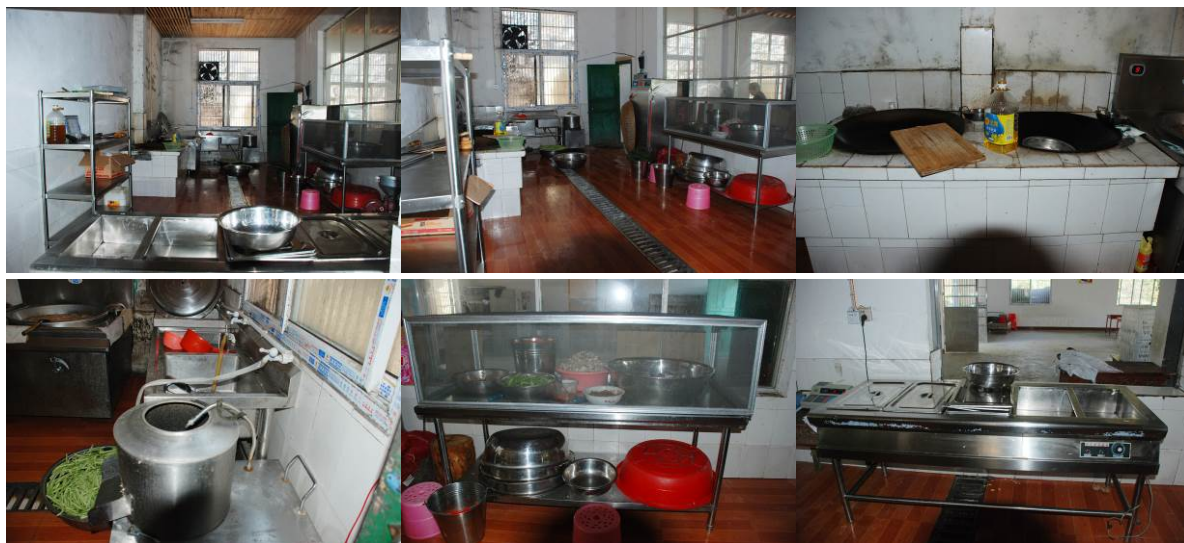
图 10 厨房组图

调查者到校后, 认真查看了该校厨房, 发现灶台、砧板、工作台还比较卫生, 地面, 墙面也较干净。整体卫生状况良好。