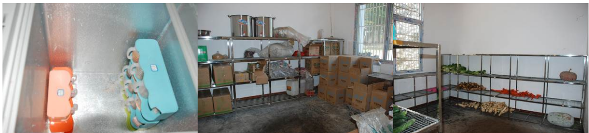
图 14 菜品有留样