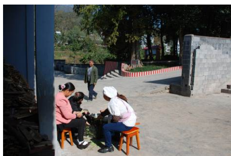
图 9 厨师正在择菜

调查者中午 11:00 到达该校, 对该校的食堂操作间进行了突击检查, 发现 4 位厨师只有 1 位着工作服、戴帽子, 其他 3 位未穿戴工服, 正在择菜, 比较干净整洁。有健康证。