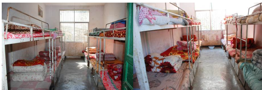
图 7 学生寝室