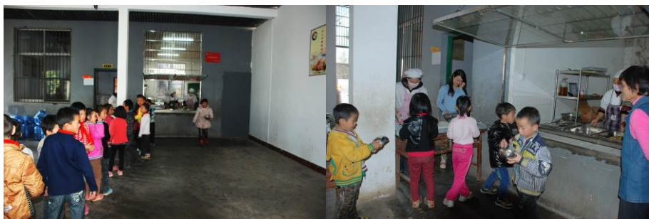
图 16 学生排队打餐

调查者观察到，该校下午 1 点才下课，学生们都自觉在食堂排队领餐。餐具由学校保管。用餐完毕后餐具由厨师统一清洗，再放入消毒柜做消毒处理。餐厅餐桌也由厨师打扫清理干净。