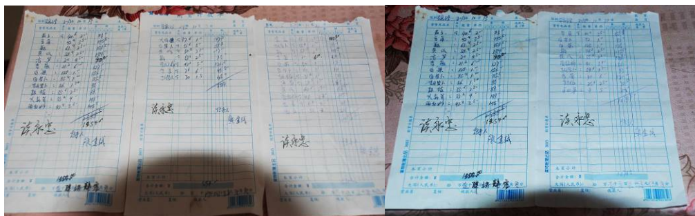
图 22 采购凭证组图