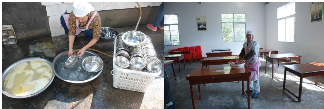
图 18 餐具及餐厅由厨师清洗打扫

老师没有自己的食堂，与学生共餐。教师们和学生同时用餐。该校没有统一组织学生餐前洗手，只有部分学生在老师的提示下去洗手。但组织排队打餐、制止浪费等方面都做得较好。未向学生提供乳质品，打饭菜也较公平。