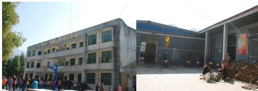
图 3 教学楼