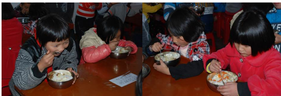
图 17 学生餐厅用餐组图