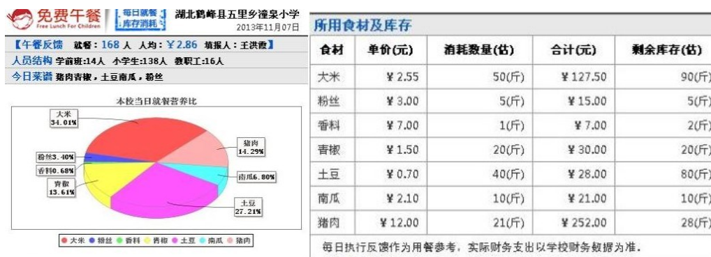
图 22 当日微薄公示