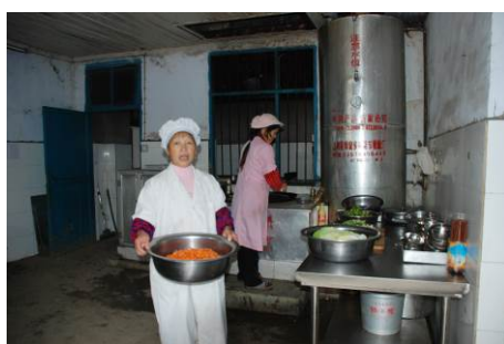
图 11 厨师正在备餐

调查人员中午 11:10 到达该校，对该校的食堂操作间进行了突击检查，发现 2 位厨师都有着工作服、戴帽子正在备餐，且比较干净整洁。有健康证。