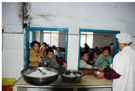
图 20 学生们还没吃饱，但没菜了

老师没有自己的食堂，与学生共餐。教师们在自己的餐厅用餐。该校没有组织学生餐前洗手，但组织排队打餐、制止浪费等方面都做得较好。未向学生提供乳质品，打饭菜也较公平。学校没有菜品留样。因学校伙食一直不怎么好（老师反映）所以学校老师们对此非常不满。