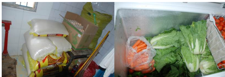
图 13 储物间