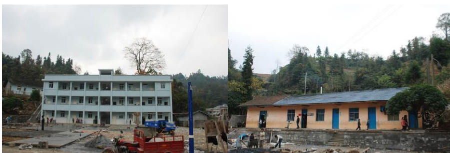
图 4 学校新建的教学楼