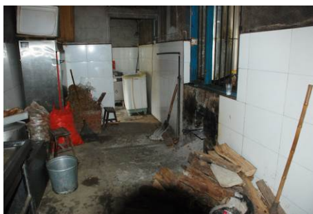
图 15 柴房