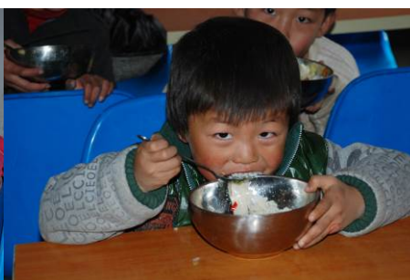
图 18 学生餐厅及餐厅外用餐组图