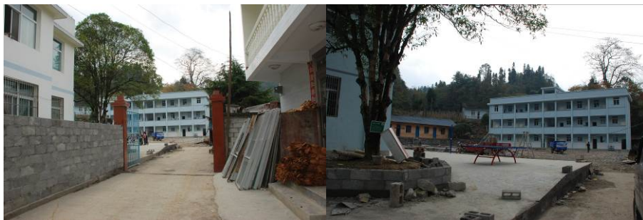
图 2 学校外景

在校小学生 138 人, 学前班 17 人, 有教学班七个, 在职教师 12 人, 厨师 2 人。寄宿生 85 人, 走读生 70 人。2011 年 12 月免费午餐正式在该校开餐。