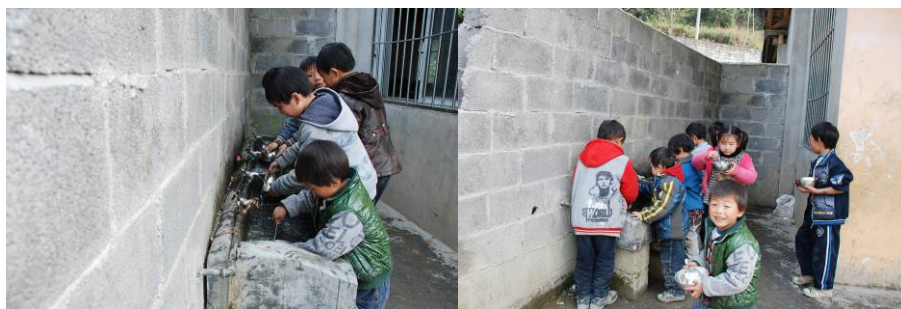
图 19 餐后学生自己用凉水冲洗餐具