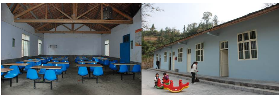
图 6 学校餐厅