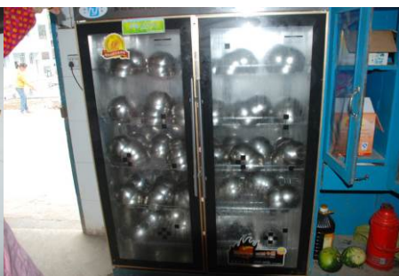
图 16 消毒柜正常使用