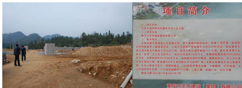
图 1 去往学校途中的湄坪村投资 1500 万在建新农村示范小学

五里乡位于湖北鹤峰县东南部, 毗邻五峰县湾潭镇, 东邻湖南省石门县, 西南分别与本县容美、燕子、走马接壤。全乡国土总面积 378.8 平方公里, 地势东高西低, 全境皆为山区, 群山连绵, 沟壑纵横, 平均海拔 1100 公尺, 是典型的二高山地区, 兼有低山河谷, 呈立体分布。五里现辖五里、瓦屋、紫荆、金钟、青山、杨柳、南村、水泉、十字路、寻梅、上六峰、下六峰、三路口、中坪、后坪、柏榔、潼泉、湄坪、红鱼、雉鸡、陈家 21 个建制村。