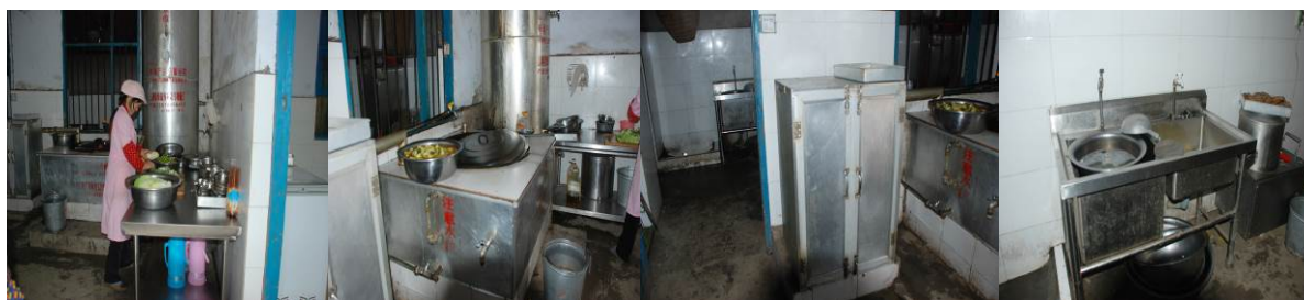
图 12 厨房组图

调查者到校后，认真查看了该校厨房，发现厨房卫生状况一般。灶台、砧板、工作台还比较卫生，但墙面、地面及洗水池不太干净。