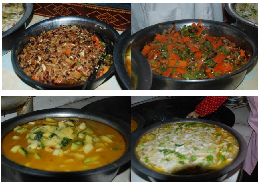
图 21 当日菜品