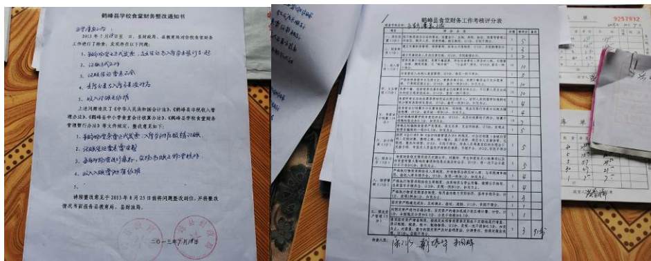
图 25 该校在鹤峰县食堂财务工作考核中得分 91 分