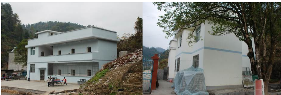
图 8 学校新建学生宿舍