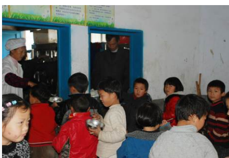
图 17 学生排队打餐组图