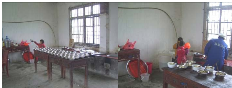
图 5 学生喝凉水图

通过对 60 名小学生其中 15 名进行访谈, 大部分都反映良好, 很爱吃, 能吃饱。少数学生有不爱吃, 吃不完的浪费现象, 基本上人人都喝凉水解渴。