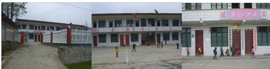
图 3 学校组图

东风村距扶罗镇约 1 华里, 道路平坦, 与平溪河为伴, 学校就建在河边, 据说在解放前这儿就是村里的学校距今约七十年历史。全村三百户人家, 人口约 600 人。东风村小在村边, 过了桥 300 米就是大公路, 南通往扶罗镇北可直接去县城。交通便利、用水方便。学校与该村村委共用一栋楼房(一层是村委会二层是学校), 该校学生为东风村 55 人, 桂贡村 9 人, 全为走读生。桂贡村距校 6 华里, 学生上学时还要经过公路, 均由家长接送。该校现有三个班级, 学前班 44 人, 一年级 12 人, 二年级 8 人, 共有学生 64 人, 教师 2 人, 厨师 1 人。