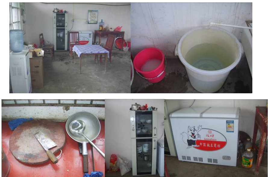
图 7 厨房组图