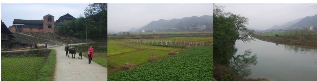
图 2 东风村组图