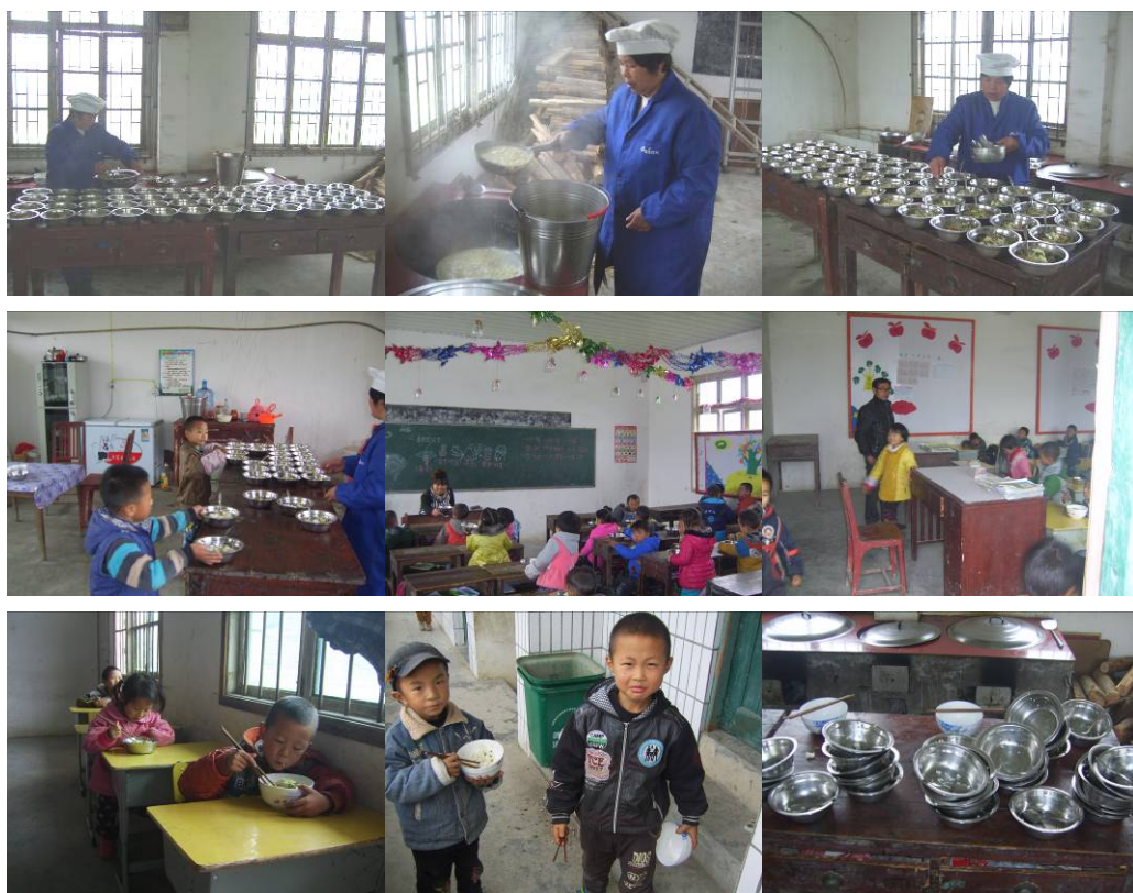
图 9 学生就餐组图