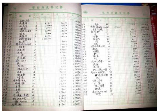
图 12 账目图