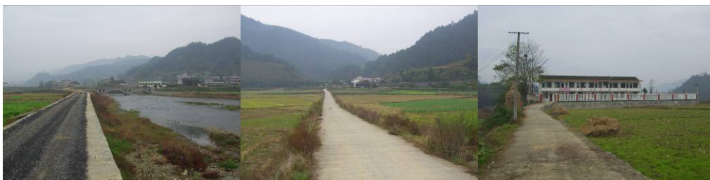
图 1 去往学校路况组图

调查人员 11 月 25 日早晨 7:00 从长沙住所乘公交车 (301 路、118 路, 票价 4 元) 至长沙火车站 8:20 出发 (T87 次列车, 票价: 72 元), 于中午 14:20 到达怀化火车站, 步行至怀化汽车西站, 转乘下午 15:00 发往新晃县的快巴 (票价: 35 元, 保险 1 元), 下午 14:30 到达新晃县汽车站, 当晚就宿于车站附近“家庭旅馆” (住宿费: 40 元/天)。于 11 月 27 日上午 8:30 从新晃汽车站乘发往凉伞的中巴车前往扶罗镇东风村小学, 约 9:30 在扶罗镇政府门口下车 (票价: 8 元), 咨询得知东风村距镇政府约 1 华里, 由于时间充分便步行前往学校, 11:00 左右到达该校进行调查, 下午 3:00 由学校步行至公路口, 乘过往中巴车返回新晃县城 (票价: 8 元)。