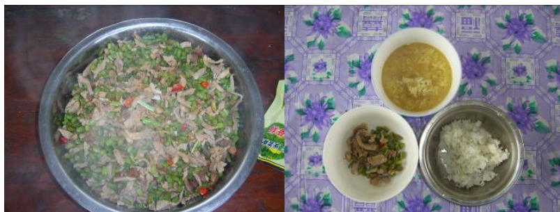
图 10 当日菜品

调查当天的食谱为嫩椒炒猪肉、炒青豆角和西红柿鸡蛋汤。与微博公示一致。调查人与学生共餐，感觉菜的口味咸淡适中，菜中全为瘦肉。从学生用餐的情况看，学生浪费不多。