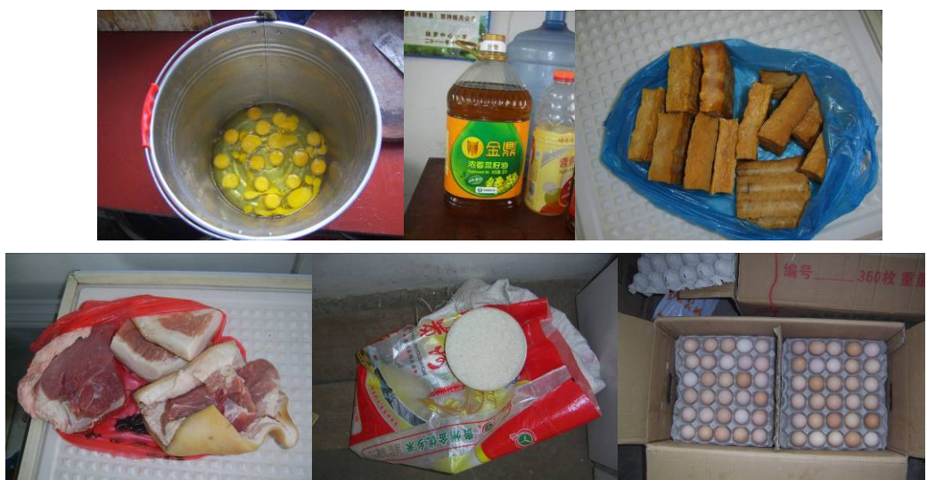
图 8 食材组图