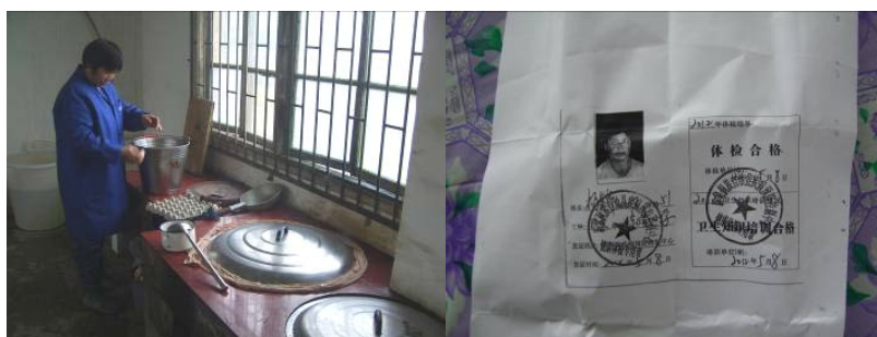
图 6 厨师及健康证

调查人员中午 11 点到达该校, 学校还在上课, 厨师正在备餐。发现厨师着工作服, 没戴帽子正在备餐, 比较干净整洁, 有健康证。