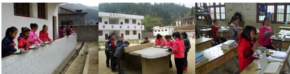
图 10 由于餐厅较小高年级学生在操场和教室用餐组图