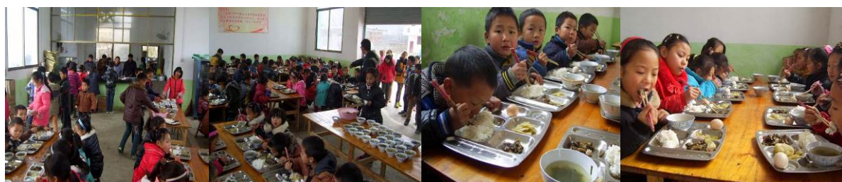
图 9 学生教室用餐组图