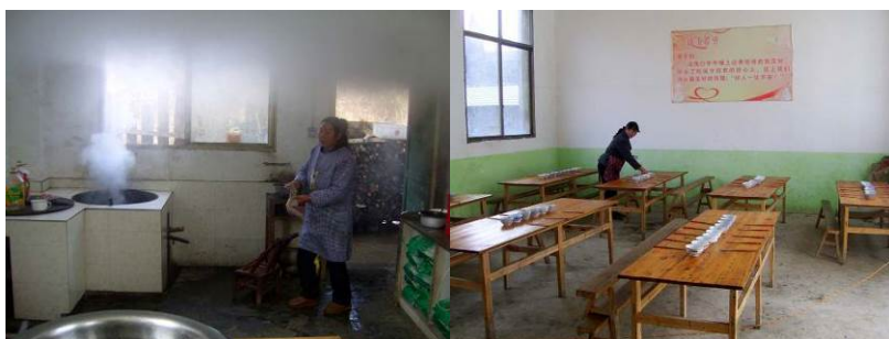
图 6 厨师正在备餐组图

调查人员中午 11 点到达该校, 学生正在上课, 校门从里面锁着。调查人员喊开校门, 讲明身份, 经该校老师的同意对食堂操作间进行了突击检查, 发现 2 名厨师围着围裙正在备餐, 且都比较干净整洁。