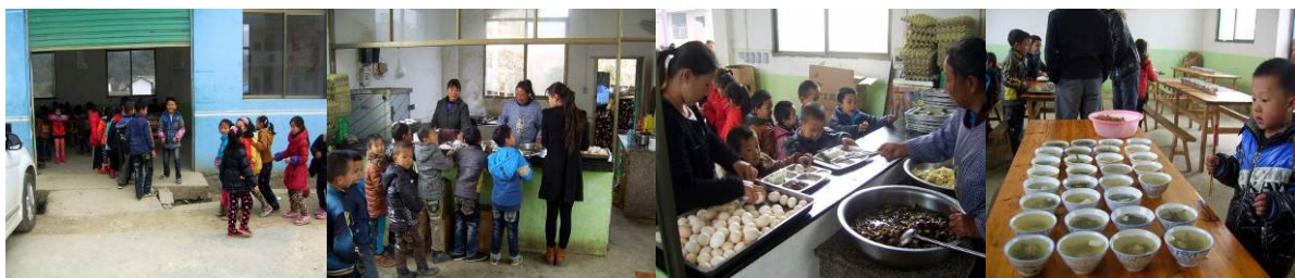
图 8 学生排队领餐组图

在餐桌上,将做好的排骨汤盛在碗里,然后学生排队在厨房的分餐台上领取厨师和值日老师为学生打好的餐盘,就餐结束后,餐具由厨师统一清洗、消毒和保管。