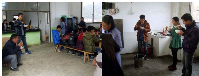
图 12 老师用餐组图