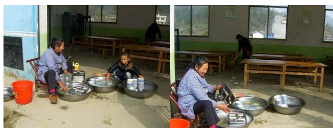
图 11 厨师正在洗碗一学生过来帮忙后被老师支走