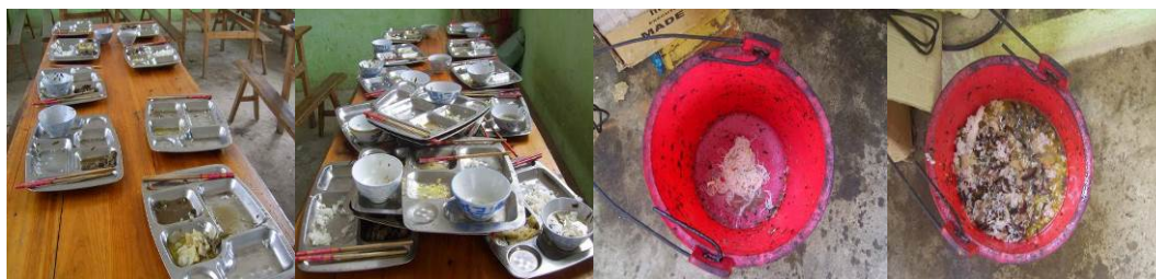
图 15 学生用餐完毕后的剩菜剩饭情况