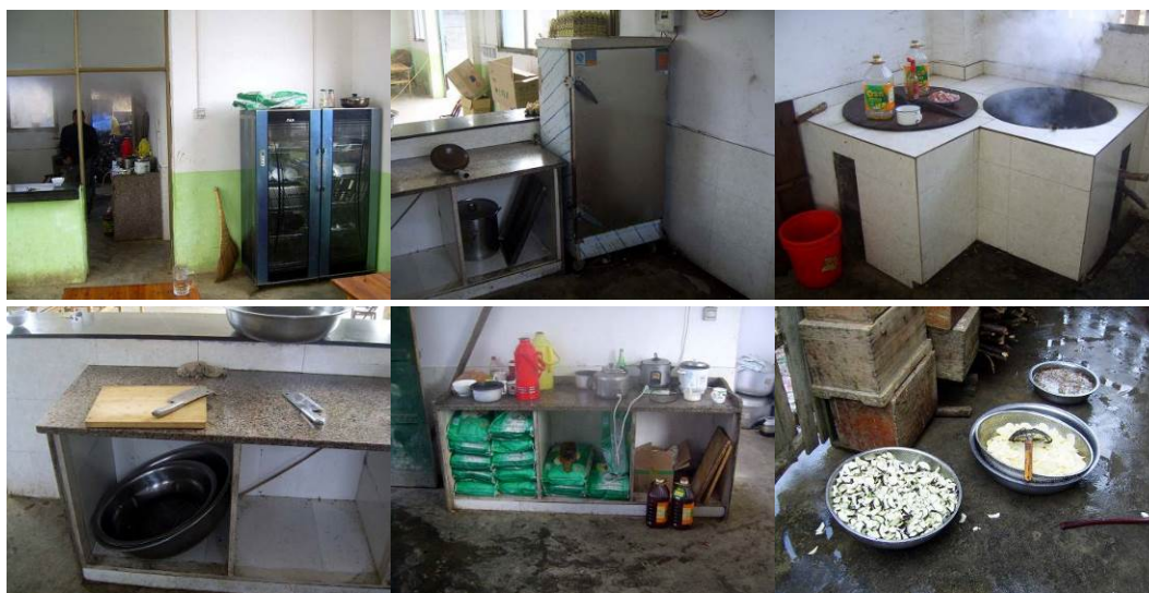
图 7 厨房组图

调查人员到校后, 查看了该校厨房, 均发现厨房卫生、灶台、操作台, 菜板都比较干净, 物品摆放比较整齐。