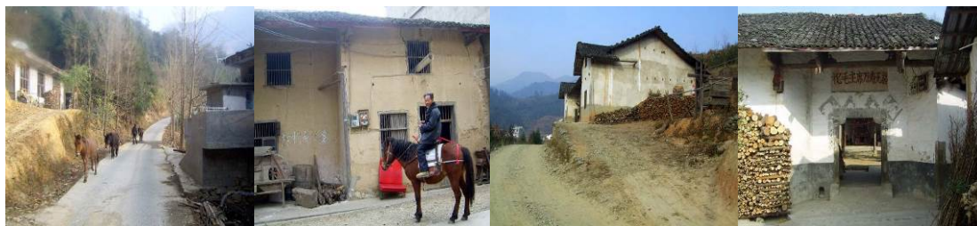
图 20 当地百姓生活组图

调查人员认为船舱村地处偏僻,老百姓的生活还很艰苦,许多青年(包括喻校长在内)一腔热血满怀壮志前来支教,但都被当地的恶劣环境所影响,造成学校老师流动性大,人心不稳。