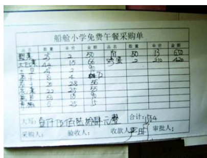
图 16 采购凭证