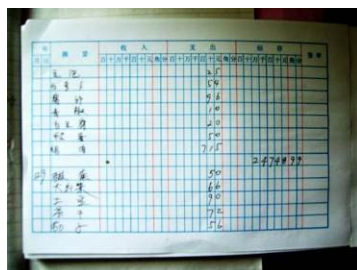
图 17 账目组图