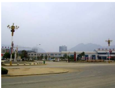
图 2 修水县城

修水县，古号分宁，国史有上望之称，位于江西省西北部，修水上游，地处幕阜、九岭山脉之间，地势周高中低、西高东低，海拔最高点 1715.5 米，修水自西向东汇经赣江入鄱阳湖，年均温 16.5℃，年降水量 1580 毫米，日照充足，山川秀美，人杰地灵。宋代黄庭坚诗书双绝，与苏轼齐名。桃里陈氏“一门五杰”（陈宝箴、陈三立、陈寅恪、陈衡恪、陈封怀）蜚声海内外。在现代革命史上，秋收起义首先在修水爆发，是湘鄂赣革命根据地的中心，是南方重点林业县。修水县地处赣西北，以农业水稻为主。