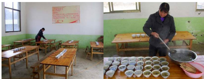
图 5 此组图足可见厨师公平打饭

(4) 饭菜的口味还可以，就是颜色搭配上欠佳，看了没食欲，造成大多数人认为饭菜不好，此项扣 1 分；