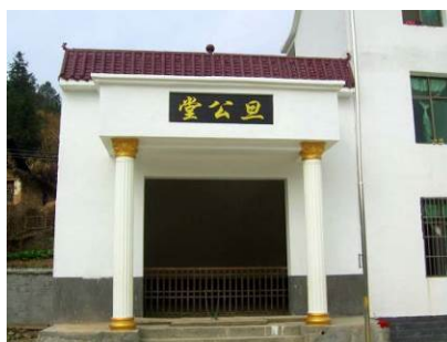
图 19 学校的土地上为村里建的旦公堂

(4) 学生餐厅太小,一部分学生没有就餐的地方,端着碗乱跑。调查人员发现学校中央建了个崭新的旦公堂,校长回应不让问,自己也说不清楚。调查人员建议该校在学生餐厅问题上与相关部门做好协商,把空置的旦公堂兼做学生餐厅使用。