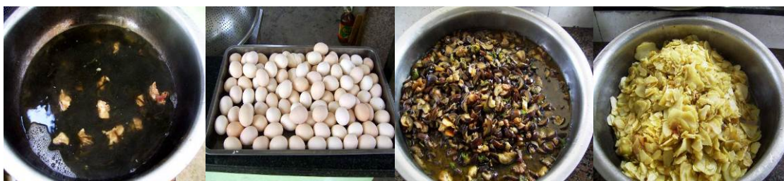
图 13 当日菜品

调查当天的菜谱为茄子青椒炒肉、炒土豆片、海带排骨汤和煮鸡蛋。与微博公示一致。调查人与学生共餐，感觉菜的口味还可以，就是颜色搭配上欠佳。虽然大多数学生反映不好，但调查人从学生用餐的情况能看到，学生剩菜的情况相当少。