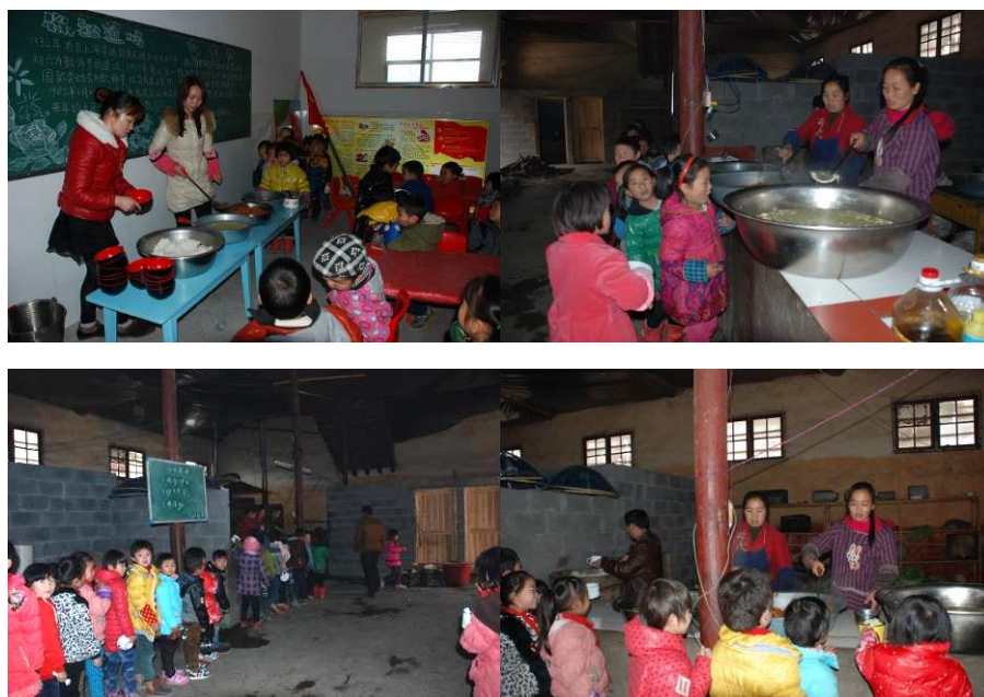
图 11 分餐图组（分餐秩序井然）