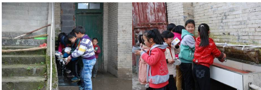
图6 只有两小洗手池，学生餐后自己用凉水洗餐具