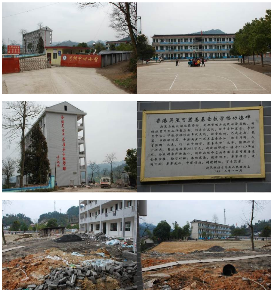
图 1 学校组图（在建新教学楼部分资金由香港吴星可慈善基金会捐赠）

学校因有寄宿生，早、午、晚餐都开餐，发给厨师工资 1200 元/人/月；收取寄宿生早、晚餐 3 元/餐，午餐不收取费用。