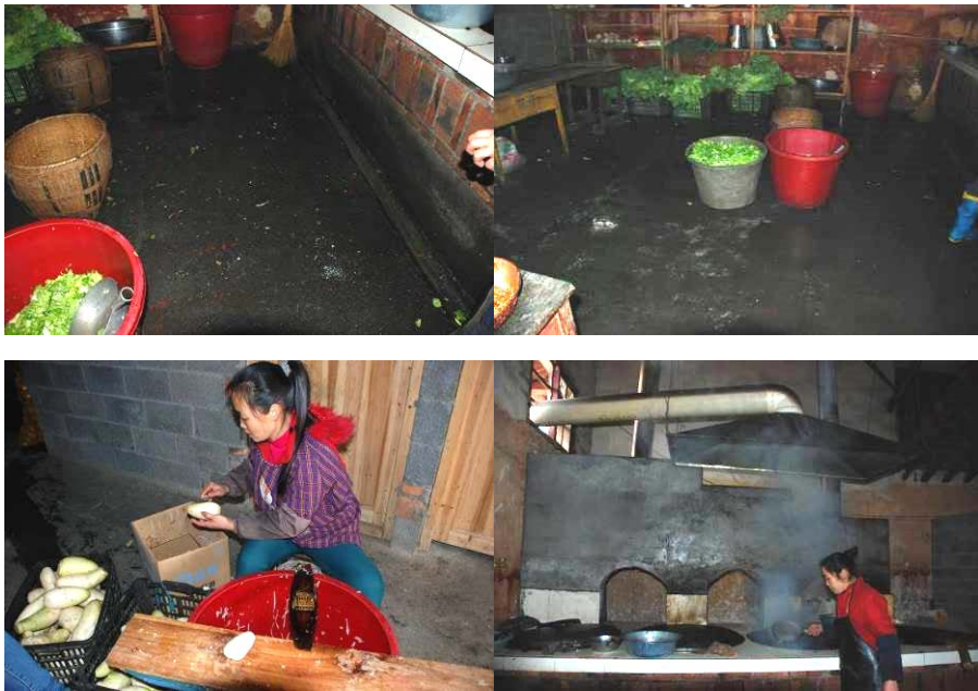
图3 厨房、厨师图组（厨房暂时租用以前乡里的粮库）