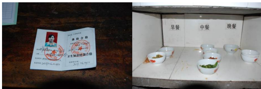
图 8 健康证（有位厨师的因去重办还没拿回校）