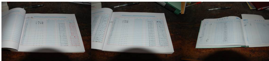
图 18 现金流水账