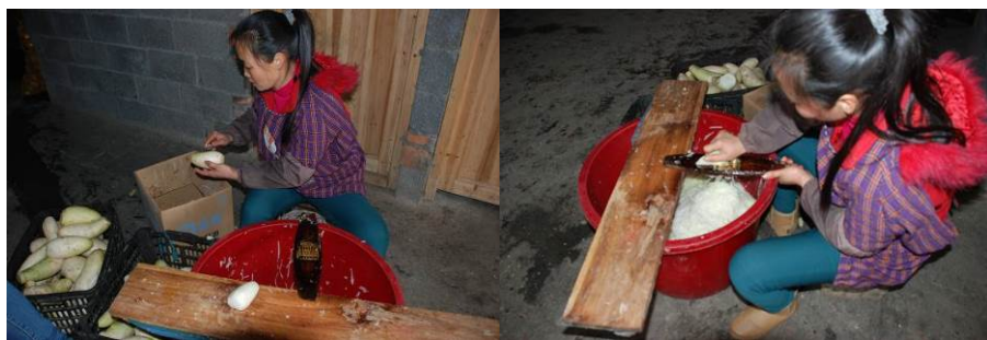
图 19 这位厨师有时要刨差不多一整天的萝卜或土豆，她说晚上睡觉时胳膊都会酸疼