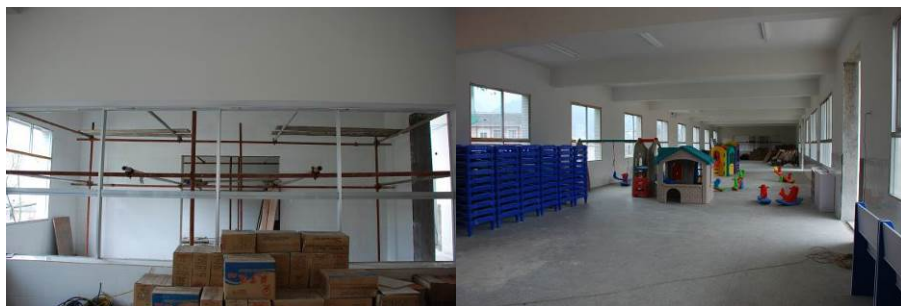
图 2 学校新建食堂和餐厅尚未交付使用