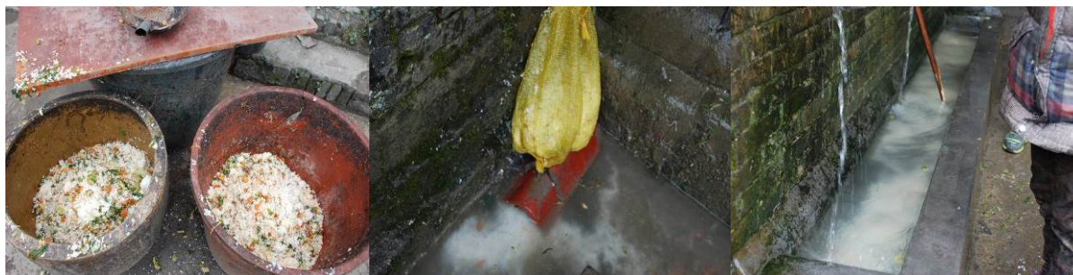
图 13 剩饭菜有些多了 (有些剩饭菜直接冲到地沟里去了)