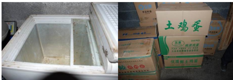
图5 食材储存摆放凌乱且冰箱内不干净（但未发现腐败变质食材）