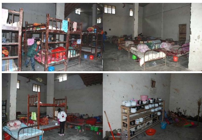
图 14 寄宿生暂时住在废弃的粮库里