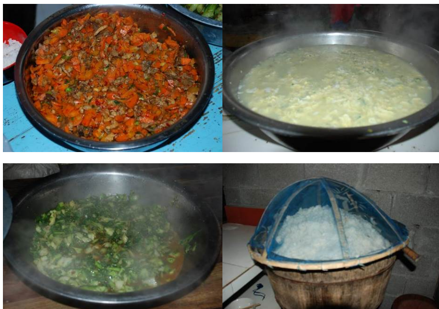
图 7 当天菜品