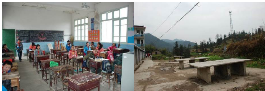
图 15 学校破旧的课桌及简易的乒乓球台