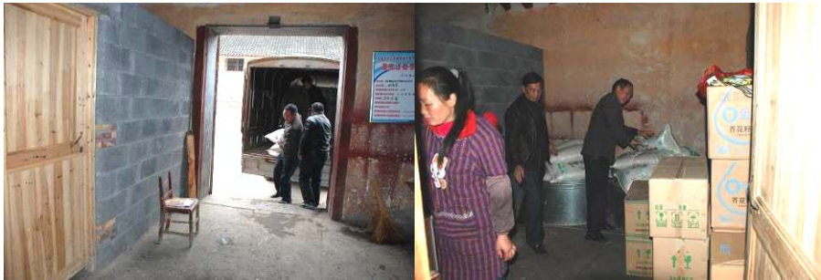
图4 正逢学校采购回来（副校长及总务等亲自搬大米）