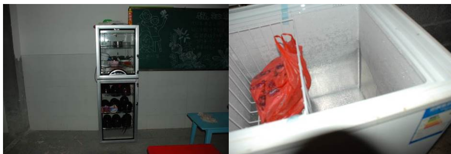
图 10 消毒柜（学前班）及冰箱等设备正常使用