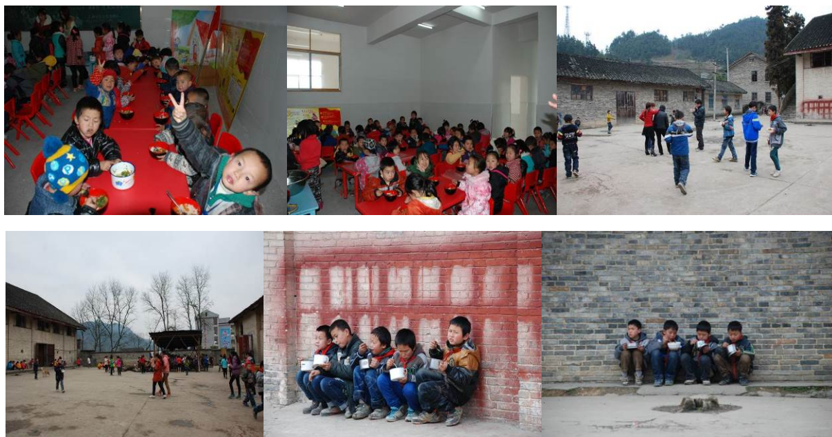
图 12 学生用餐图组