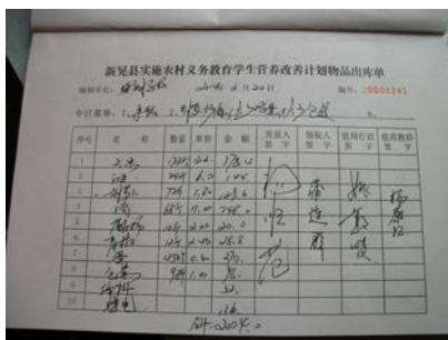
图 14 出库单

关于其他说明: 该校与其他学校一样, 以纸质凭证与电子账混搭的模式完成财务工作。