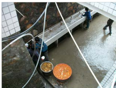
图 13 餐余

(2) 该校水槽旁有两个大桶专用于餐余收集，初见大桶满满的，调查人员观察许久，发现孩子们大部分光盘，只有个别有剩余，而洗碗则多有习惯把水倒进桶里，现场所见，浪费不多，餐余在合理范围内，只是学校没有及时清理。