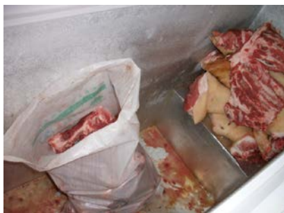
图 5 冰柜