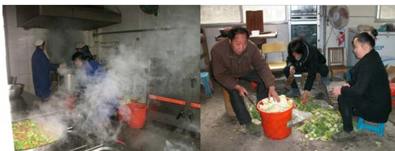
图 4 厨师

(1) “厨师头部卫生”取分值“3”，原因为 5 个厨师，有 2 个有帽子，有 2 个没有帽子，另 1 个不在现场无法判断;