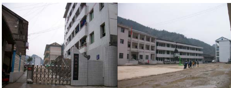
图 2 学校组图