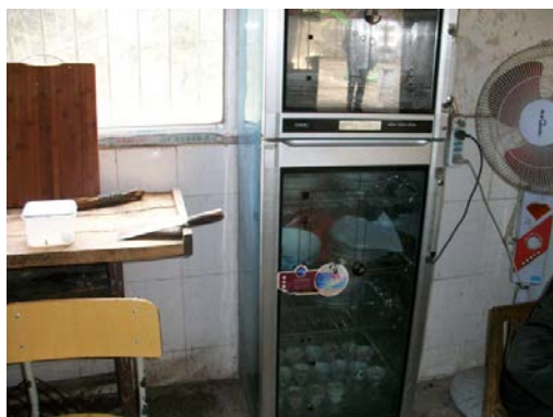
图 6 老师的消毒柜

(5) “饭前是否洗手”取分值“3”，原因为部分学生洗手（另：调查当日，学校安排有两个老师打了两大盆热水，在餐厅门口为低年级的同学擦手，擦一个放行一个以致队伍很长，经调查人员私下向学生了解，过往并没有这个安排，明天有没有也不知道）。