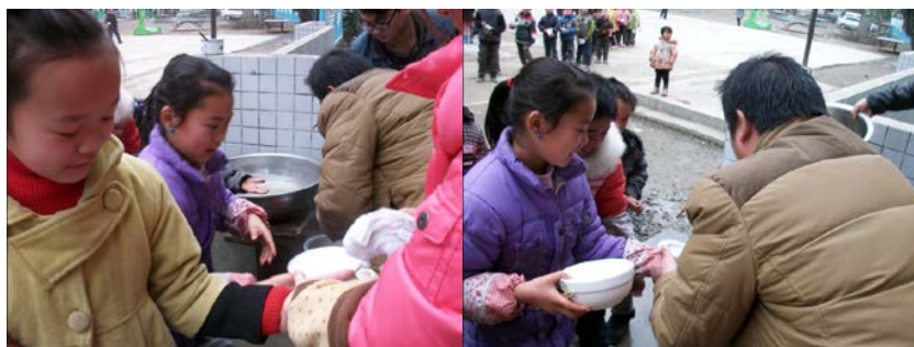
图 7 餐前老师为学生擦手

(5) “饭前是否洗手”取分值“3”，原因为部分学生洗手（另：调查当日，学校安排有两个老师打了两大盆热水，在餐厅门口为低年级的同学擦手，擦一个放行一个以致队伍很长，经调查人员私下向学生了解，过往并没有这个安排，明天有没有也不知道）。