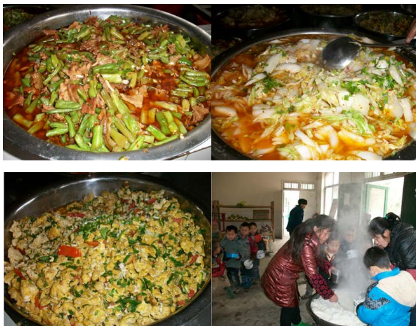
图 10 当日供餐