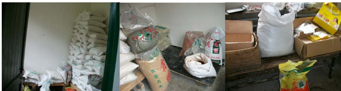
图 8 储藏室