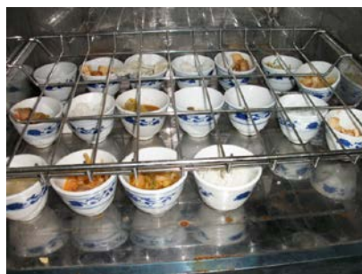
图 11 消毒柜内的食品留样

关于扣分说明: “菜品留样”取分值“1”, 原因为该校有留样, 但是存放不合规 (存放于消毒柜里), 也没有相关文字记录。