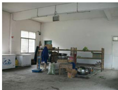
图 9 厨房大厅