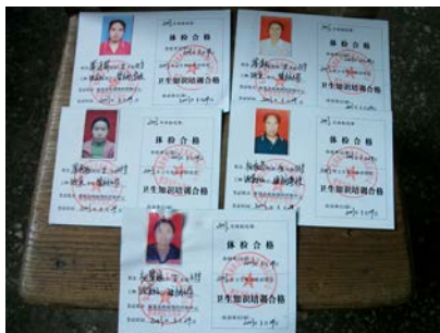
图 12 厨师健康证

(2) 该校水槽旁有两个大桶专用于餐余收集，初见大桶满满的，调查人员观察许久，发现孩子们大部分光盘，只有个别有剩余，而洗碗则多有习惯把水倒进桶里，现场所见，浪费不多，餐余在合理范围内，只是学校没有及时清理。