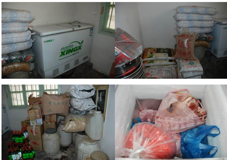
图 11 储藏室物品摆放较整齐