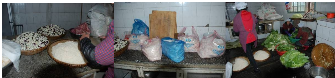
图 5 已淘洗的米放在地上, 且厨师在上面跨过

(1) “厨房工作台”项扣除 2 分, 扣分原因为工作台上摆放有点乱, 把已淘洗的米放在地上, 且厨师在上面跨过。(见图 5)