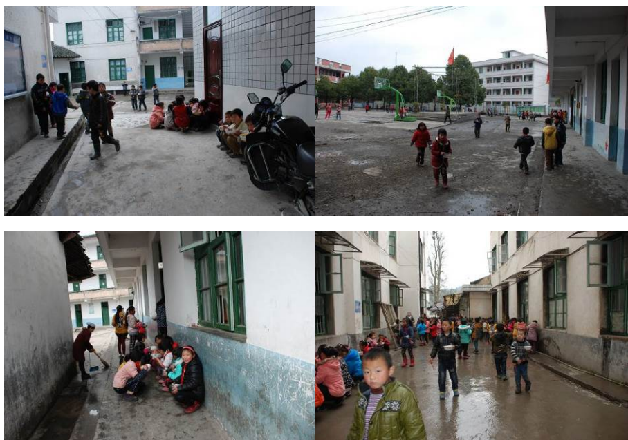
图 17 学生在外面用餐