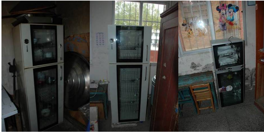
图 15 蒸饭机及消毒柜未妥善保存及时修理