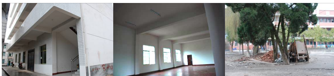
图 3 新餐厅于 2011 年始建,因在建中出事故到现在未验收,且一直占用操场,校方苦不堪言