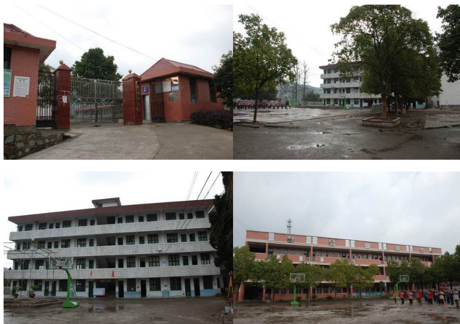
图 2 学校组图

学校因有寄宿生,早、午、晚餐都开餐,发给厨师工资 1200 元/人/月;收取寄宿生早、晚餐 2.8 元/餐(素菜)、3.8 元/餐(荤菜)。午餐不收取费用。