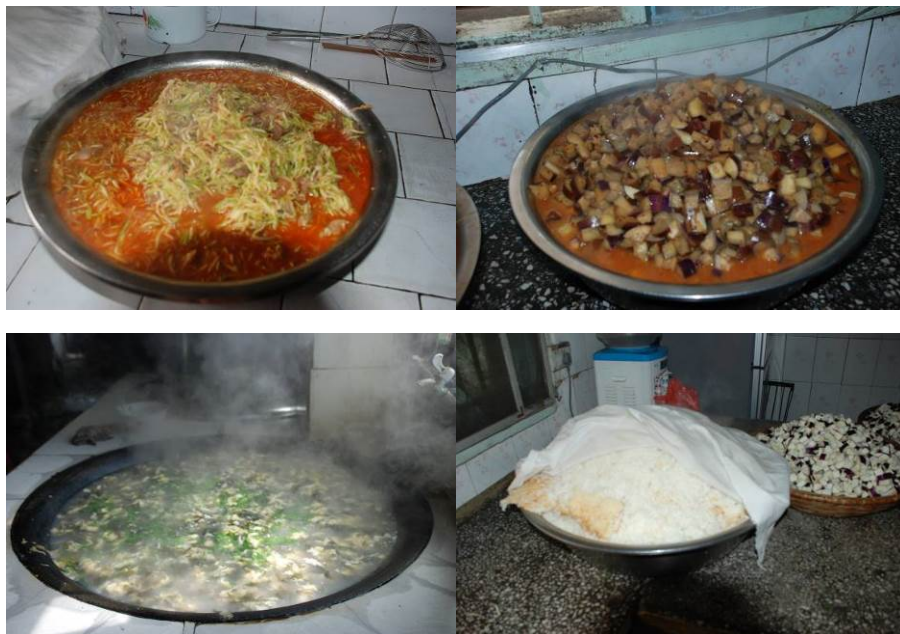
图 12 当天菜品及主食

各项扣分原因如下, 有照片为证: “口味”扣除 2 分, 扣分原因为茄子没有太煮熟, 且三个菜都用水煮, 味道一般。(见图 12)