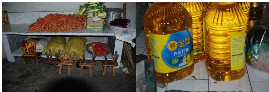
图 10 小厨房图组（兼做储藏室，物品摆放较合规范）