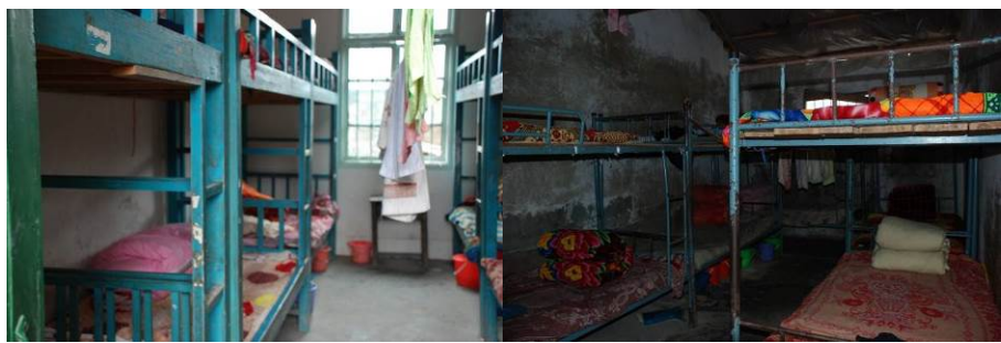
图 19 寄宿生宿舍