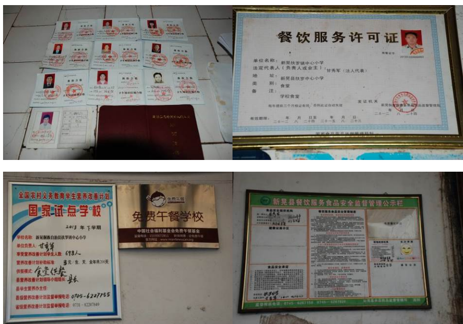
图 13 健康证及其他证照