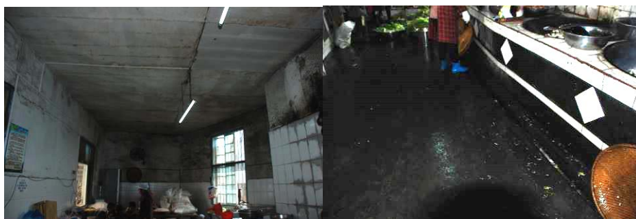
图6 墙面地面不干净

(3) “易变质食物是否妥善保存”项扣除4分，扣分原因为平时添加在菜品中的炸辣椒油未盖盖子，未冷藏，有食品安全隐患。(见图7)