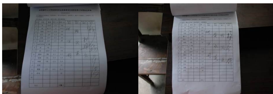
图 21 出库单