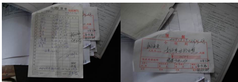
图 20 原始凭证