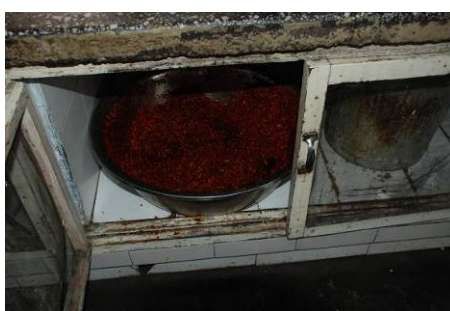
图7 辣椒油未盖盖子，未冷藏

(3) “易变质食物是否妥善保存”项扣除4分，扣分原因为平时添加在菜品中的炸辣椒油未盖盖子，未冷藏，有食品安全隐患。(见图7)