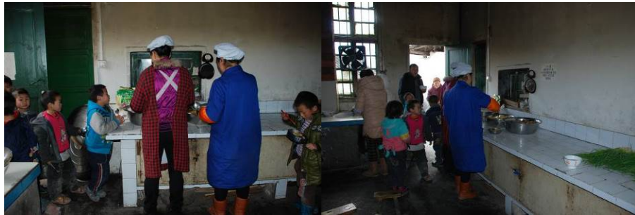
图 16 学生排队打餐组图