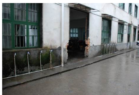
图8 洗手没池，且水龙头少

(5) “学生饭前是否洗手”项扣除2分，扣分原因为学生没有餐前洗手(学校没有条件提供近800名学生洗手的场地)。(见图8)