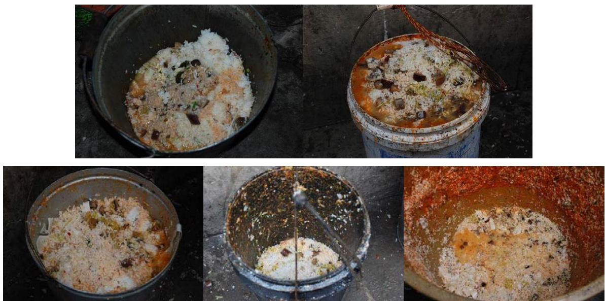
图 18 800 多人用餐，剩饭菜在正常范围